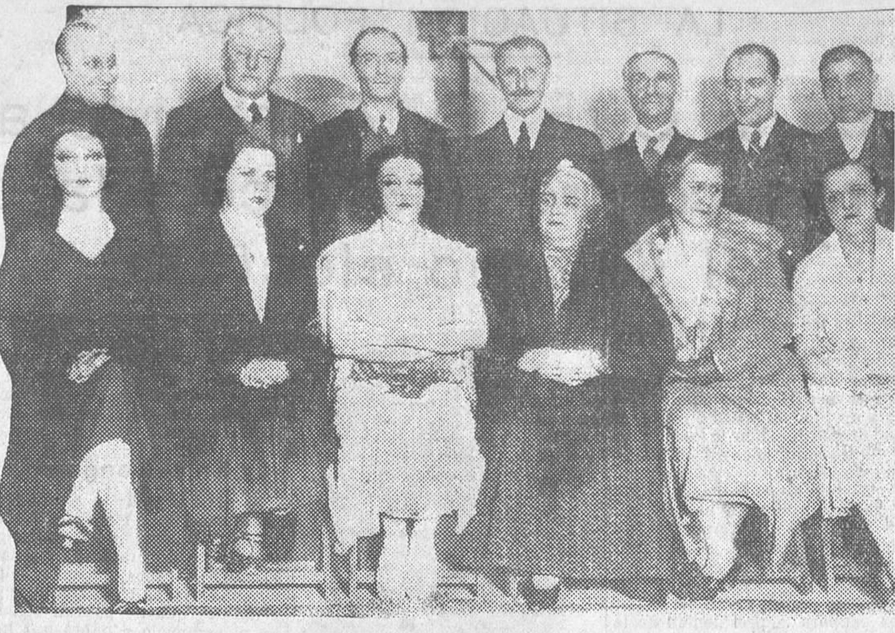
HOMENAJE A LOS HERMANOS QUINTERO.—Los celebrados comediógrafos con los principales actores del teatro Benavente, después de la función-homenaje que les fué dedicada anoche.