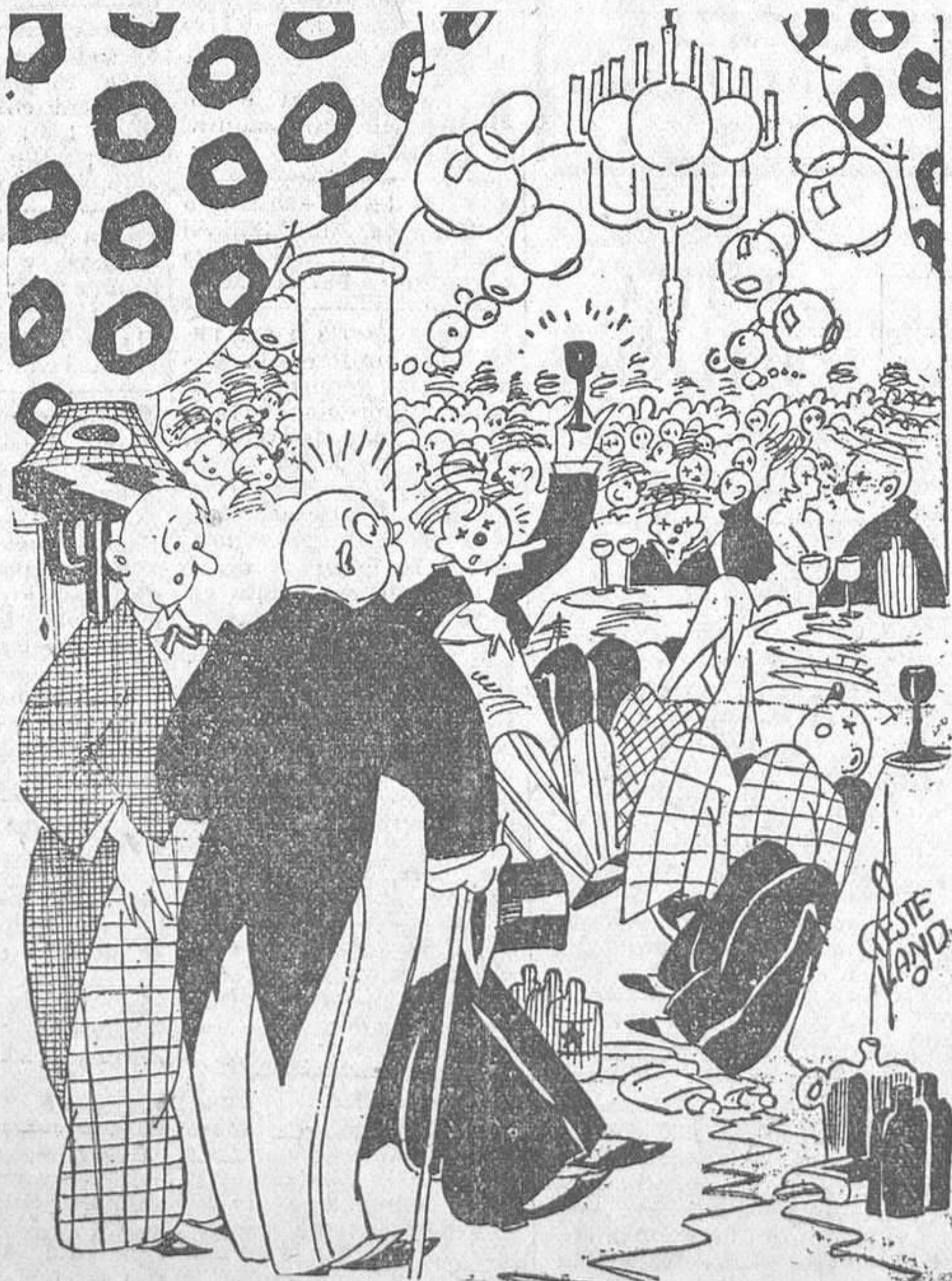
Los miembros de la Liga Antialcohólica de Nueva York celebran la abolición de la ley seca (De «Hovey»)