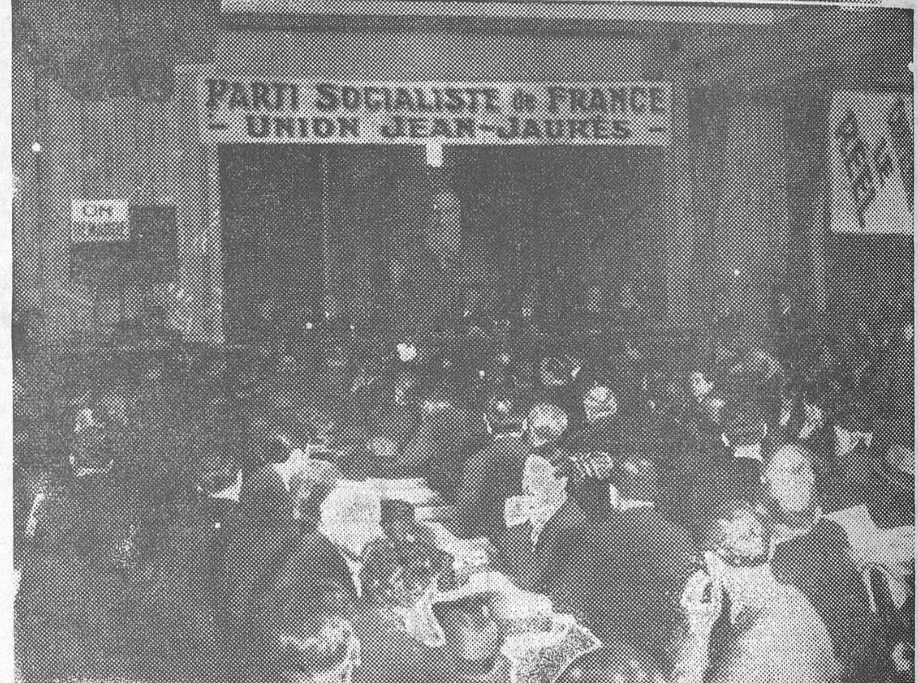
Aspecto que ofrecía la sala del Palacio de la Mutualidad, de Paris, en la sesión inaugural del Congreso Socialista (Grupo Jean Jaurés)