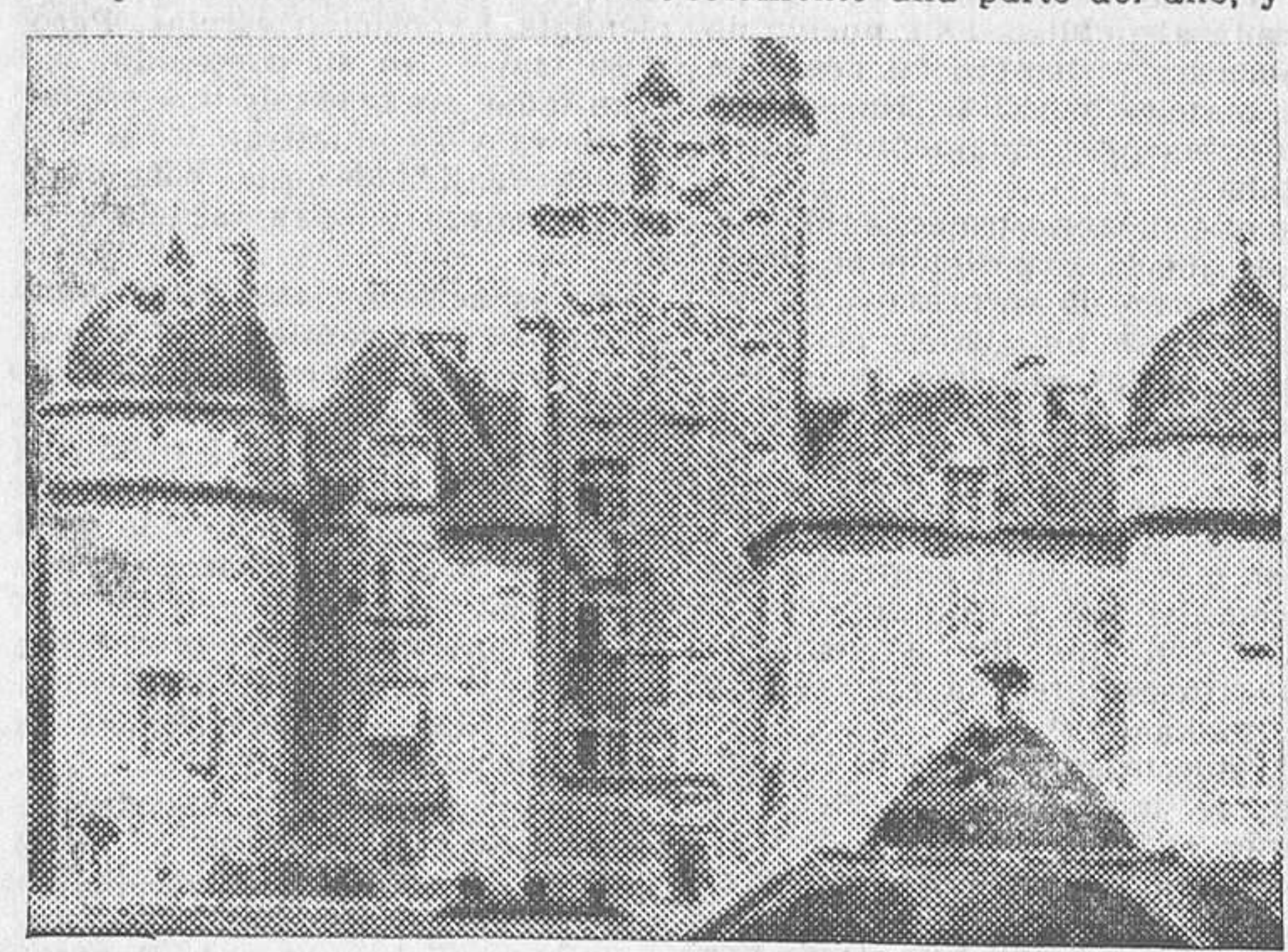
El castillo de Aynac