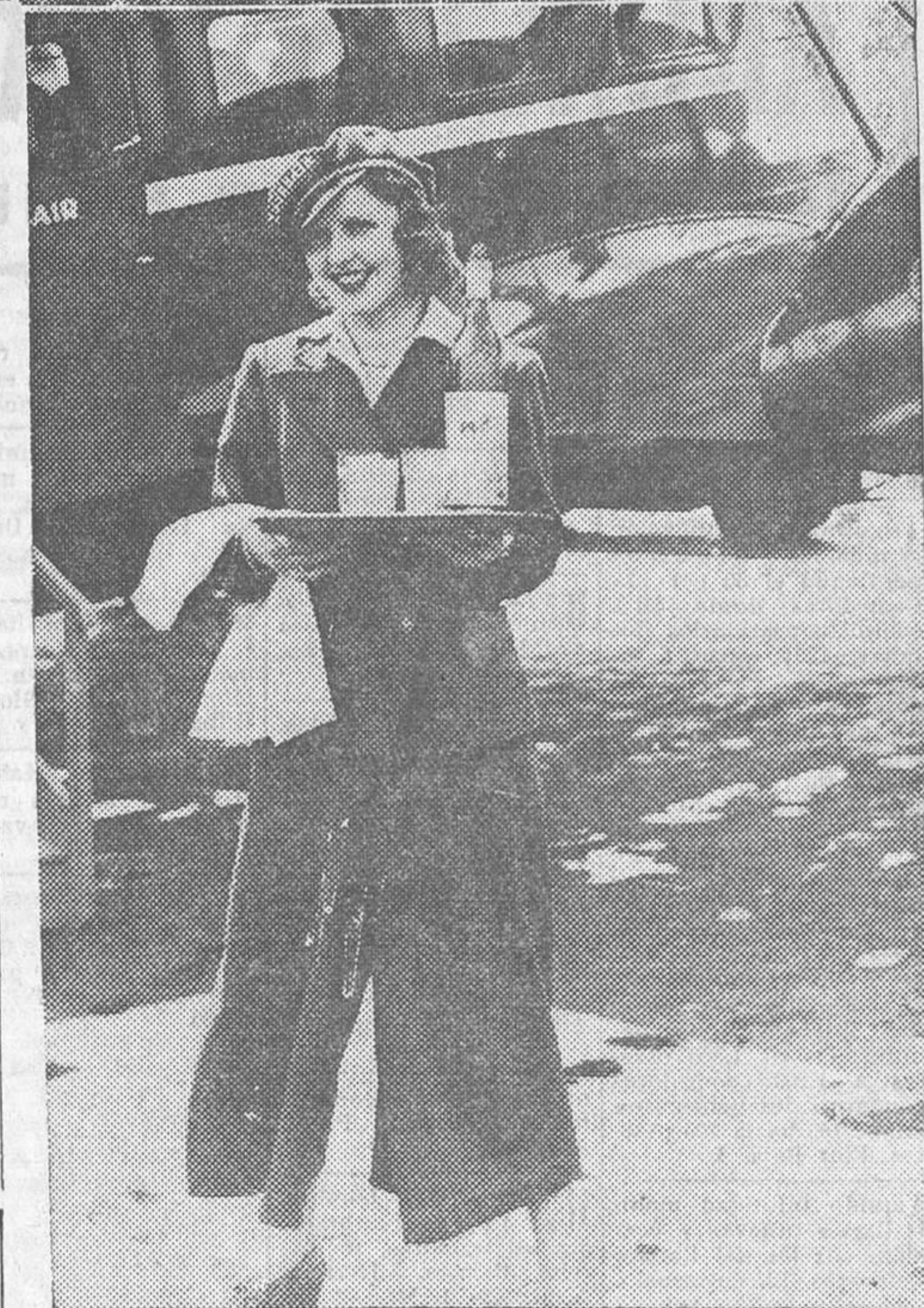
El primer camarero femenino del aire, llegado a Tempelhof en un avión suizo

La cuestión de las transferencias no depende de nuestra buena o mala voluntad, sino que es una cuestión de posibilidades prácticas. Es vergonzoso que después de tantas Conferencias internacionales y tantas ponencias de peritos sea necesario proclamar aun una verdad tan sencilla.»