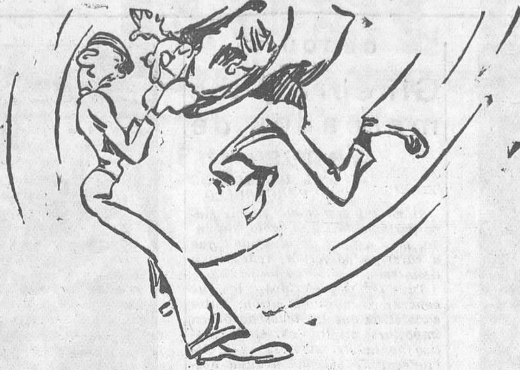
—«Mardita» sea tu sangre, ladrón!