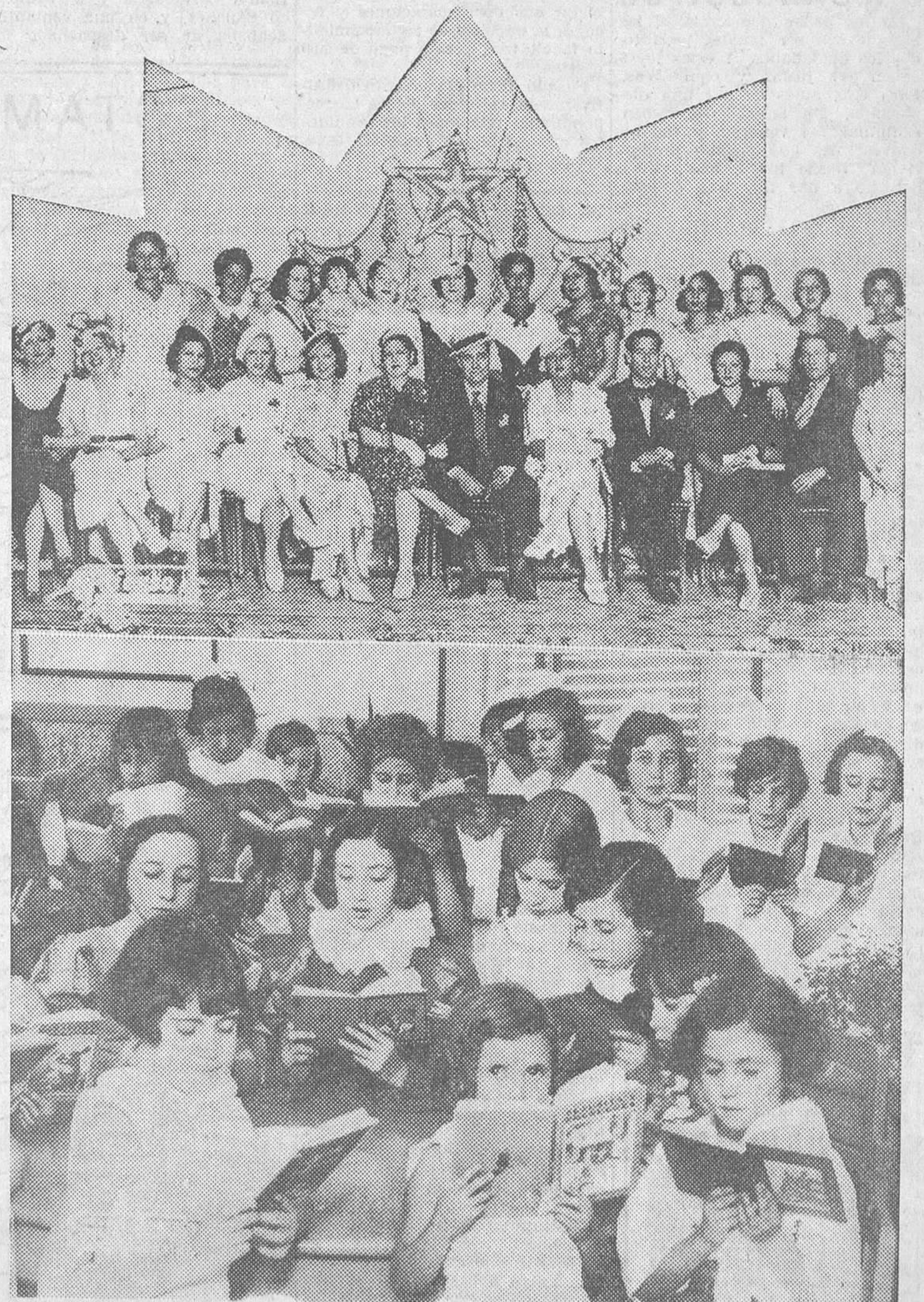
Arriba: Grupo de artistas del teatro Martín que tomarán parte en la verbena de la Asociación de la Prensa.—Abajo: Varias niñas que asistieron a la inauguración de la primera biblioteca infantil organizada por la Asociación de Bibliotecarios en el grupo escolar Ortega y Mynilla.

Y hubo un año que en Madrid no funcionaba un solo teatro. Y aquel año, en pleno mes de Agosto, se nos ocurrió a unos cuantos entusiastas, que no teníamos obra que defender ni artista que ponderar, hacer una temporada