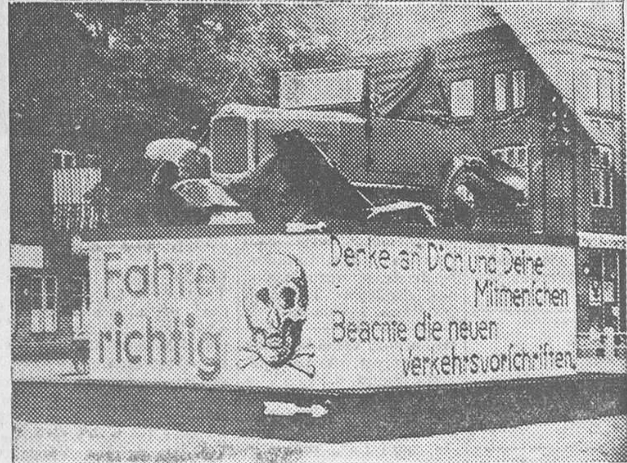
Un ejemplo—y un aviso—de cómo los automóviles destroza- dos son arreglados en un taller de Mecklenburg