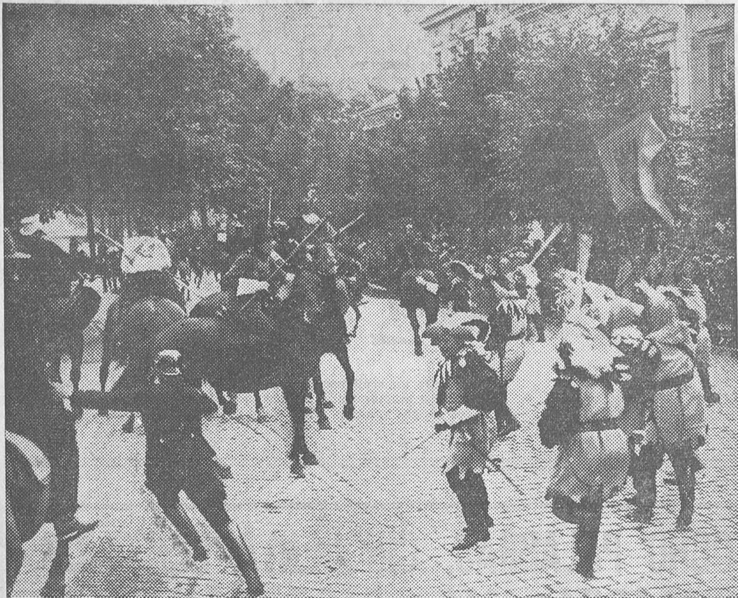
La tradicional «batalla» de los caballeros de Paukgrafen contra los de Preuzlan, clásicas organizaciones caballerescas de Alemania, cuyo origen data de 1381