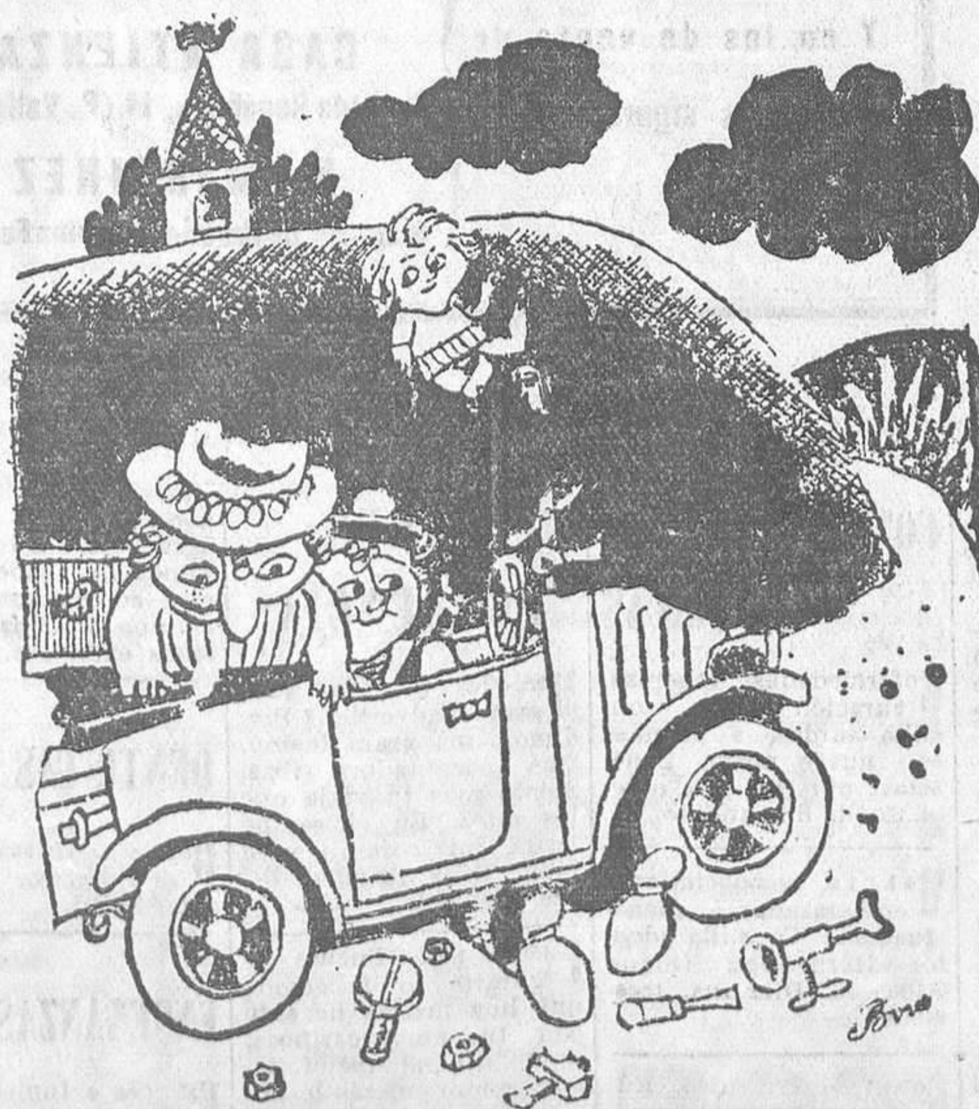
—Con tal de que no nos pasemos aquí los veinte días de mis vacaciones... (Rit et Rac.)