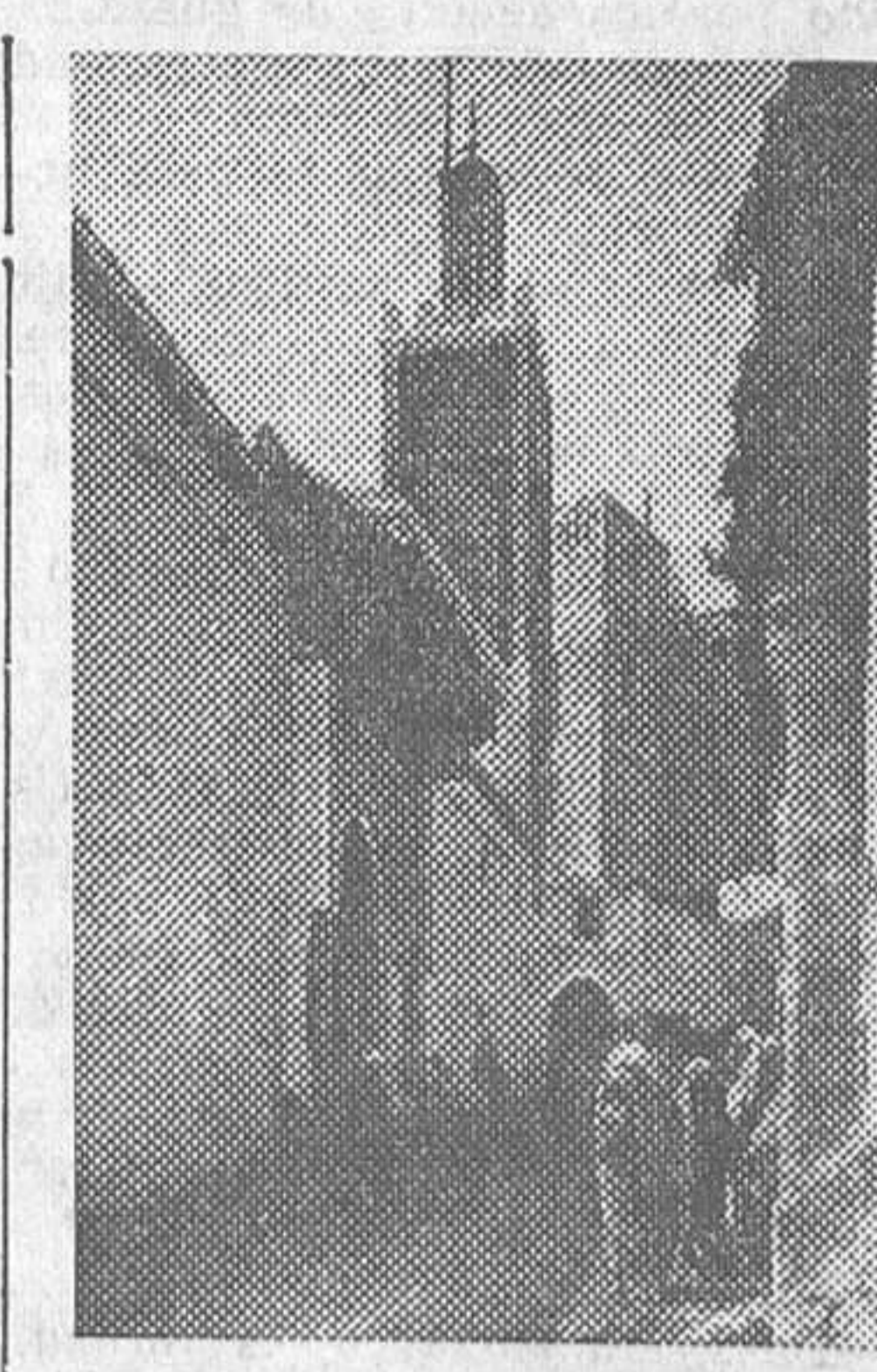
TANGER.—La Gran Mezquita

La Aduana. Es decir, la primera Aduana, porque en este camino hay dos: ésta, diez kilómetros antes de llegar, y otra a la entrada misma de Tánger. Oigo hablar francés por primera vez, con lo que me doy cuenta de la proximidad de la ciudad internacional. Y veo cómo la revisión de pasaportes y maletas se hace con una rapidez y una pulcritud des-