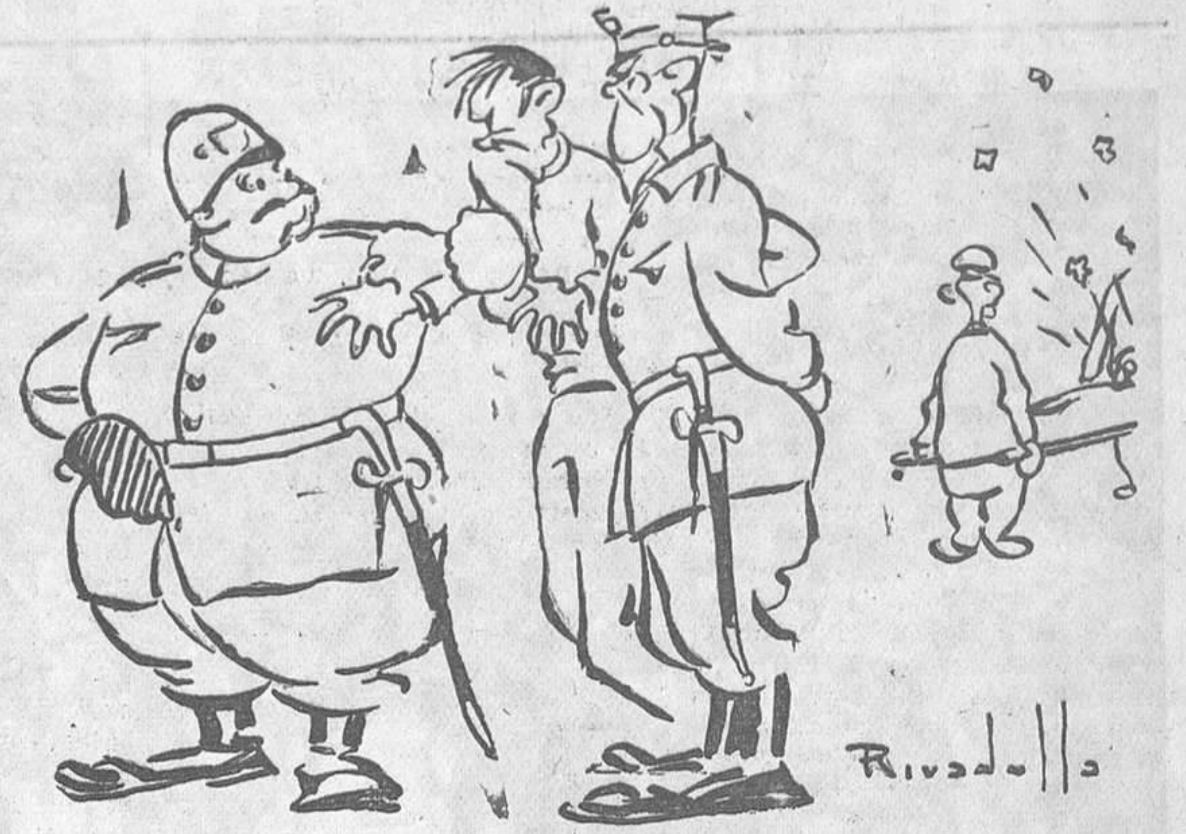
—De un «colapso»! ¡Morir de un «colapso» un hombre como «mi mataorn»! De un «colapso» de grande que le «jizo» «miga» «un» pleural!