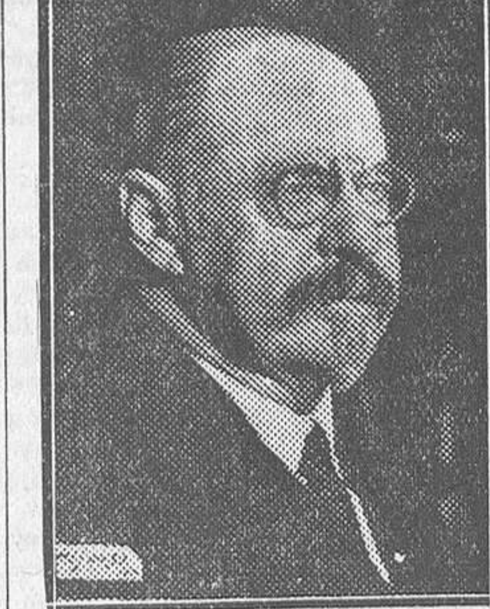
Emile G. Vandervelde, ex ministro de Estado de Bélgica, que viene a Madrid a dar varias conferencias.