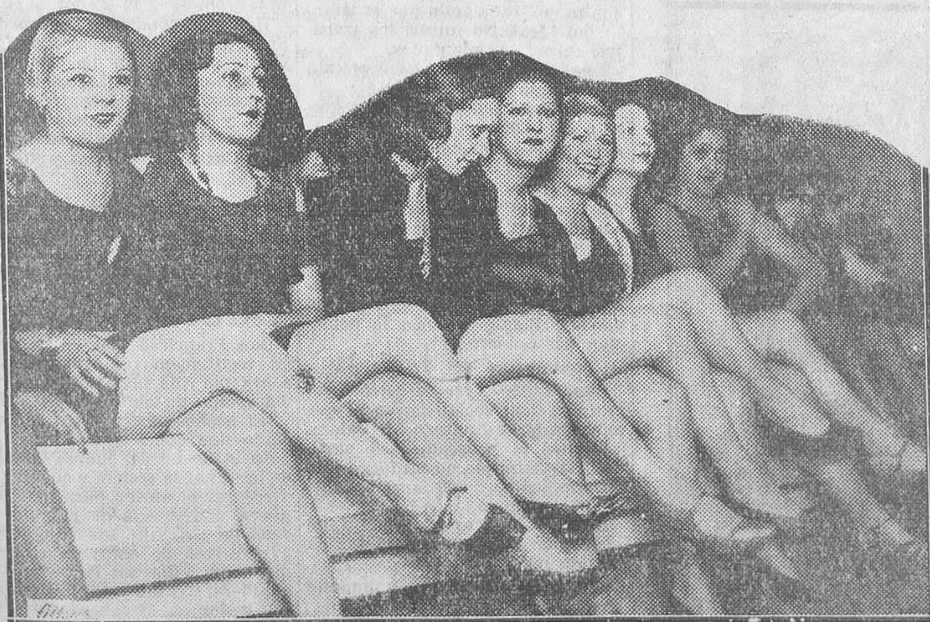
Grupo de señoritas que tomaron parte en el concurso de pantorrillas celebrado en el cine Barceló para la adjudicación de un premio de mil pesetas

La Comisión de Presupuestos celebró ayer una nueva reunión, en la que aprobó el Tribunal de Cuen-