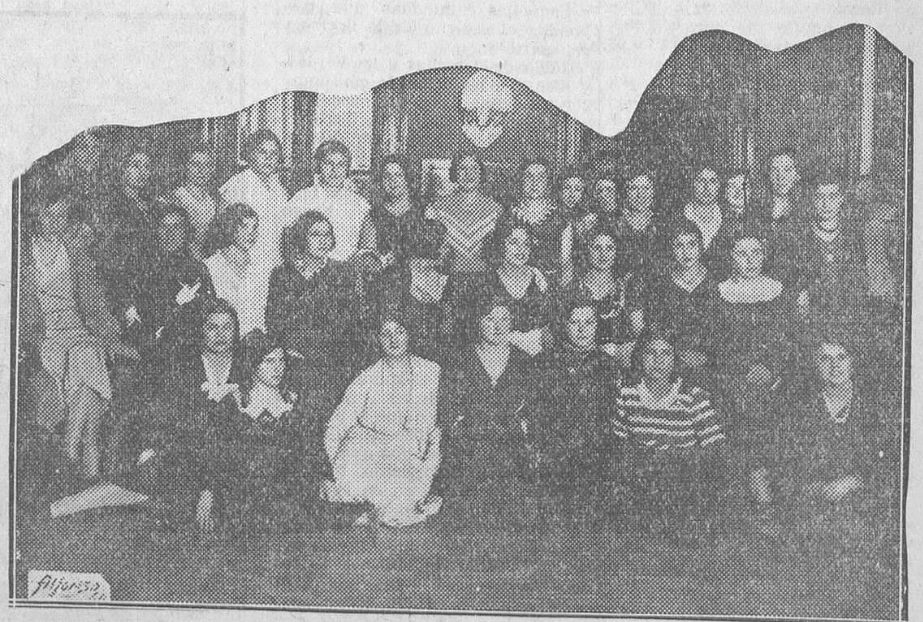
«Pobres chicas de servir» que se presentaron al concurso de belleza organizado por el semanario «Gutiérrez»