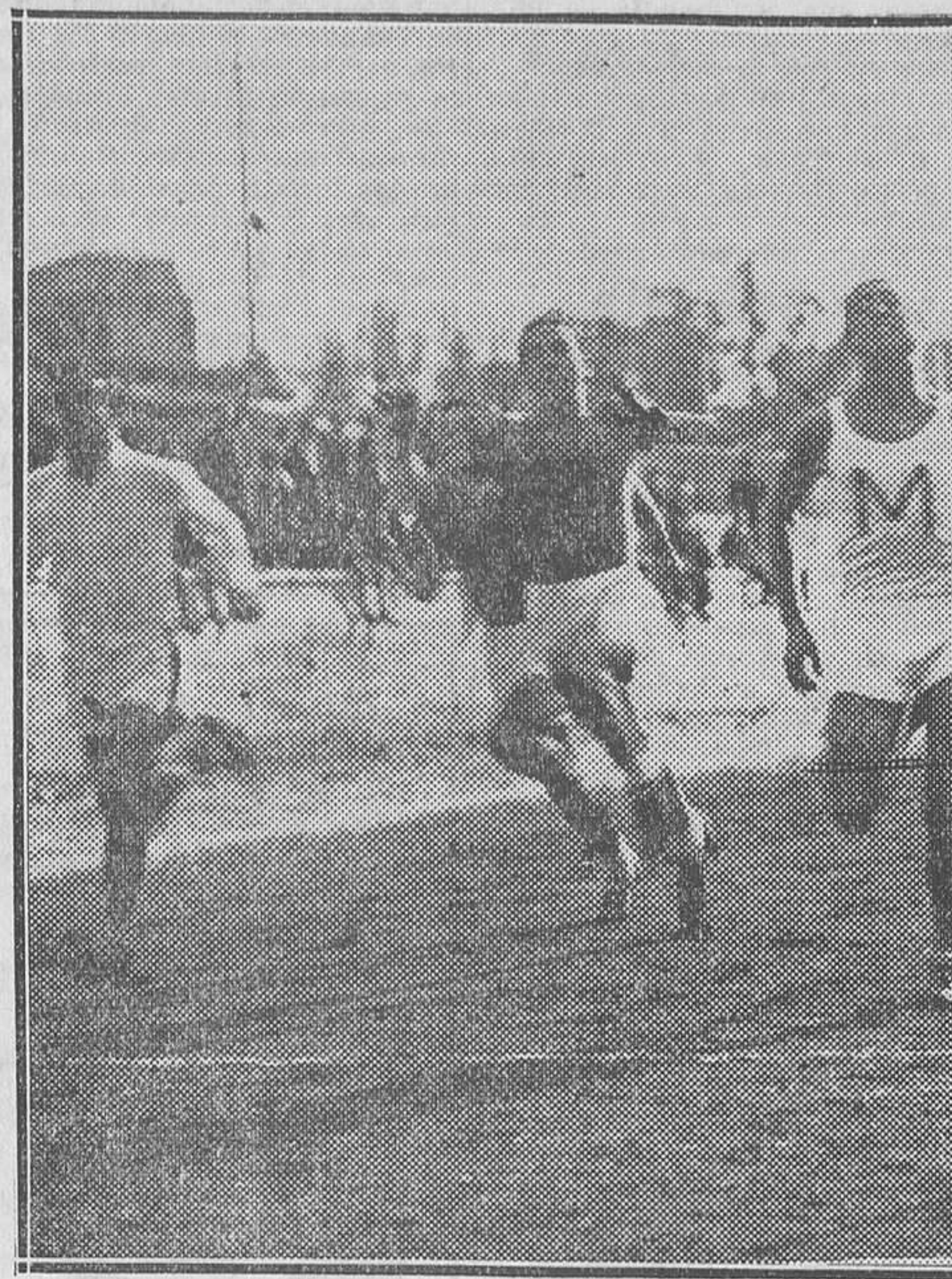
Los corredores que tomaron parte el domingo en el Pantheon Universitario, llegando a la meta

Gallart, Lángara, Galé, Inclariete. Arbitró Elorza.