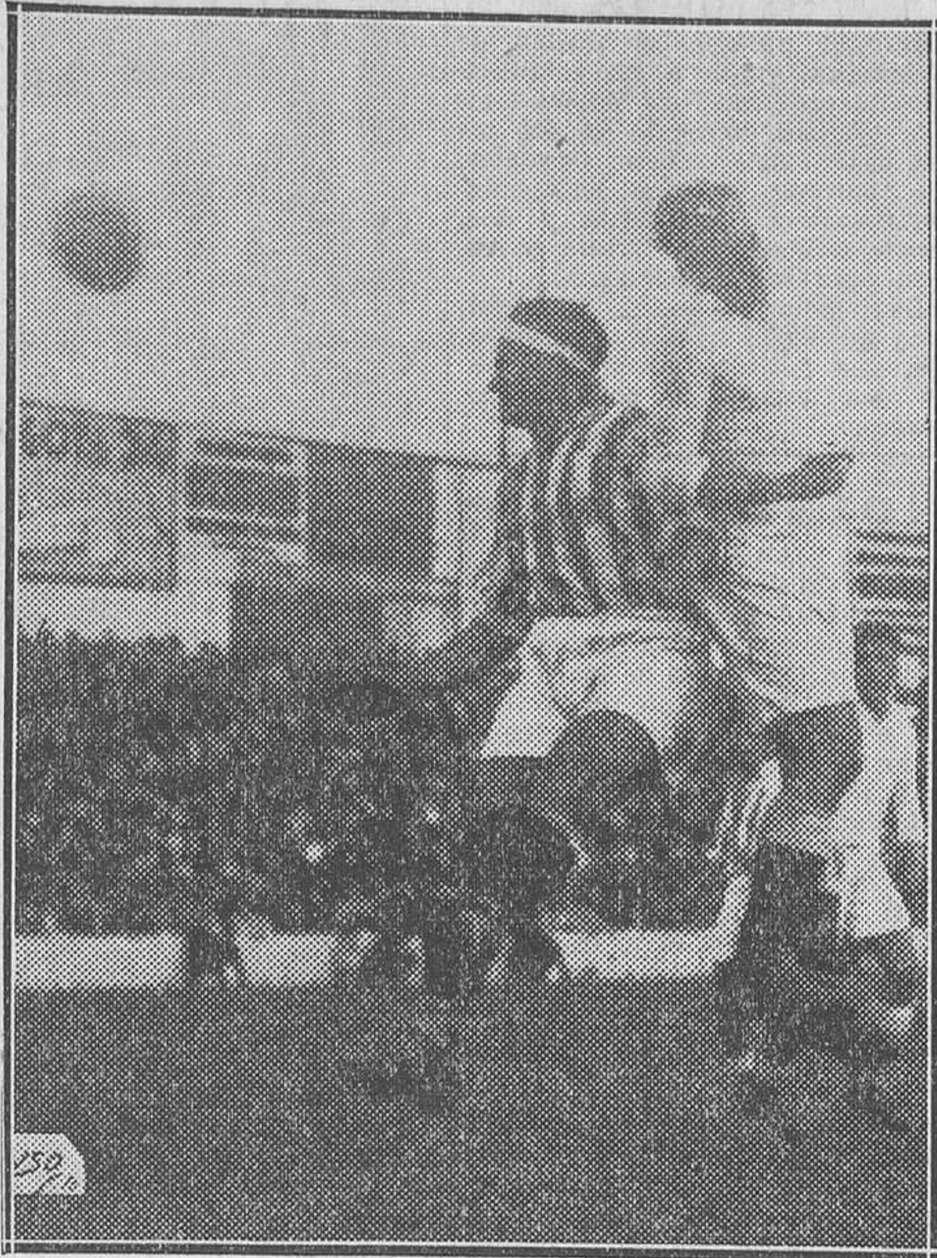
Un momento del partido de fútbol jugado el domingo entre el Madrid y el Betis

Los equipos formaron así: Madrid.—Zamora; Ciriaco, Quincoces; P. Regueiro, Valle, Gurruchaga; Eugenio, L. Regueiro, Olivares, Hilario, L. Olaso. Betis.—Jesús; Areso, Jesusin; Peral, Soladrero, Adolfo II; Timimi, Rocasolano II, Capillas, Lecue, Sanz.