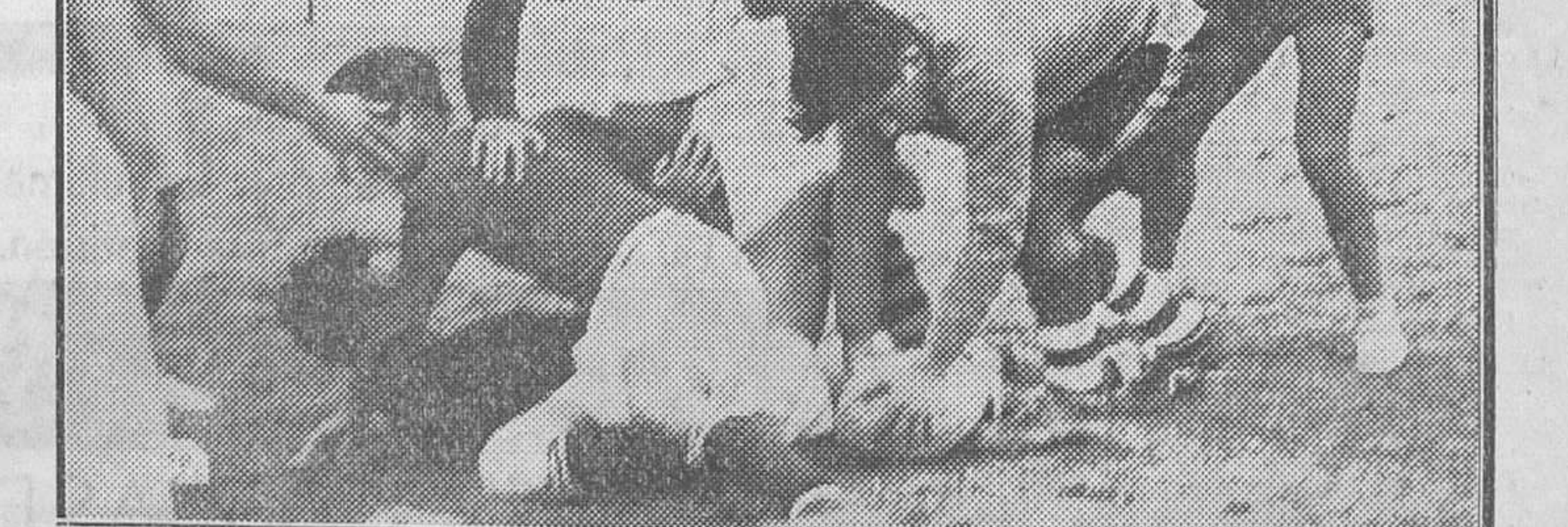
Una jugada entre los equipos de Medicina y Derecho en el partido de rugby jugado en la Ciudad Universitaria