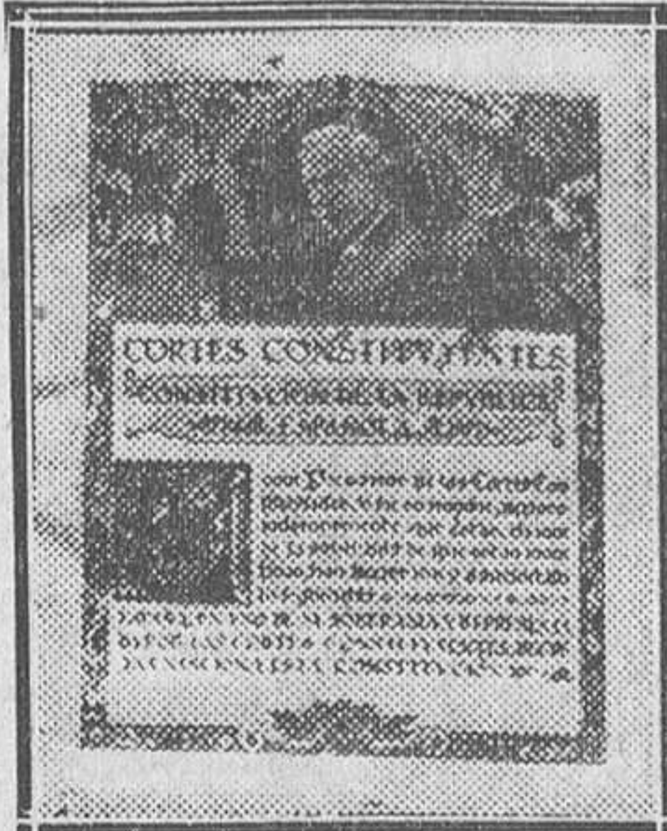
La primera página del magnífico album dedicado a las Diputaciones provinciales de España

El ministro de Instrucción pública llevó al Consejo la comunicación dirigida al de Hacienda para que con las compensaciones en el propio presupuesto, condición que, según el informe de los funcionarios, era lo que precisaba, quedasen implantadas las plantillas de 1931 aprobadas por las Cortes.