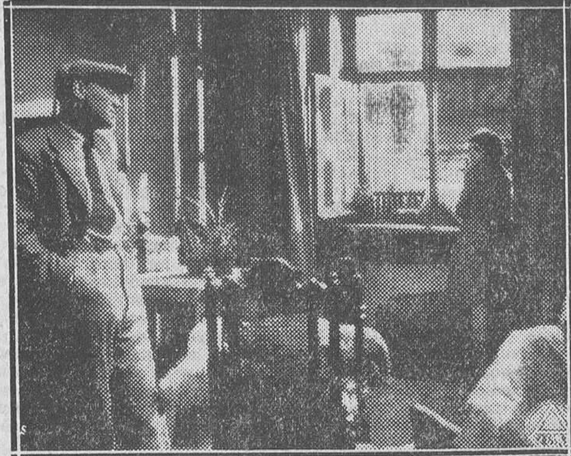
UNA ESCENA DE «HAMPA». PRODUCCION DE SELECCIONES FILMOFONO QUE EL LUNES SE ESTRENA EN EL PALACIO DE LA PRENSA

Lo ocurrido es que la Empresa S. A. G. E., al ver interrumpida