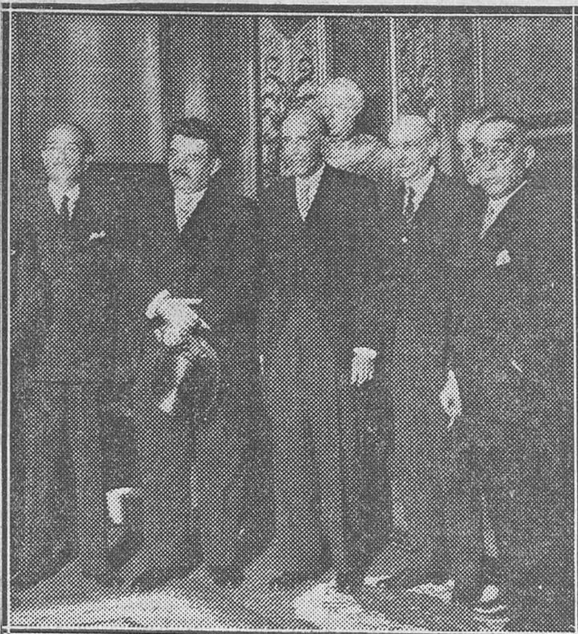
El jefe del Gobierno francés, Sr. Herriot, con el presidente de las Cortes Constituyentes, en la visita que aquél hizo al Sr. Bestier en el Congreso

perfecta. Son las segundas las que nos atan a los intereses materiales, a las codicias ciegas, a los afanes bastardos. Si surge, en un conflicto agudo, la pugna entre unas y otras, al fin triunfan siempre—con sacrificios enormes, porque el bien se gana con tributos de dolores y abnegaciones—las fuerzas del espíritu, las ideas que divinizó Platón.