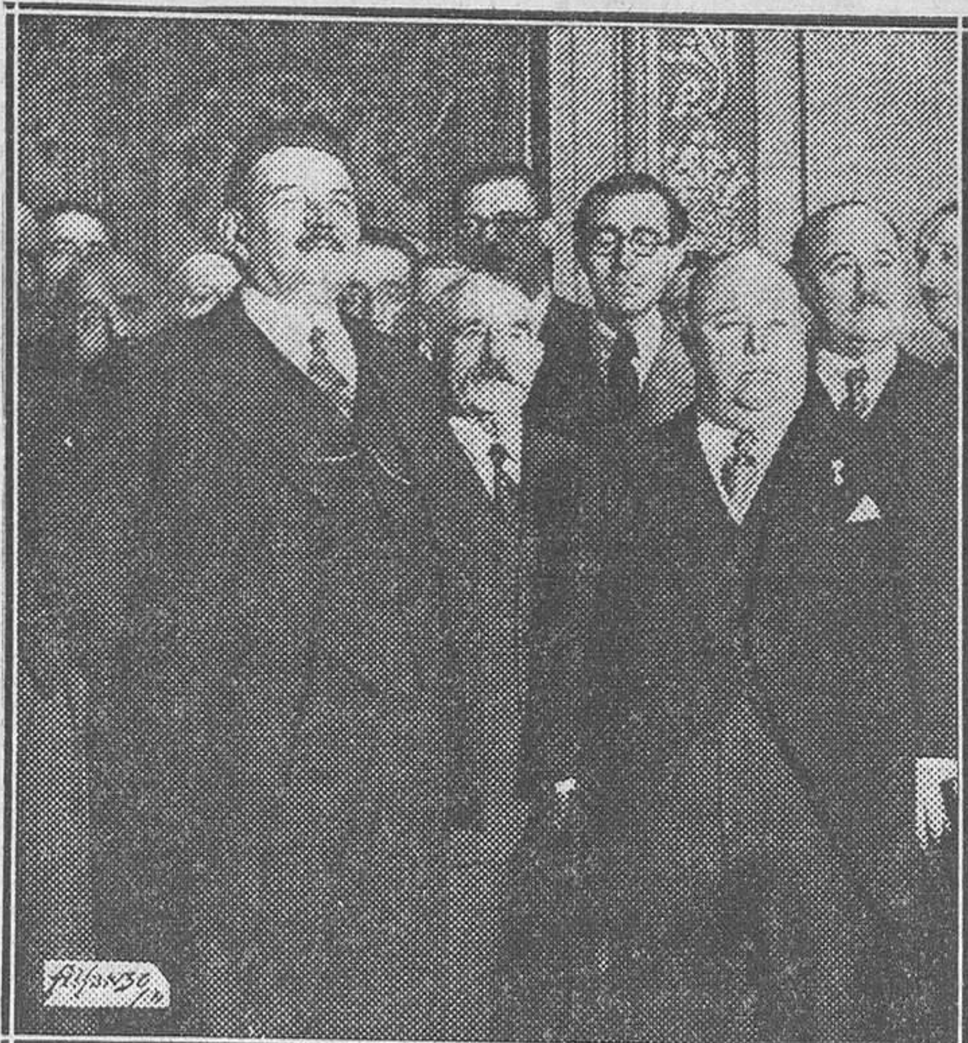
El jefe del Gobierno francés, Sr. Herriot, con el alcalde de Madrid, D. Pedro Rico, en la visita que aquél hizo a nuestro Ayuntamiento

tado de cosas hay que reaccionar, instituyendo un control internacional, mutuo y permanente, que incluso llegue al derecho de investigación. No hay hoy en el Mundo gobernante capaz de formular una propuesta más generosa ni más franca.