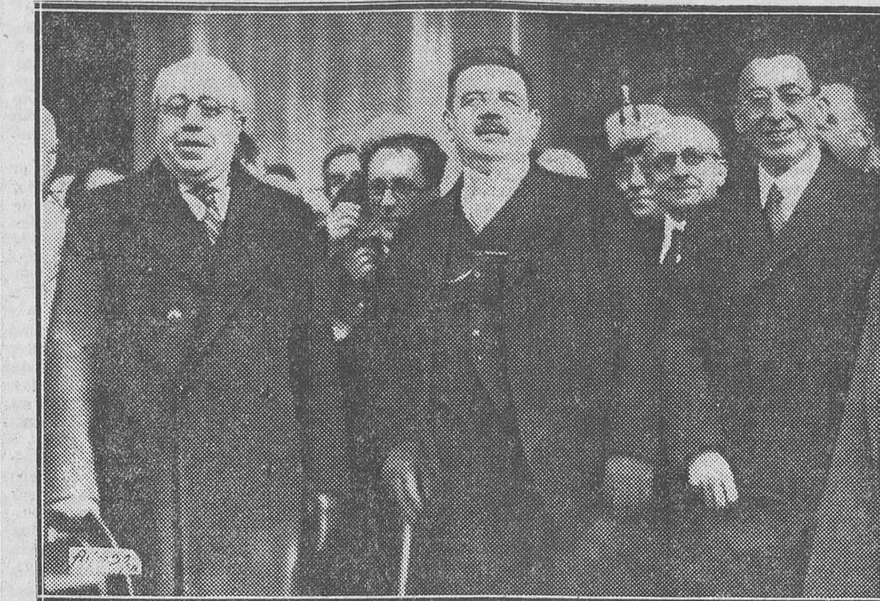
El jefe del Gobierno francés, Sr. Herriot, con el jefe del Gobierno español, Sr. Azaña, y el ministro de Estado, Sr. Zulueta, a su llegada a Madrid

Son aquellas las que iluminan al hombre y al Mundo en su marcha ascensional a una vida más