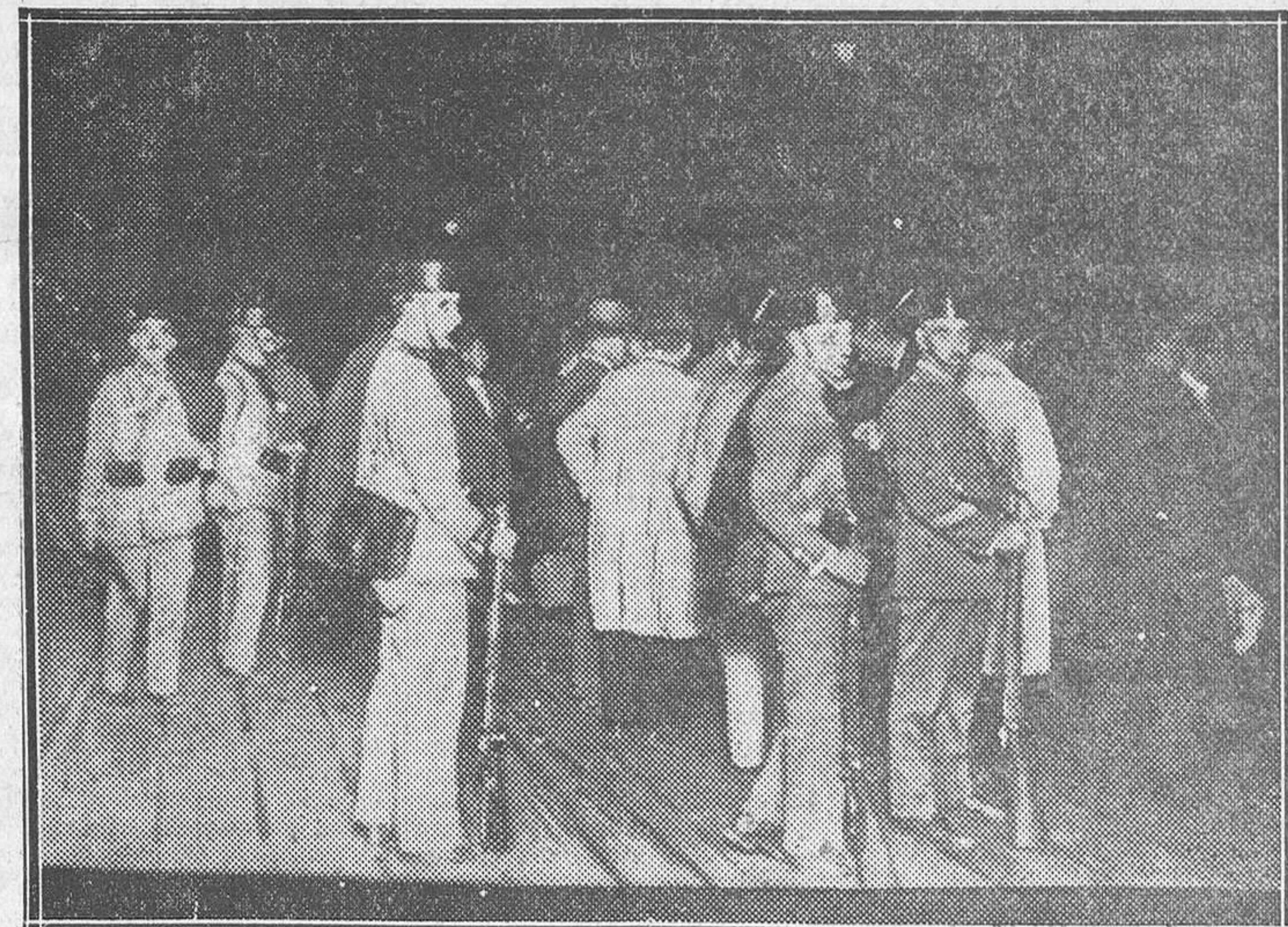
LOS DEPORTADOS A VILLA CISNEROS.—Los deportados en el embarcadero de Matagorda, de Cádiz, custodiados por la Guardia civil

En la última indagación realizada por los reporteros encontraron