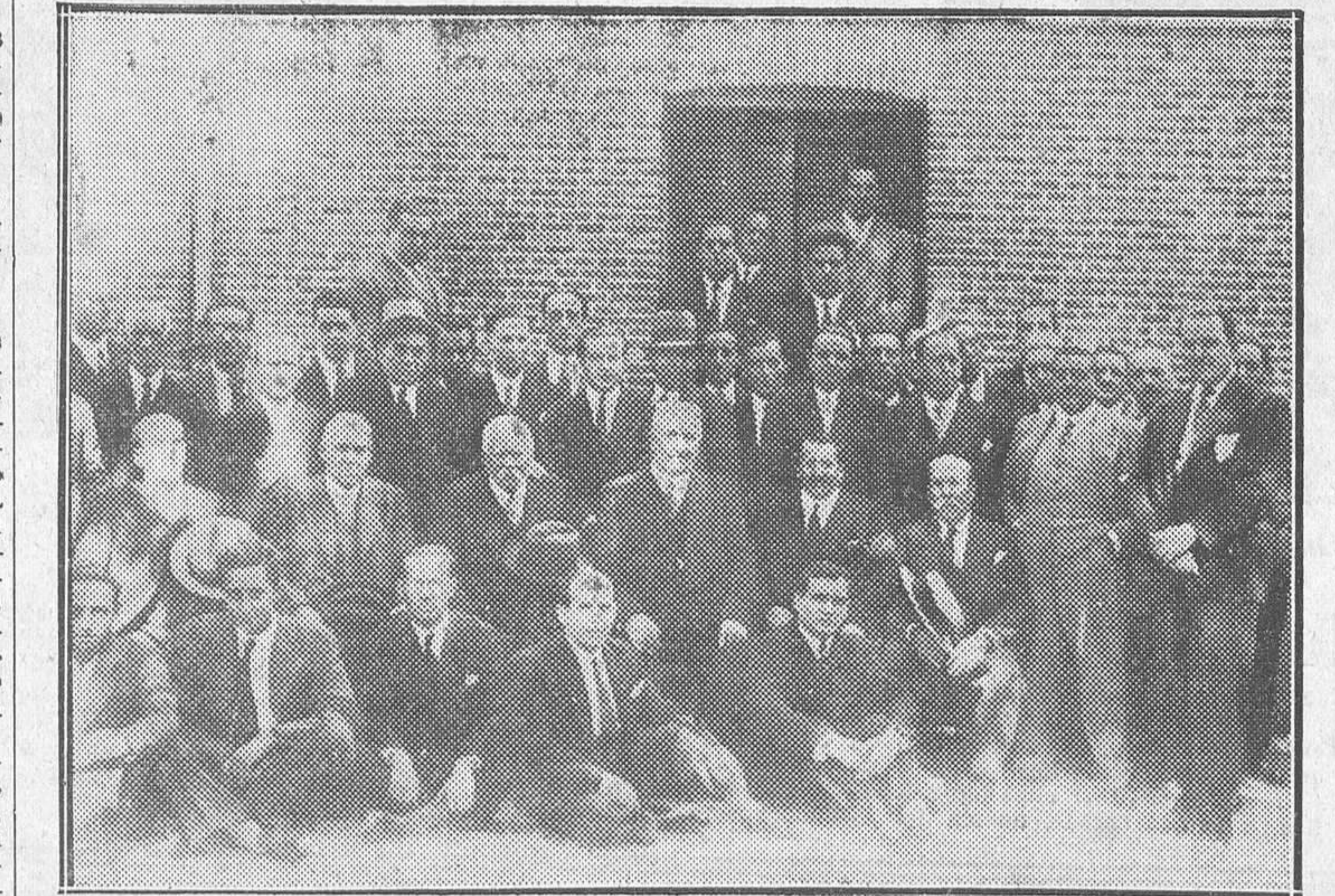
Miembros del Montepío de Dependientes de los Gremios de Hierros, Ferretería y Similares, que han celebrado un fraternal almuerzo para conmemorar, como otros años, la fecha de la fundación de la benéfica institución