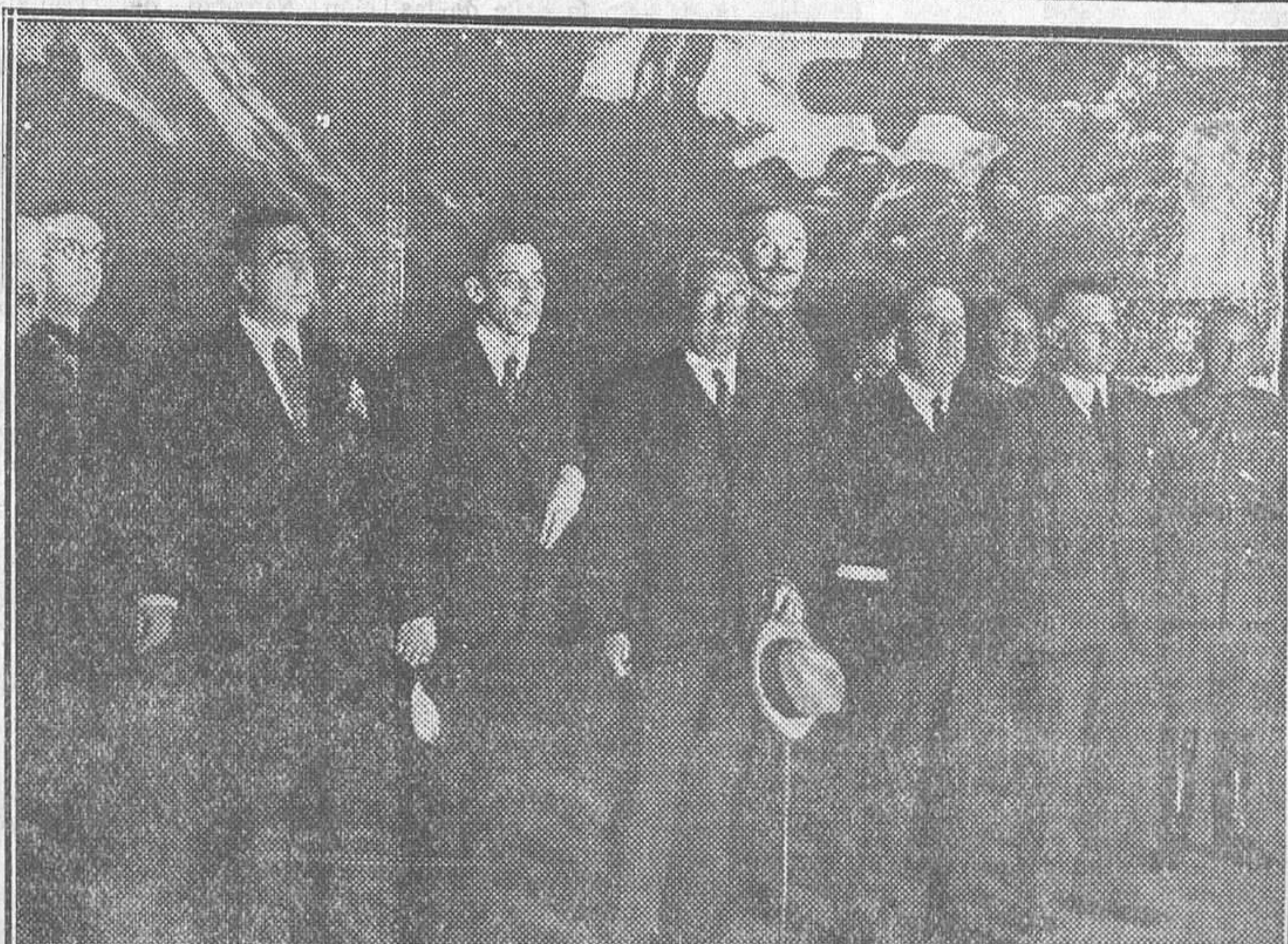
EL VIAJE PRESIDENCIAL.—S. E. el presidente de la República con los ministros de Estado y Obras públicas y su séquito, visitando el Museo de San Sebastián