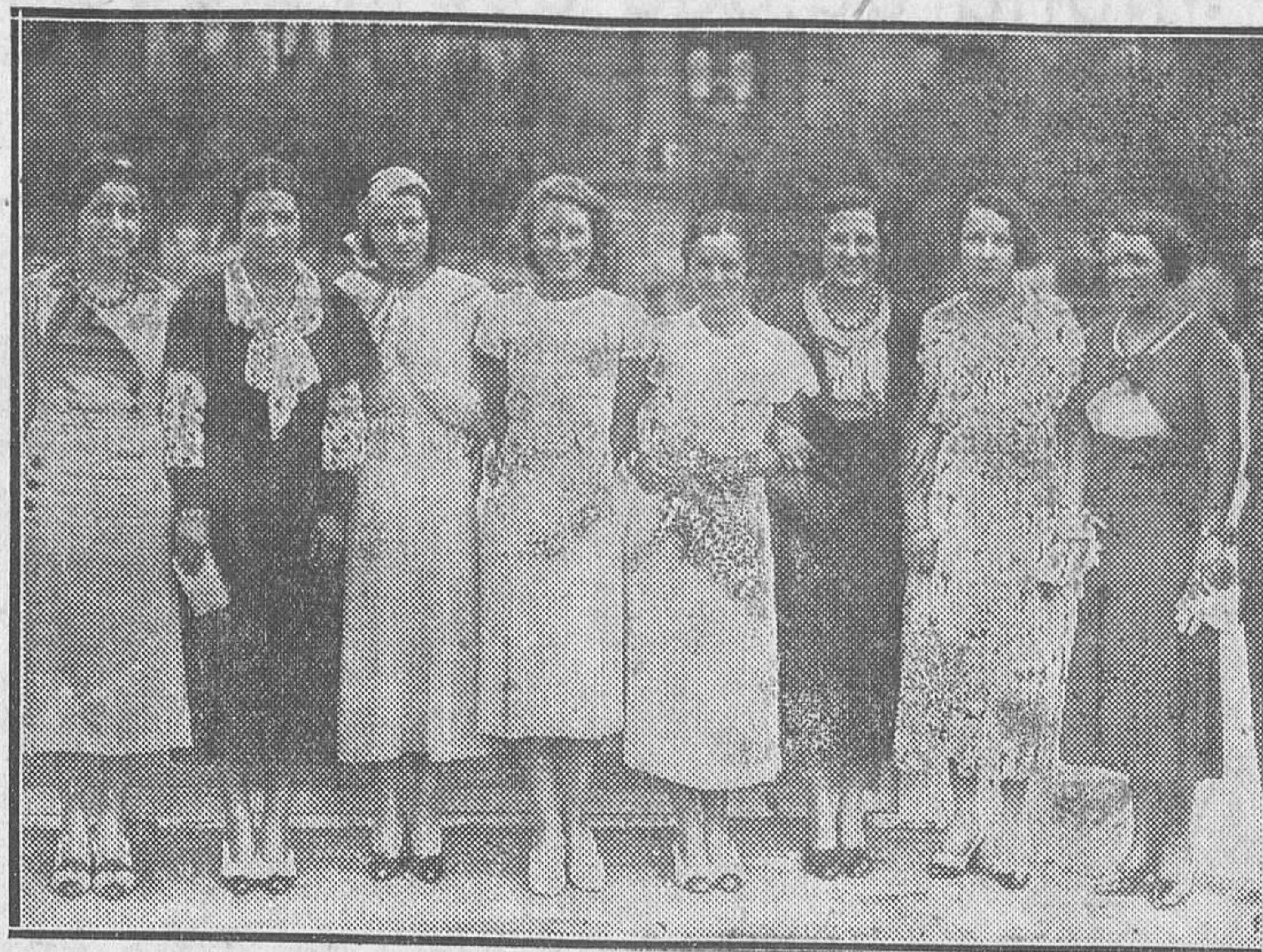
SAN SEBASTIAN.—Bellas señoras veraneantes que postularon para recaudar fondos con destino a la institución La Vejez del Marino

Desde Zarzúz se trasladó el presidente a Guetaria, donde se le hizo un recibimiento entusiasta. Todo el pueblo esperaba en la ca-