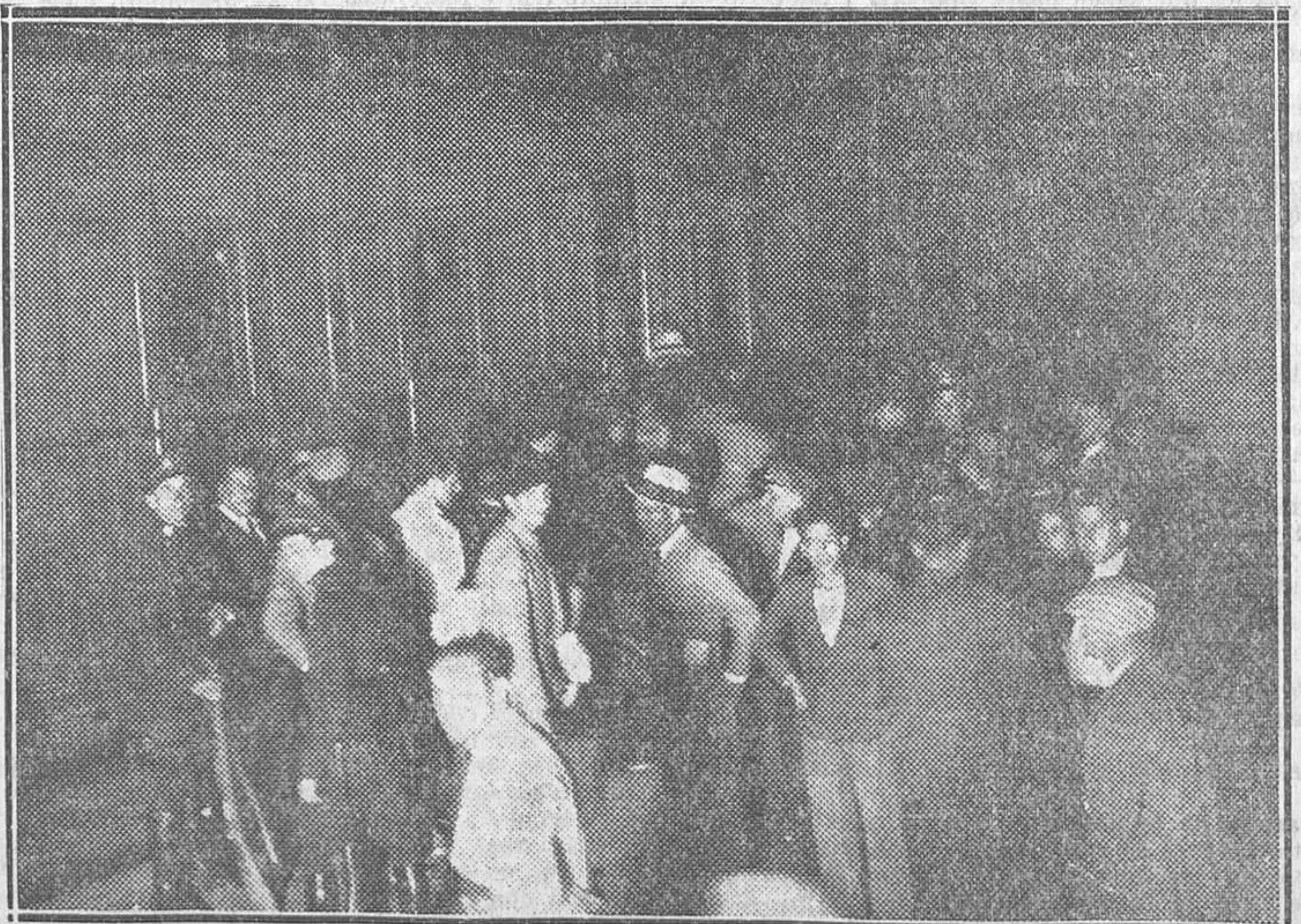
LA SEGUNDA EXPEDICION DE DEPORTADOS.—Momento de subir anoche al tren correo de Andalucía, en la estación de Getafe, unos veinte deportados, que constituyen la segunda expedición de los que han de sufrir confinamiento en Villa Cisneros. Los deportados fueron conducidos en automóvil a la estación de Getafe desde la Cárcel de Madrid, realizando la Policía este servicio en el mayor secreto y procurando despistar a los periodistas.

Simla, 12.—En los círculos de la Asamblea legislativa se declara que el líder nacionalista Gandhi será puesto en libertad probablemente el día 26 del corriente, antes que comience la anunciada huelga del hambre.