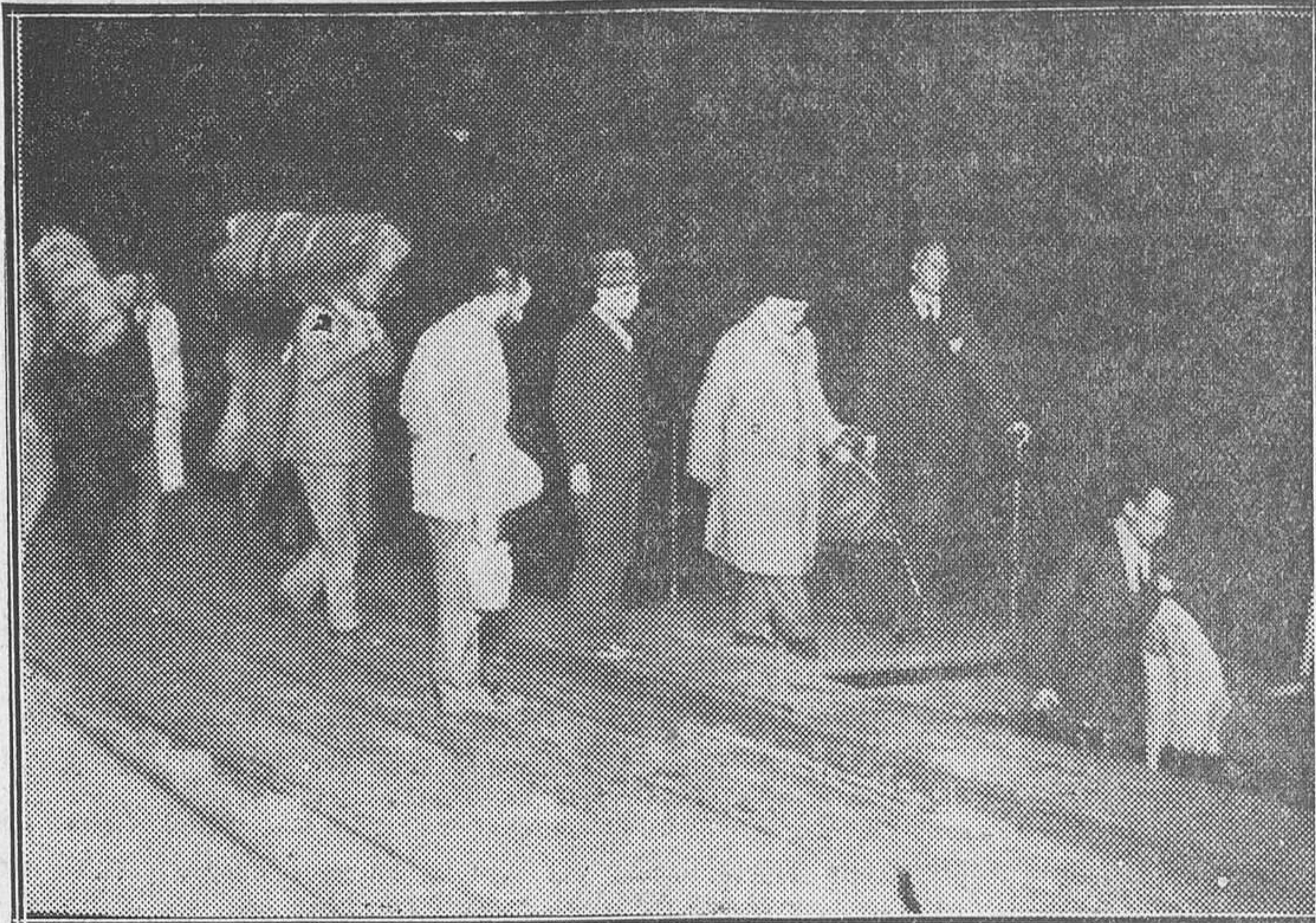
LOS DEPORTADOS A VILLA CISNEROS.—Los deportados bajan la escala del embarcadero, en Cádiz, para entrar en el remolcador que ha de conducirlos al «España núm. 5»

Entonces se trasladaron los periodistas a la estación de Atocha y preguntaron a los jefes, a los factores, a los guardias de la es-