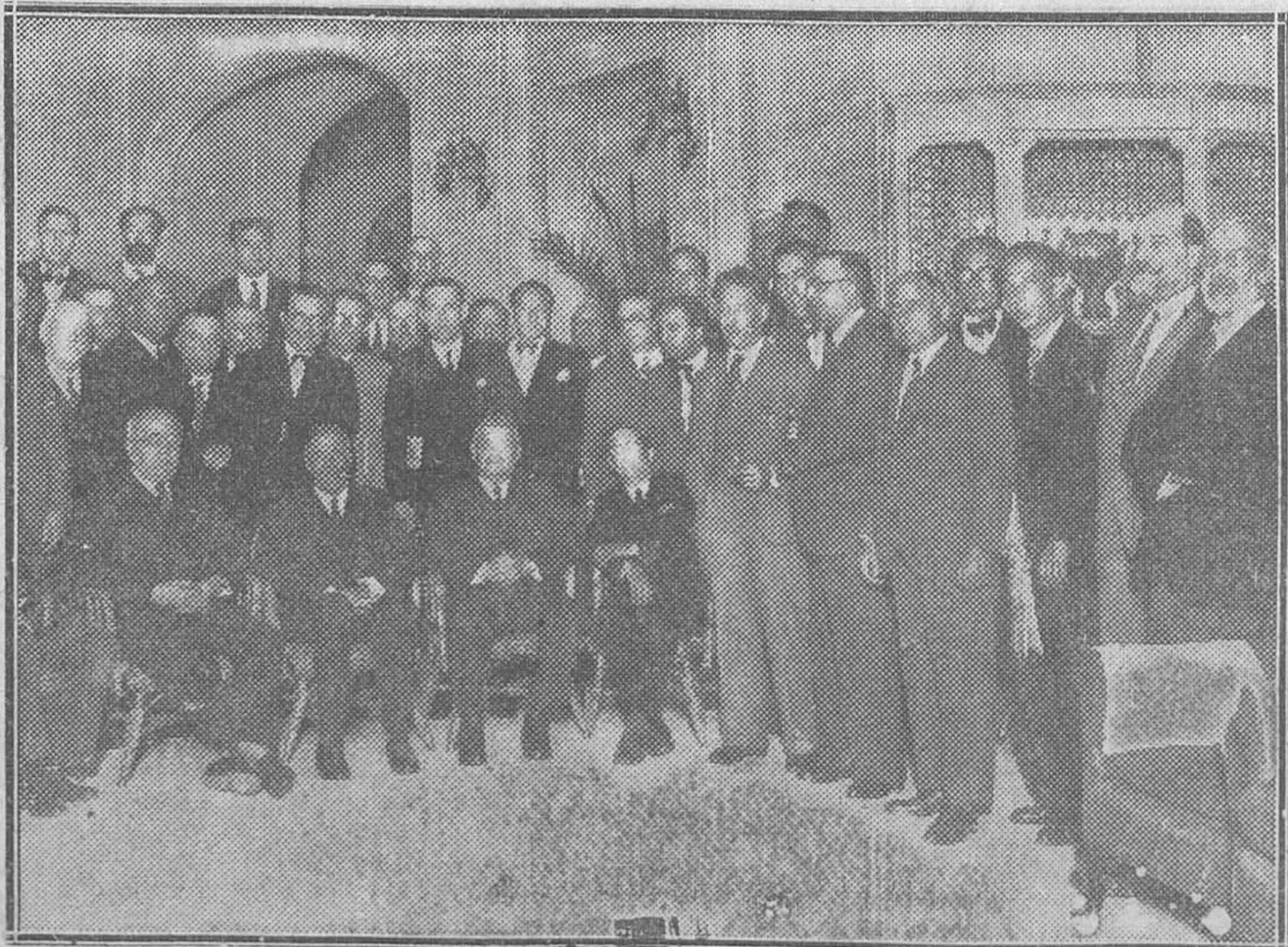
El presidente de las Cortes Constituyentes rodeado de los diputados catalanes, que ayer le obsequiaron con un banquete, al que asistieron el jefe del Gobierno y los ministros de Agricultura y Finanzas.

Emparejados en la misma suerte los proyectos de Estatuto y de Reforma agraria, los comentarios acerca de la aprobación de las dos nuevas leyes se entrelazaban y