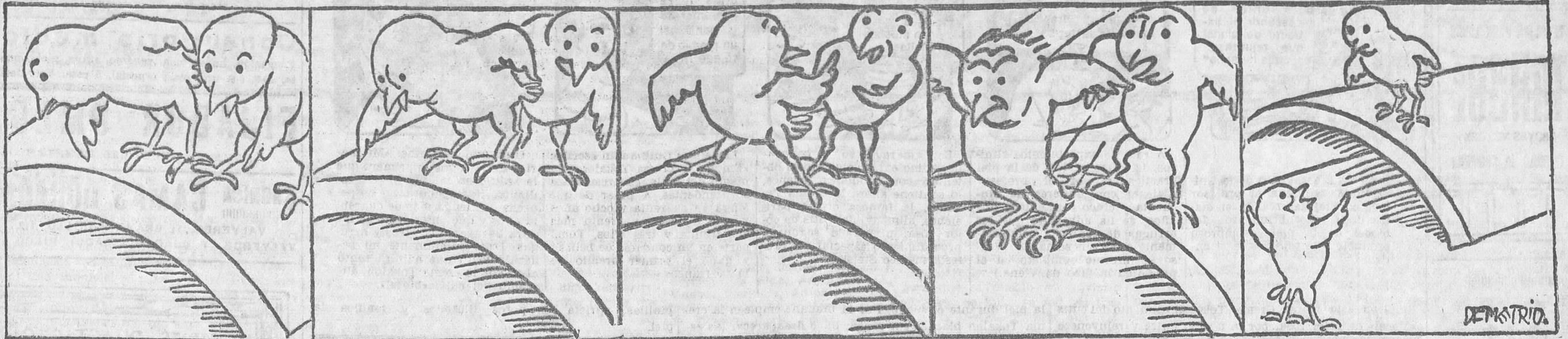
—¿A que no te tiras al suelo? —¿Desde la teja hasta el suelo? —¿Cuánto me das? —A la una, a las dos y a las... ¡tres! —¿Ya está! Y de haber estado más alto lo mismo me «habería» tirado.