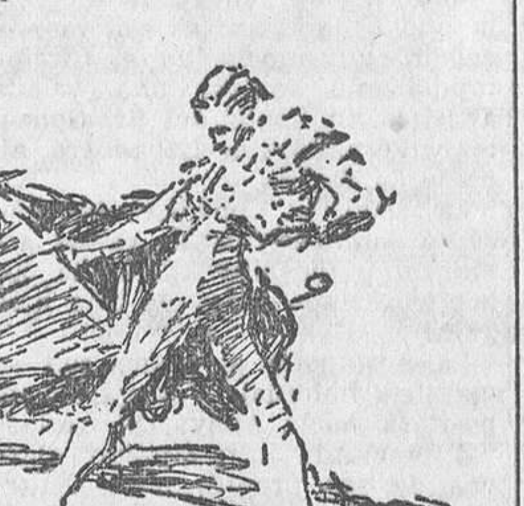
AYER, EN MADRID.—Niño del Matadero en un pase al quinto toro

AYER, EN MADRID.—Cogida de Niño de la Alhambra en el sexto toro (Apuntes del natural por Roberto Domingo)