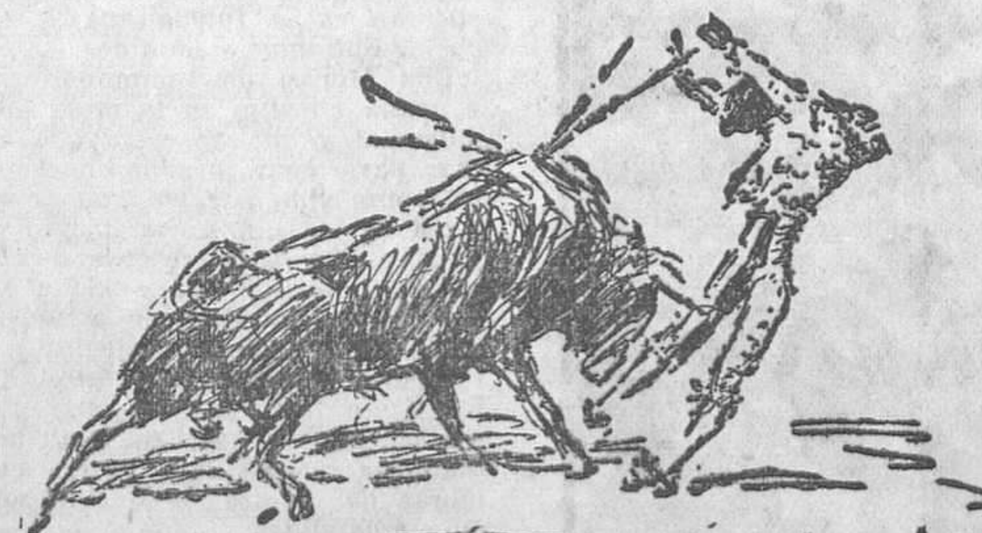
AYER, EN MADRID.—Orteguita en un par al segundo toro

La culpa principal del torero fué la duda. Con la duda no ligó la faena. Dió unos pases buenos con la derecha, algunos de esta misma clase con la izquierda; pero no ligó. Fué una verdadera lástima, como lo fué también que después no se decidiera a matar.