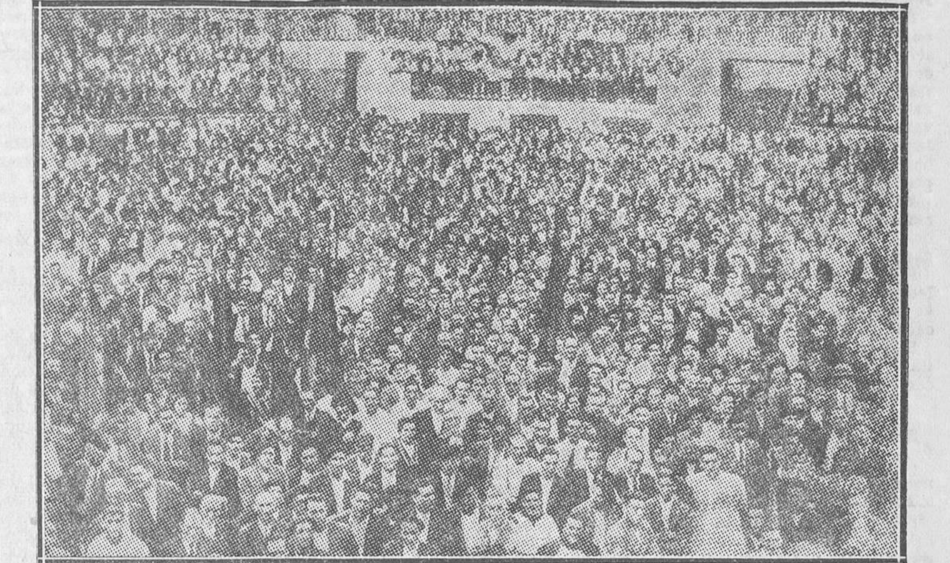
Un aspecto del grandioso acto celebrado en Azpeitia en la plaza de toros, al que se calcula que asistieron más de diez mil almas

Pero la semilla... Pero estaba echada la semilla, y la semilla había de fructificar. En el ministerio de Justicia ya hay alguna prueba de lo que digo. Allí hay más de una excitación, con