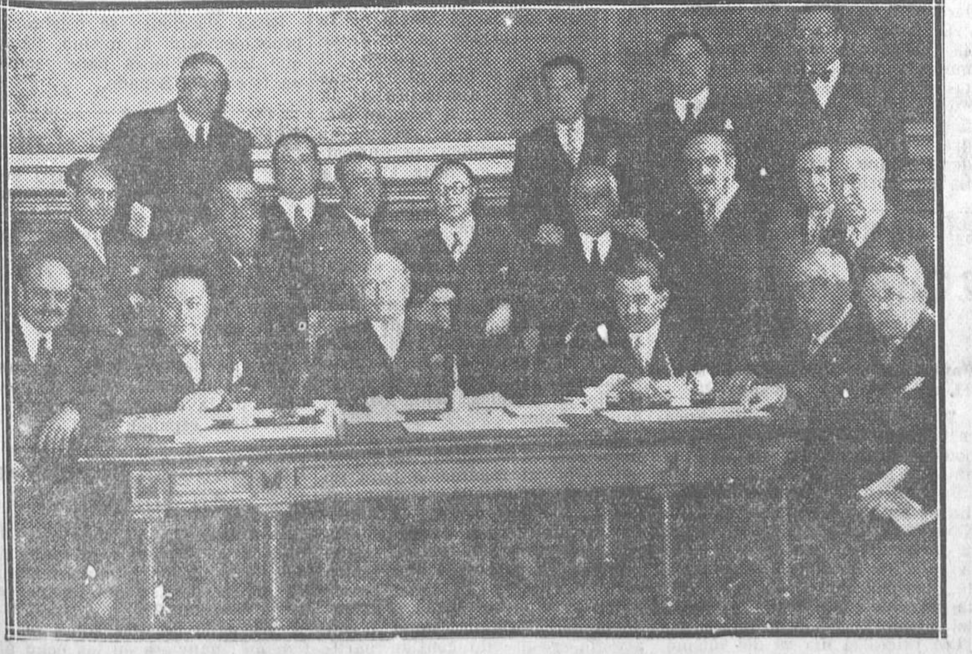
La minoría radical del Congreso presidida por D. Alejandro Lerroux, reunida ayer para tratar de la leyes tributarias y los presupuestos

Segovia, 25.—Por celebrar un entierro religioso sin autorización, el gobernador ha impuesto una multa de 250 pesetas al párroco de San Miguel de esta ciudad.