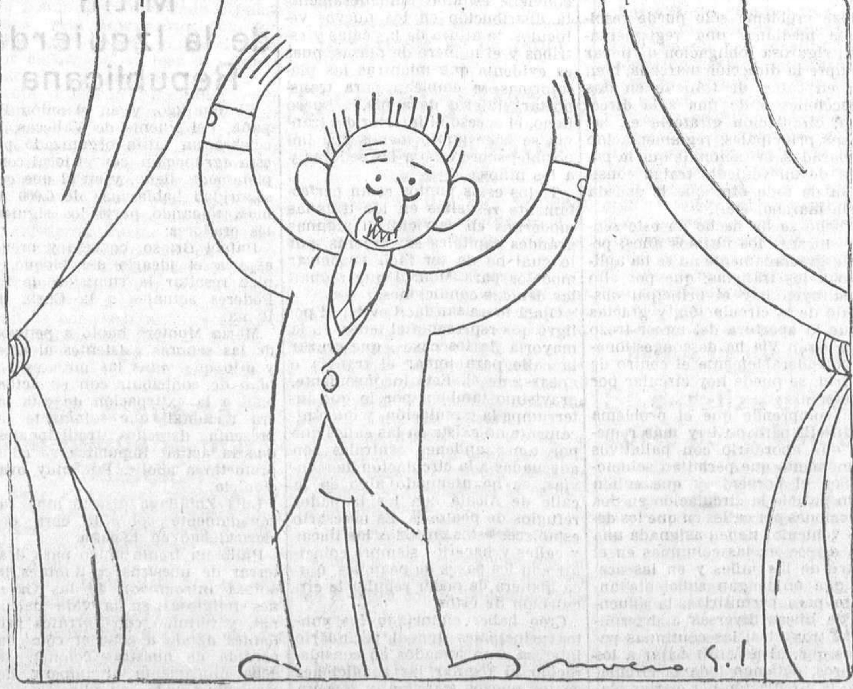
«El amigo Melquiades» (Reposición)