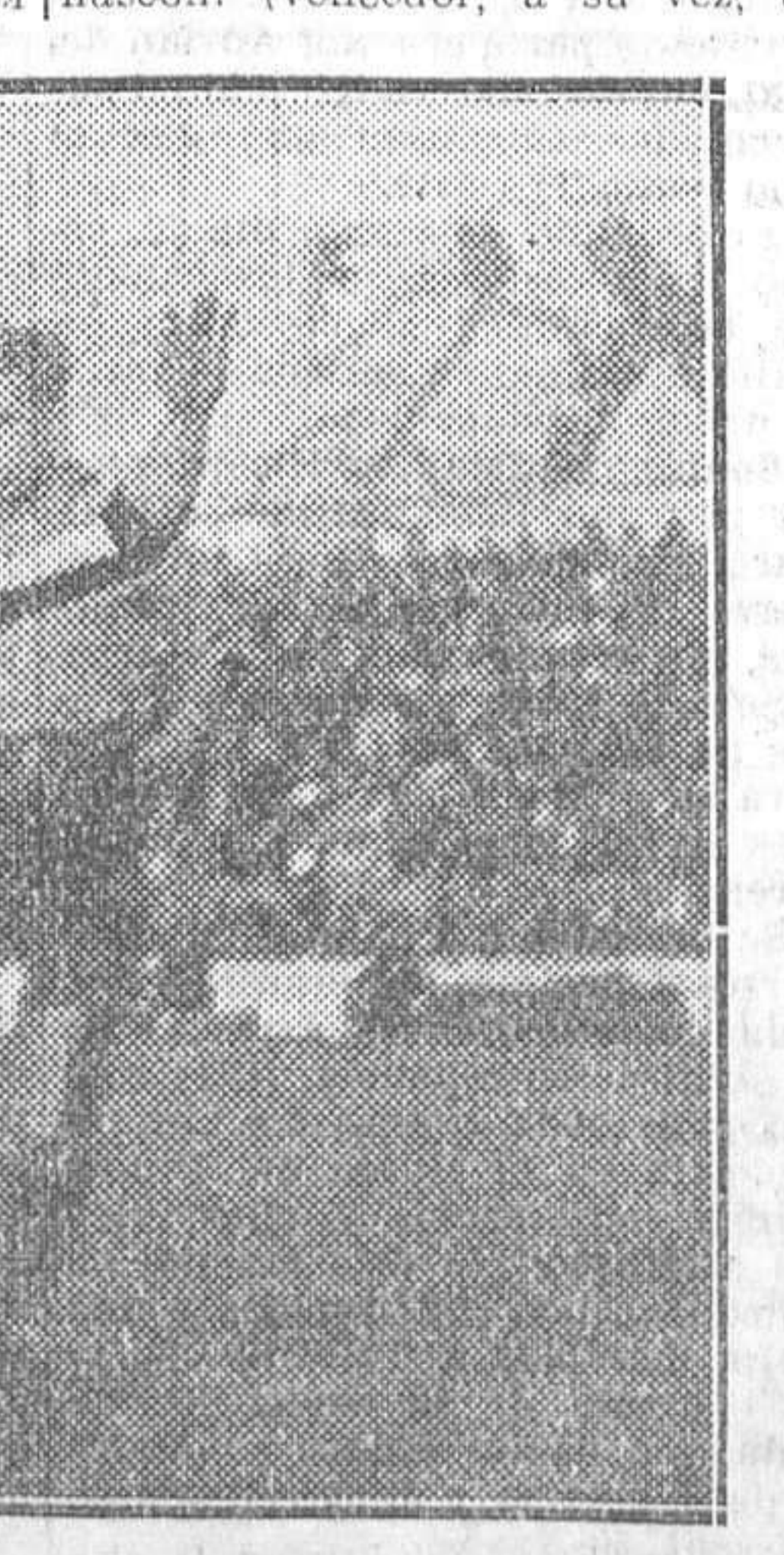
Partido de fútbol entre el Atlético de Madrid y el Sporting de Gijón, celebrado el domingo

PUGILATO Las reuniones de Price Van a reanudarse las reuniones pugilísticas. Martínez de Alfara, campeón de España de los semipesados y aspirante oficial al título de campeón de Europa, boxeará contra Lebriz, vencedor de Krachi, de Jusseff, de Kid Nitram, de Bernasconi (vencedor, a su vez, de