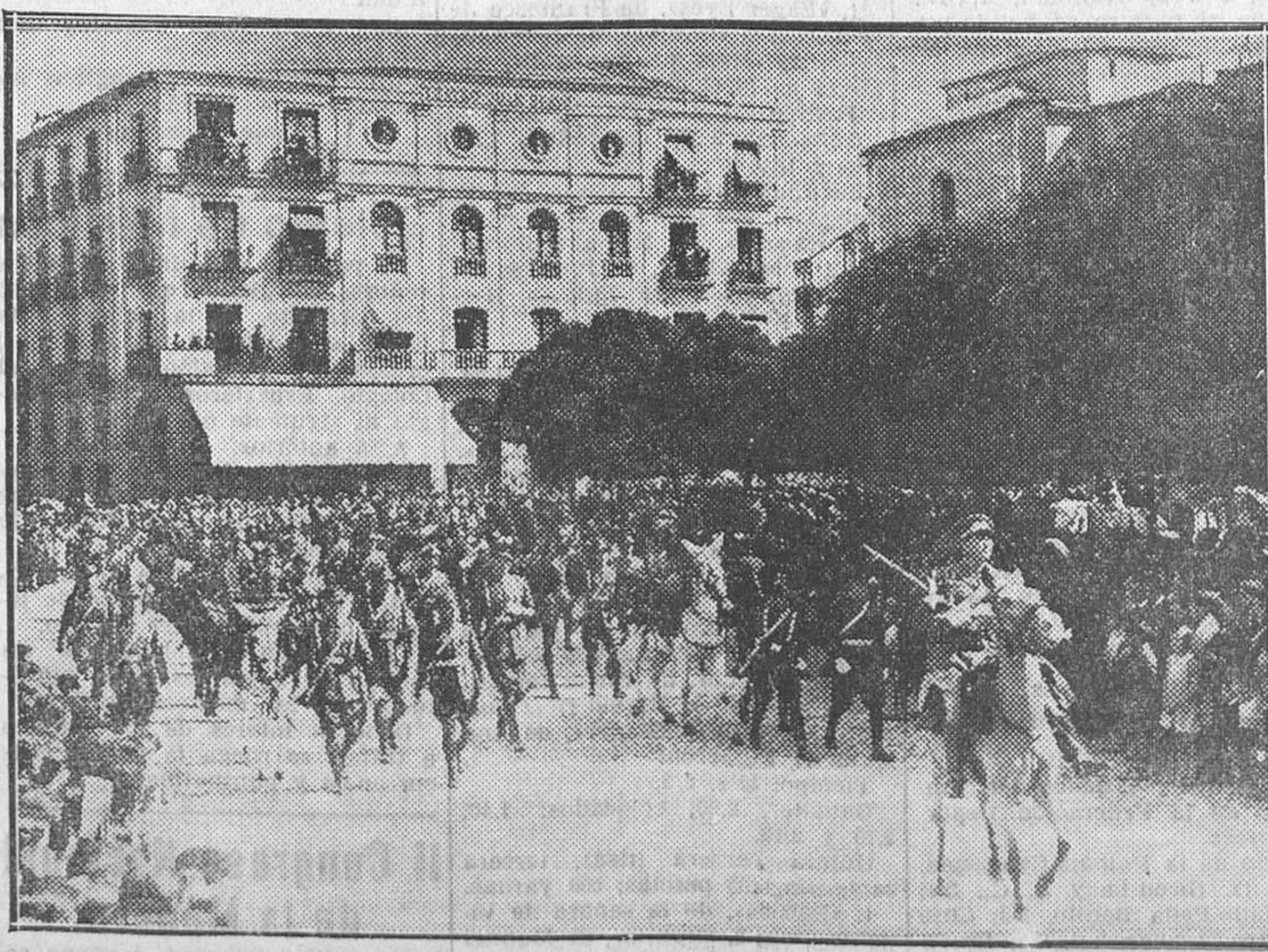
EL EJERCITO REPUBLICANO.—Desfile de los alumnos de Artillería y de Ingenieros por la plaza Mayor de Segovia, ante las autoridades y el pueblo, asociado con entusiasmo a la fiesta militar de ayer.

Murcia, 7.—Se espera que llegue esta noche el alcalde, que fué a Madrid y La Coruña para resolver ciertos asuntos particulares. Dicese que inmediatamente dimisionará, y ya se barajan dos o tres nombres de concejales radicales para sustituirle.