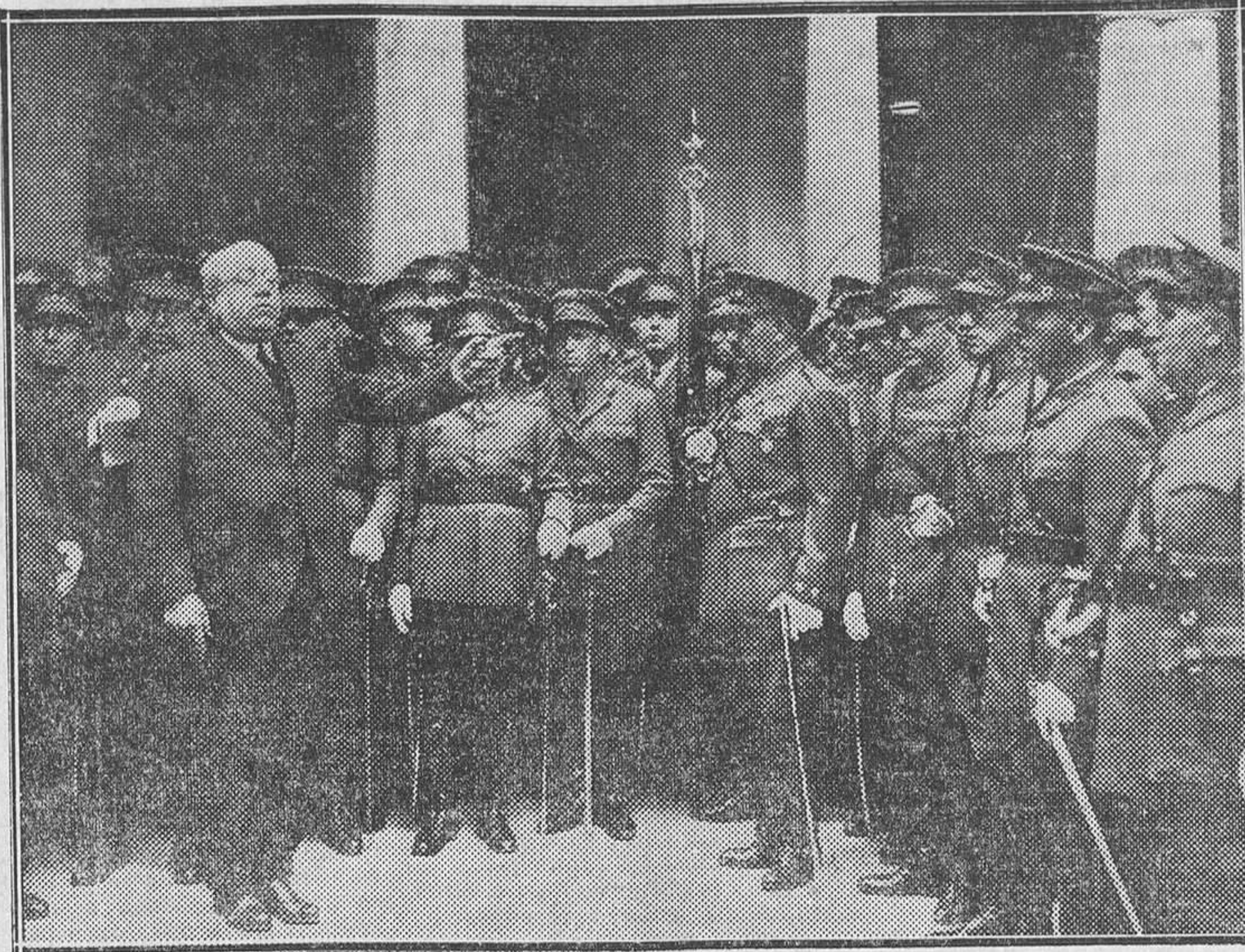
EL DIA DEL EJERCITO.—El ministro de la Guerra, D. Manuel Azaña, pronunciando un discurso en el solemne acto celebrado en Toledo para entregar la bandera republicana a las Academias de Infantería y Caballería.

entre el pueblo y el Ejército que este santo emblema de la patria.