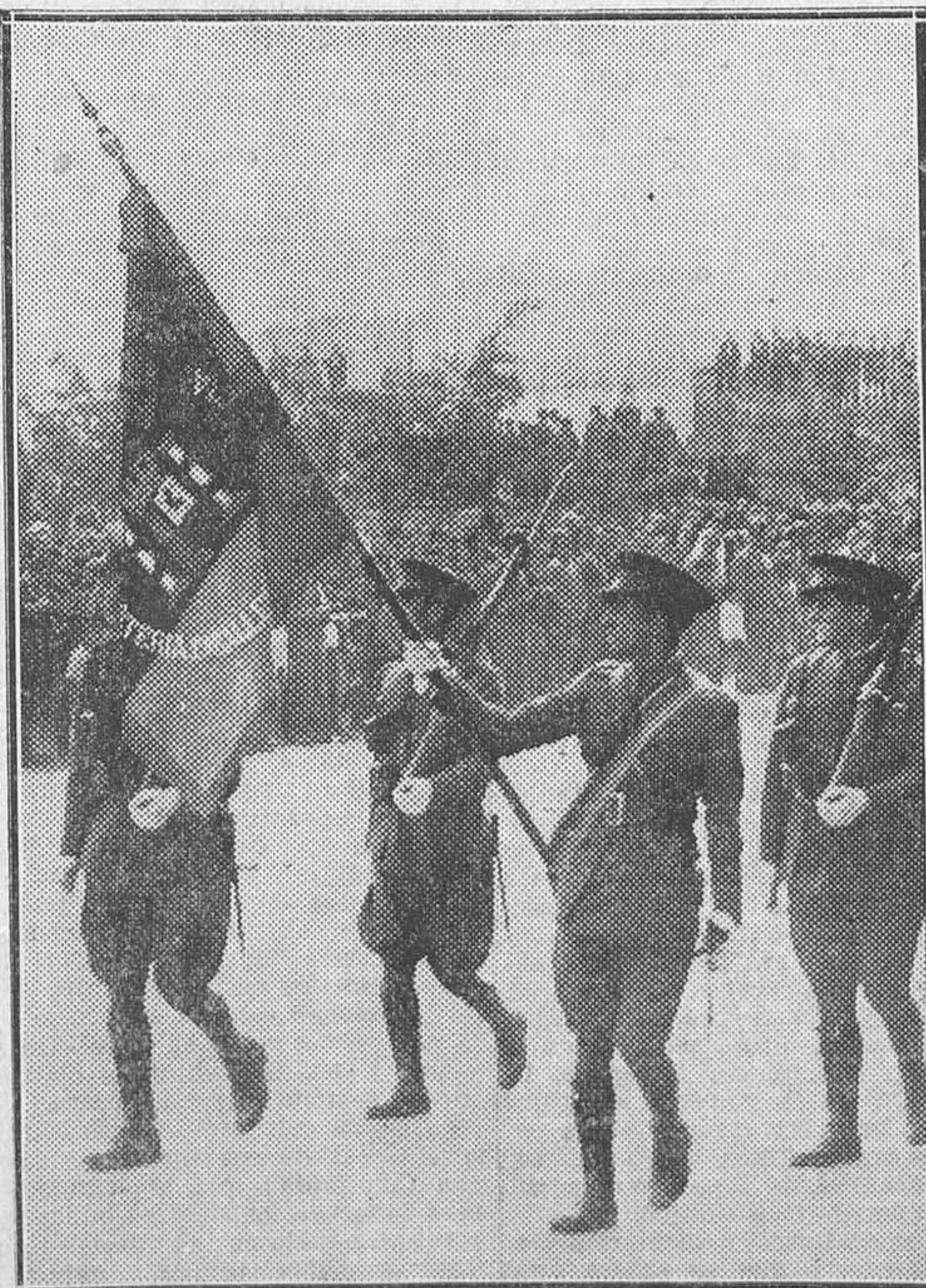
EL DIA DEL EJERCITO.—La nueva bandera de las Academias de Infantería y Caballería en el desfile, en Toledo, ante el ministro de la Guerra y las autoridades locales.

Dijo que los alumnos son trabajadores que tienen la misión de defender la República de trabajadores. Terminó diciendo que está seguro de que la bandera no se manchará de sangre más que en caso necesario. A continuación habló el coronel de la Academia, Sr. Gamir, diciendo que la Academia rinde tributo al pueblo de Toledo, ligado desde tiempos tradicionales a la Infantería, que no ha podido escoger otro símbolo mejor de unión