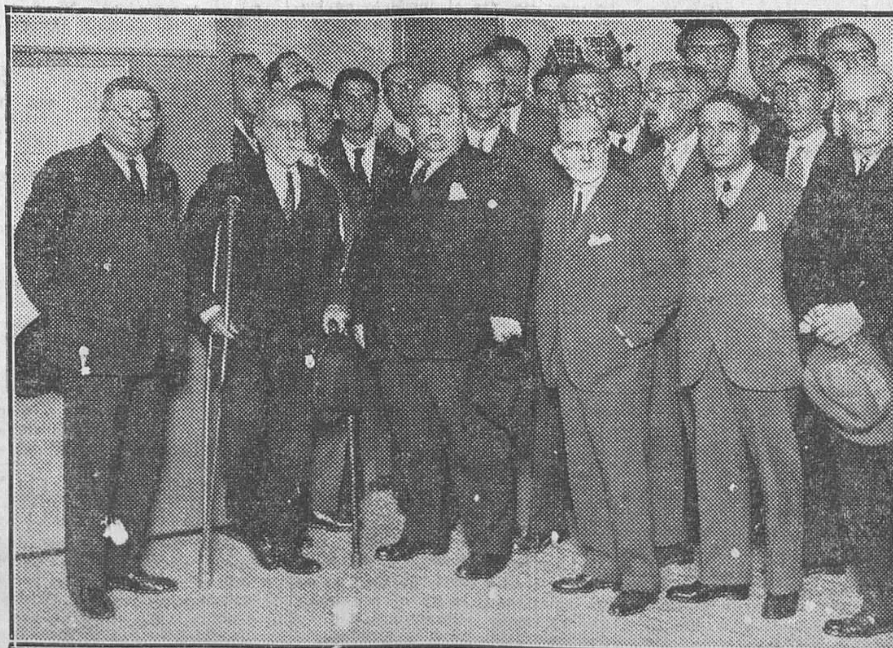
El alcalde de Madrid en el acto inaugural de la Exposición de anteproyectos de extensión de Madrid

Si se coteja el artículo 15 de nuestro proyecto con el 14, ya aprobado, de la Constitución que las Cortes discuten se observará en la determinación de las facultades que como inalienables han de reconocerse a la competencia exclusiva del Poder central en la estructuración autonómica de la nación, las concordancias son múltiples, casi totales, y las discrepancias, insignificantes. Y respecto de la organización y de las atribuciones privativas que se reclaman para el país vasconavarro, como no afectan a la substancialidad propia del Estado nacional ni han de ser origen de discordias con él, sino amplio campo dentro del cual se ha de mover, en beneficio general, la actividad de las provincias con el acierto que hace esperar una experiencia de siglos, las Diputaciones confían que el Gobierno provisional y las Cortes no han de verlas con recelo, sino más bien han de sentir el agrado de poder consagrar con su sanción prácticas venerandas de muchos años, que sin dañar al interés común de la nación han asegurado el progreso, el orden político y la prosperidad de las cuatro provincias hermanas, que en este momento