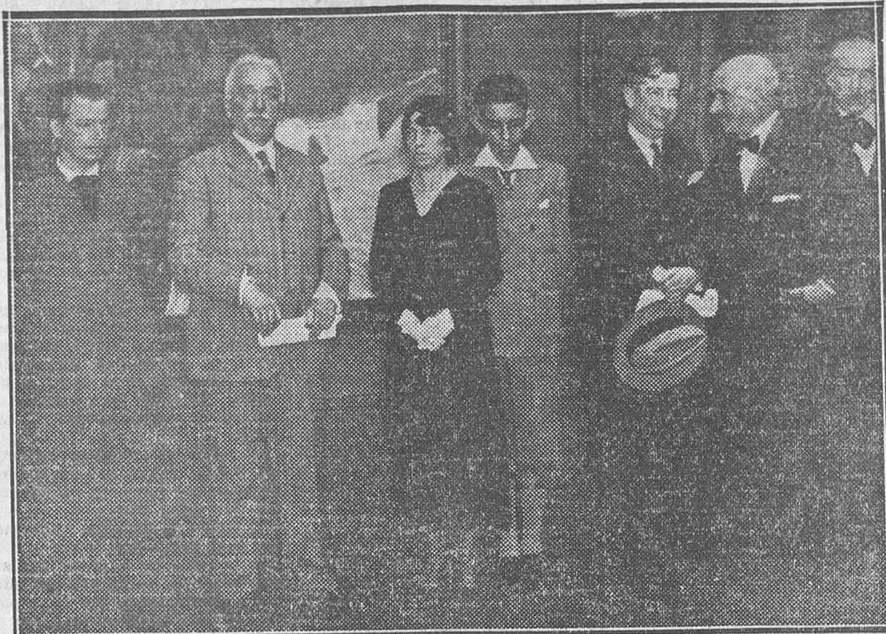
La familia del insigne e inolvidable Sorolla haciendo entrega al jefe del Gobierno y al ministro de Instrucción pública y Bellas Artes del Museo que lleva el nombre del glorioso pintor.

Los conflictos sociales Se han resuelto las huelgas siguientes: En Salamanca, la de agrícolas de