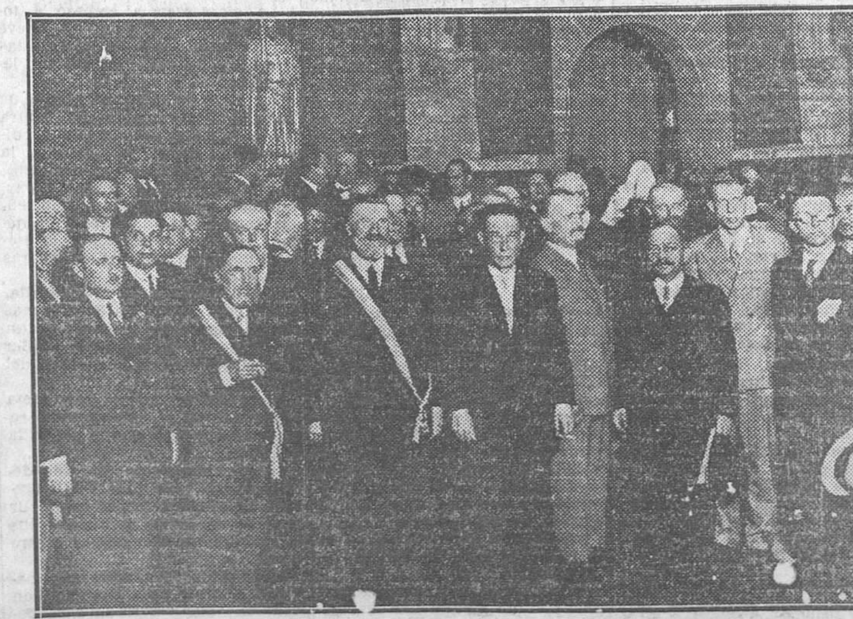
Acto de nombrar hijo adoptivo de Barcelona al alcalde de Toulouse, celebrado en el Salón de Ciento del Ayuntamiento barcelonés

Ha dado órdenes severísimas a los dueños de quioscos de periódicos para que retiren las publicaciones obscenas que tienen a la vista del público, bajo apercibimiento de clausura de los establecimientos que no cumplan esta disposición.