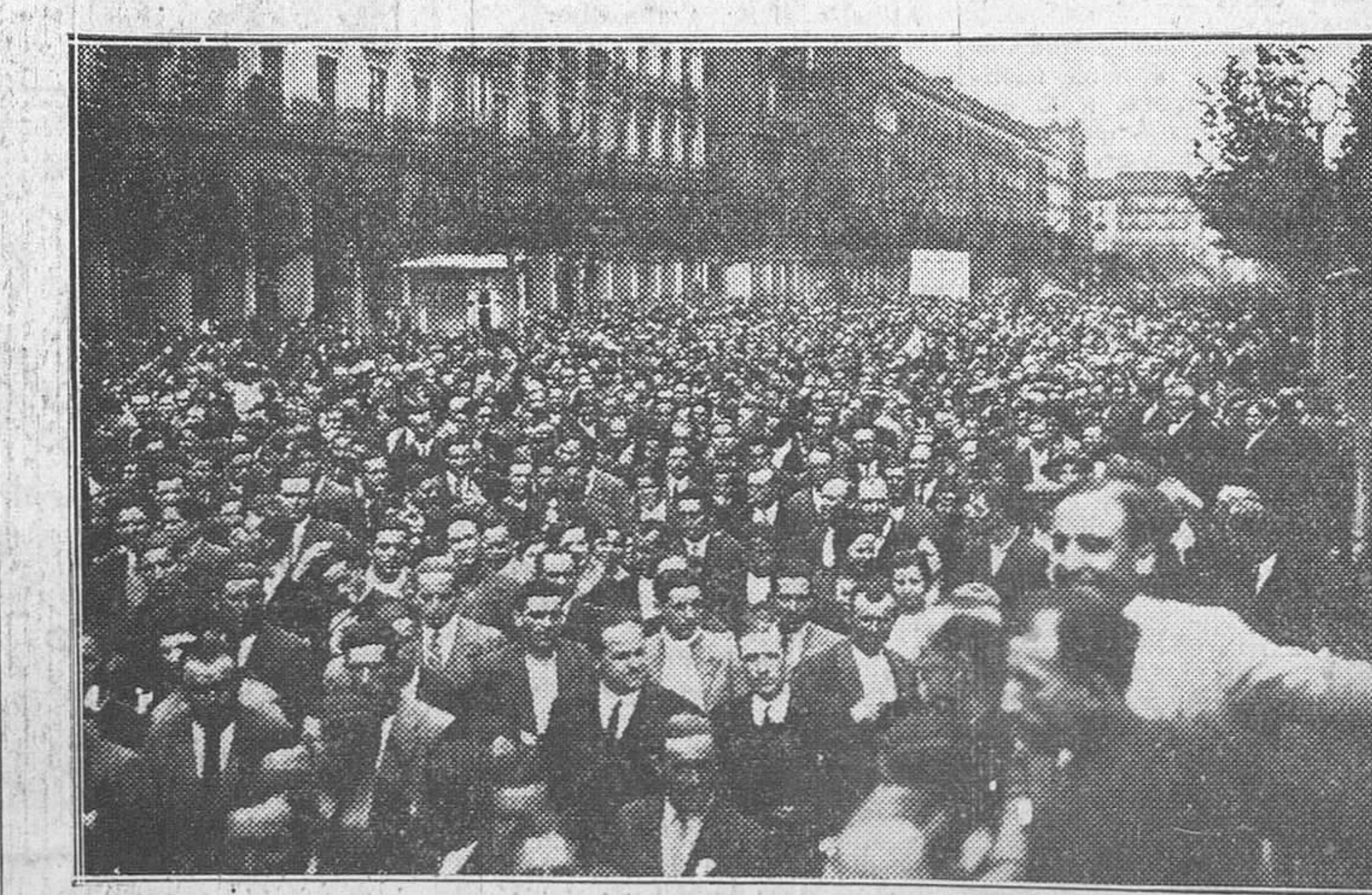
Manifestación que con motivo de la fiesta del Primero de Mayo recorrió las calles de Zaragoza