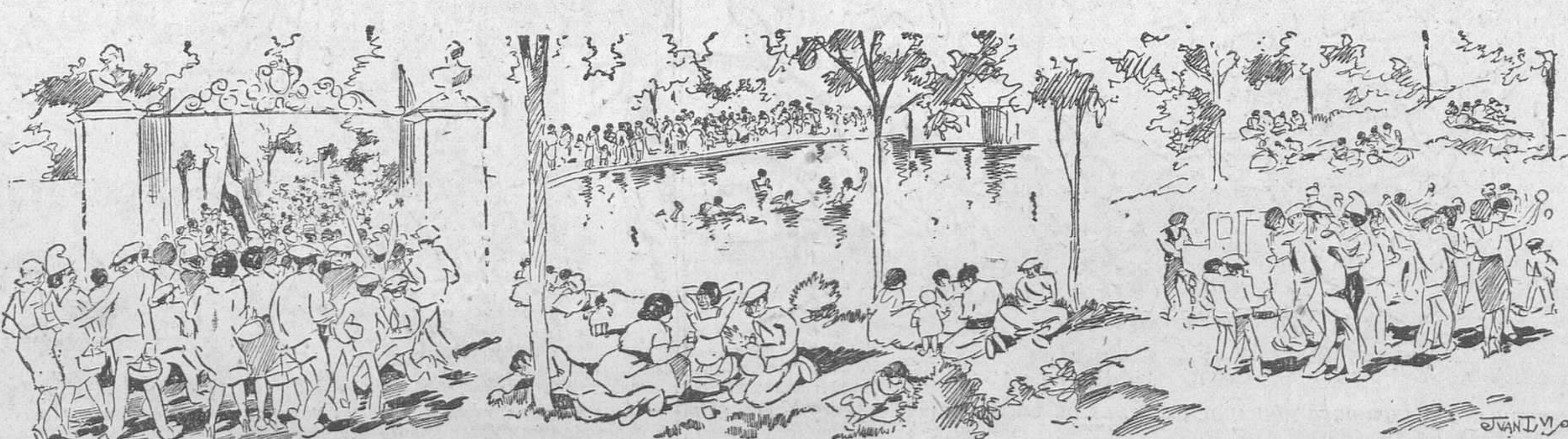
El pueblo madrileño, dueño y señor de la Casa de Campo, su regia posesión (Apuntes del natural por Juan Luis)

En los escalones de la Morería—última visión del Gran Día de la República—, una mujer indiscernible—una mendiga, un pecador—?—duerme rendida acaso de gritar. A su lado, reclinada en el quicio, vela su sueño de vagabunda