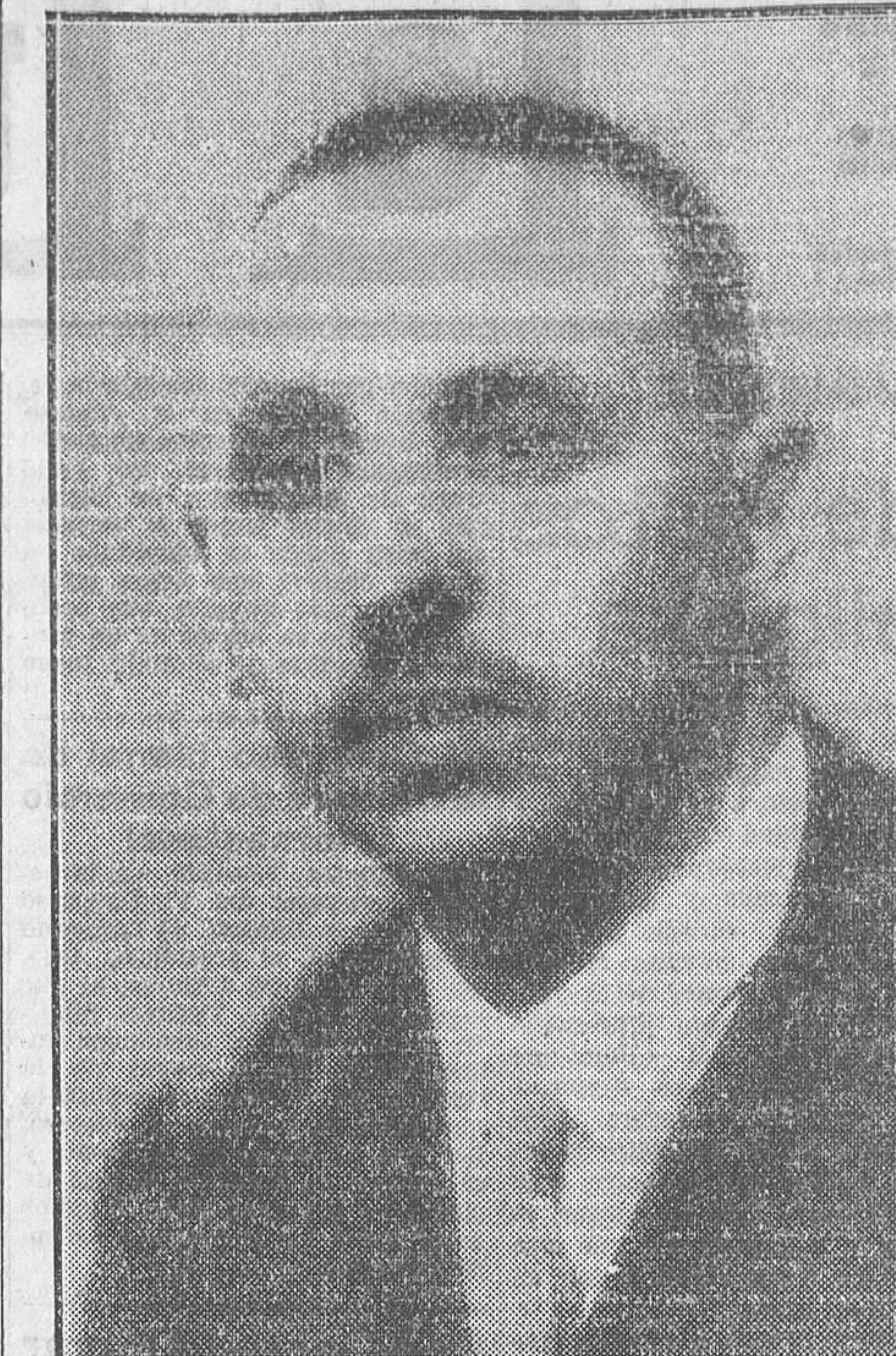
Don Manuel Ossorio Florit, subsecretario de Gobernación

Pero al salir del establecimiento se le acercó un joven sin nada en la cabeza y una pluma en la oreja, que le dijo a Fructuoso si era él el que había cobrado en aquel mismo momento las 3.000 pesetas. Contestó que sí, y entonces el joven le dijo: —Pues deme esa cantidad, porque existe un error que hay que