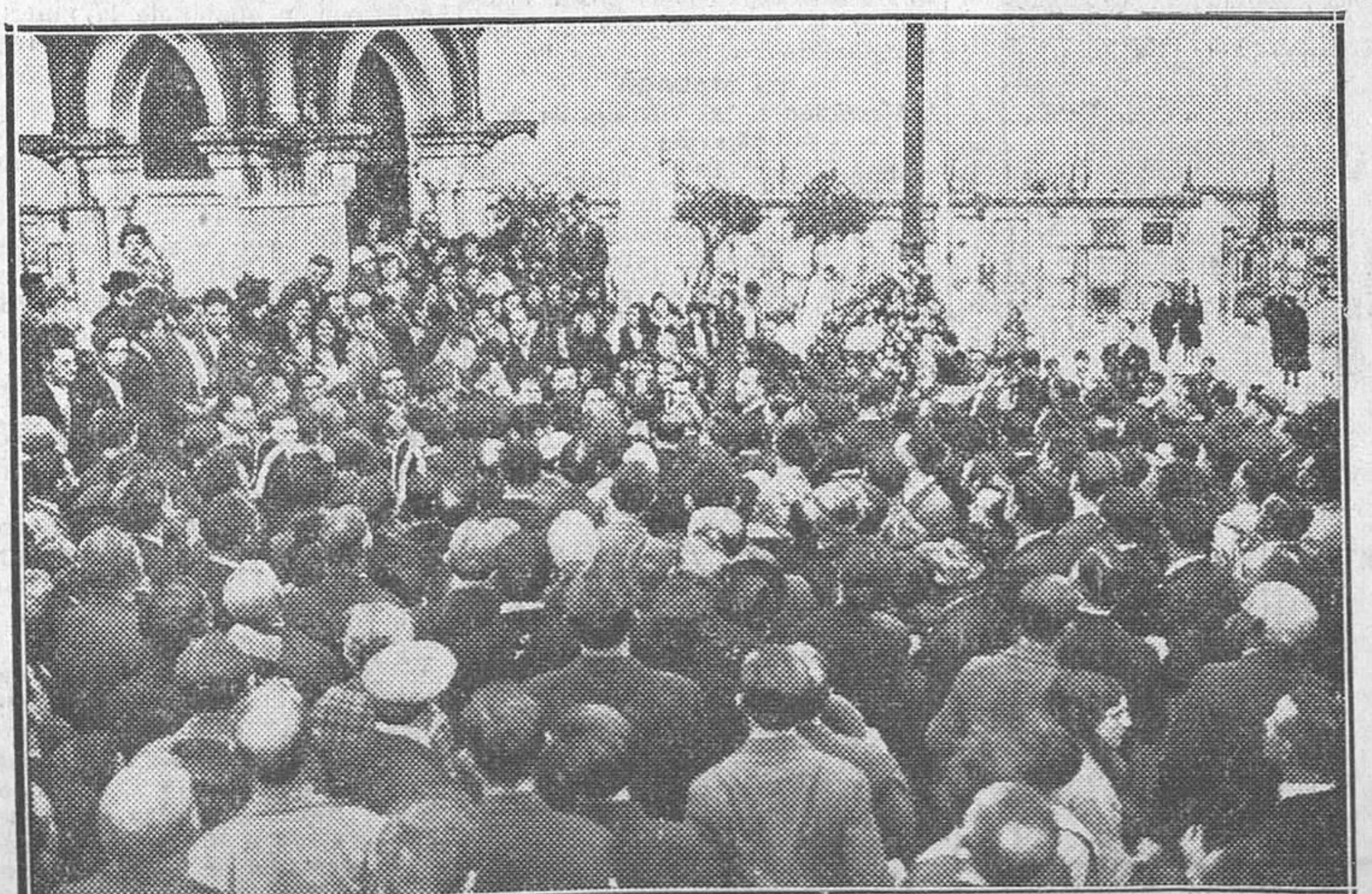
EL PRIMERO DE MAYO EN LA CORUNA.—La manifestación cívica organizada en el Ayuntamiento depositando flores en las tumbas de los republicanos significados fallecidos

Esta disposición fué dictada cuando al aprobarse las bases de trabajo y los salarios protestaron