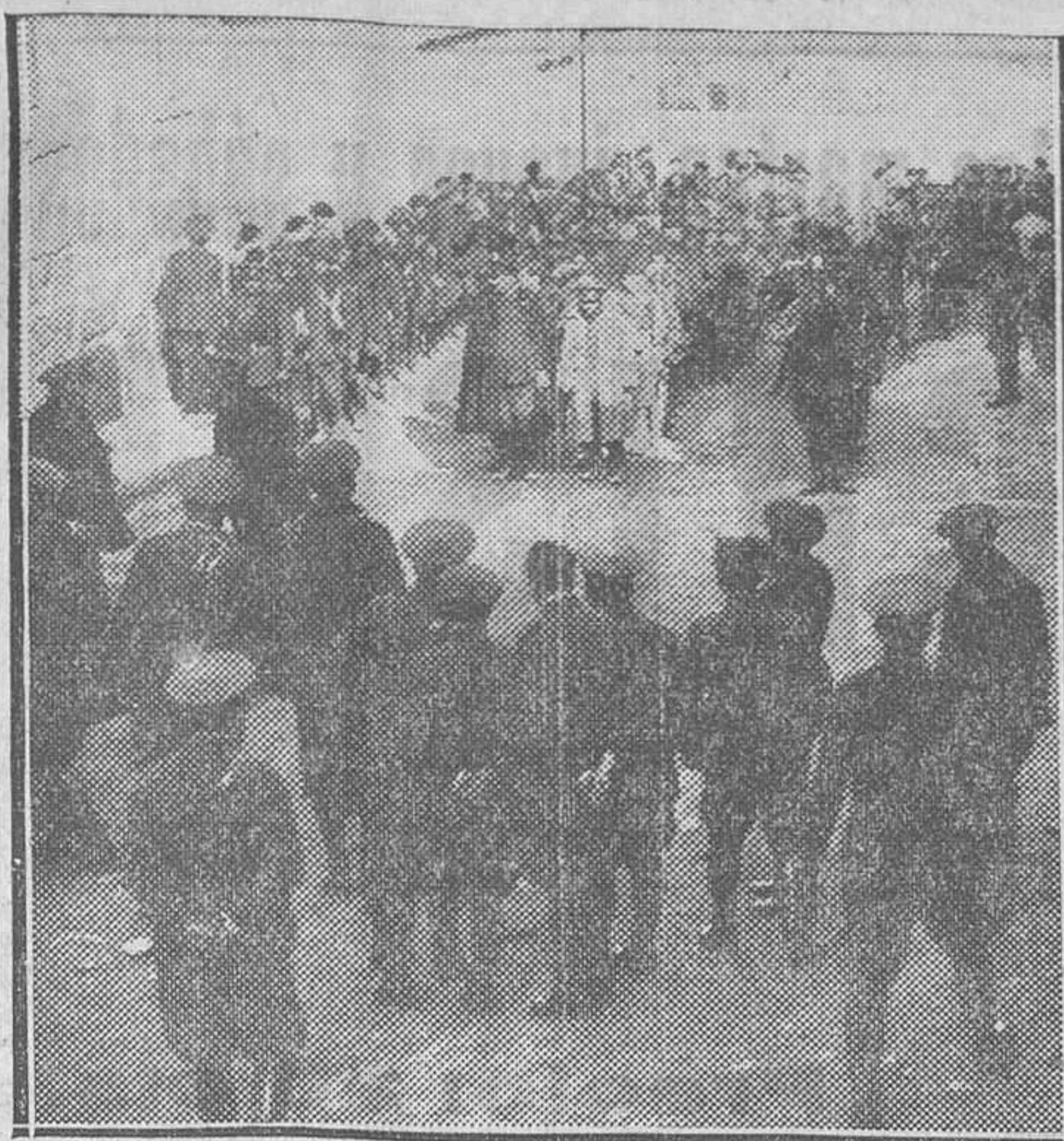
Prisioneros de la columna revolucionaria ante el general Dolla