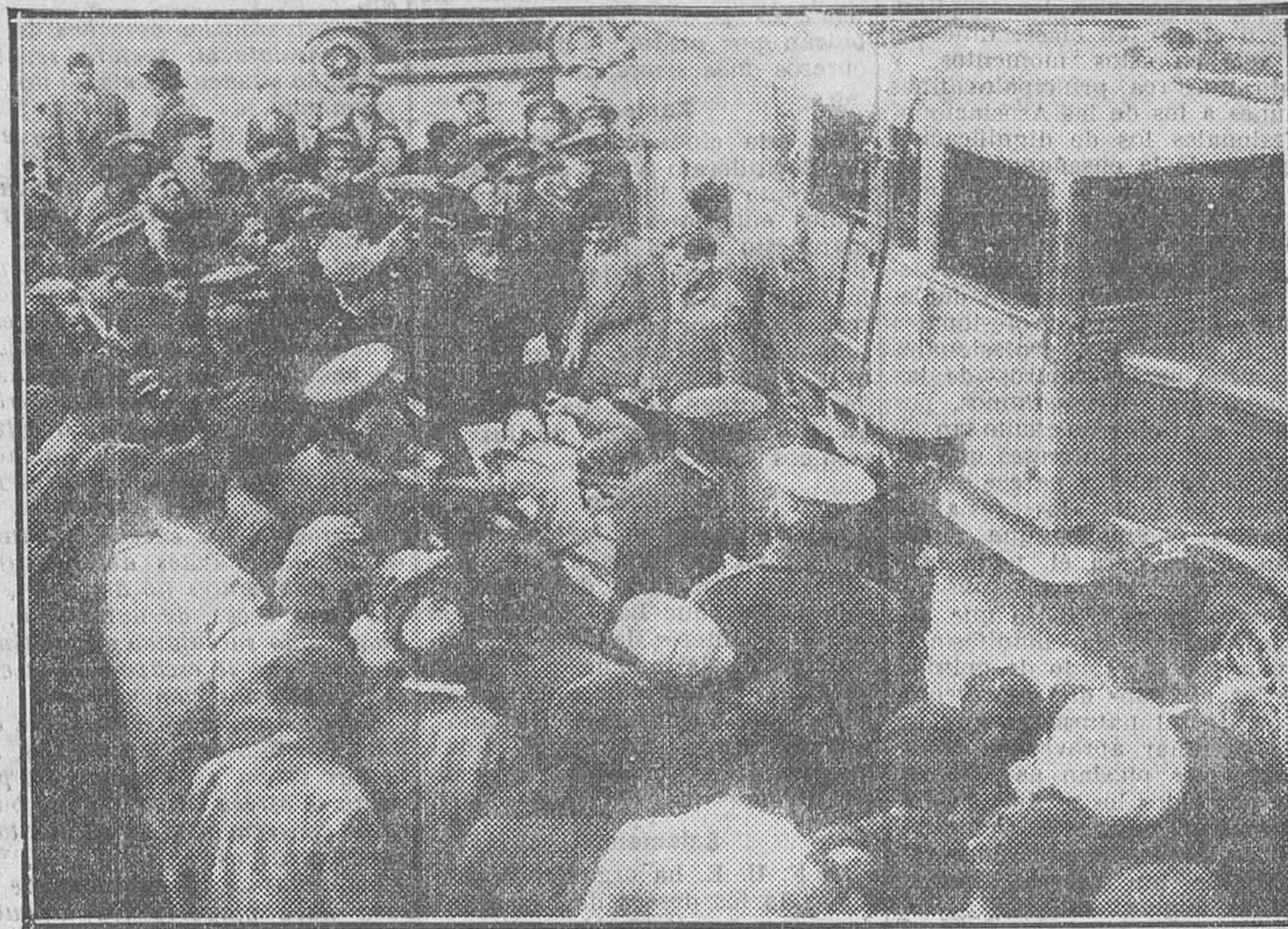
Llegada de heridos a Huesca

Ya, de espaldas a una tapia, frente al piquete a una distancia