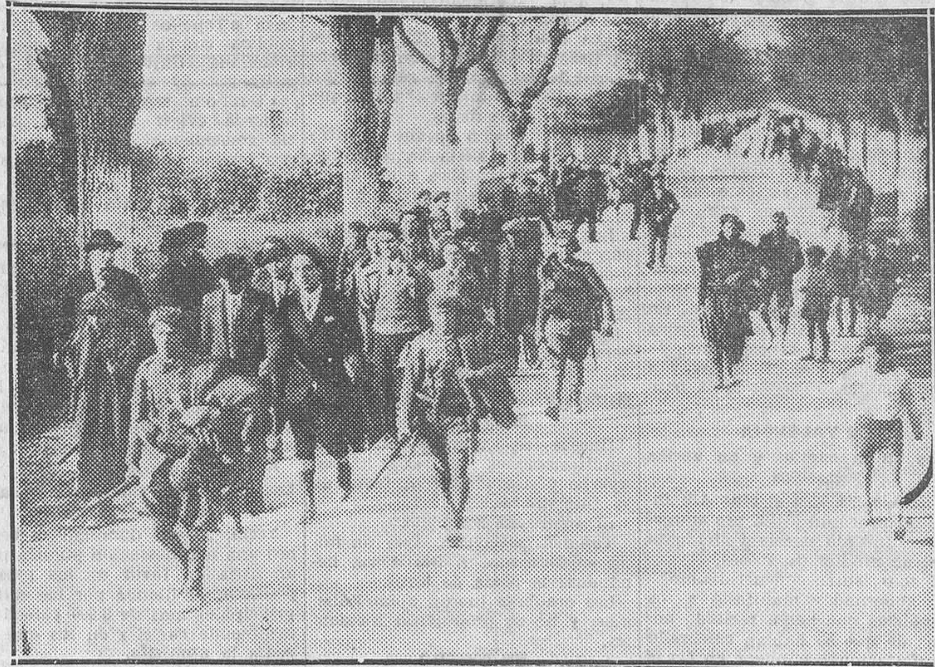
Bravos muchachos de la columna revolucionaria, prisioneros de las tropas del general Dolla, conducidos por la carretera de Jaca

Corría ya la madrugada. El frío de nieve que atería los cuerpos no lo era tanto como el que helaba los espíritus debatiéndose en los últimos reducidos de la esperanza. ¿Todo perdido? Todo evidentemente perdido. Entonces los oficiales a quienes Galán había confiado el mando de las tropas