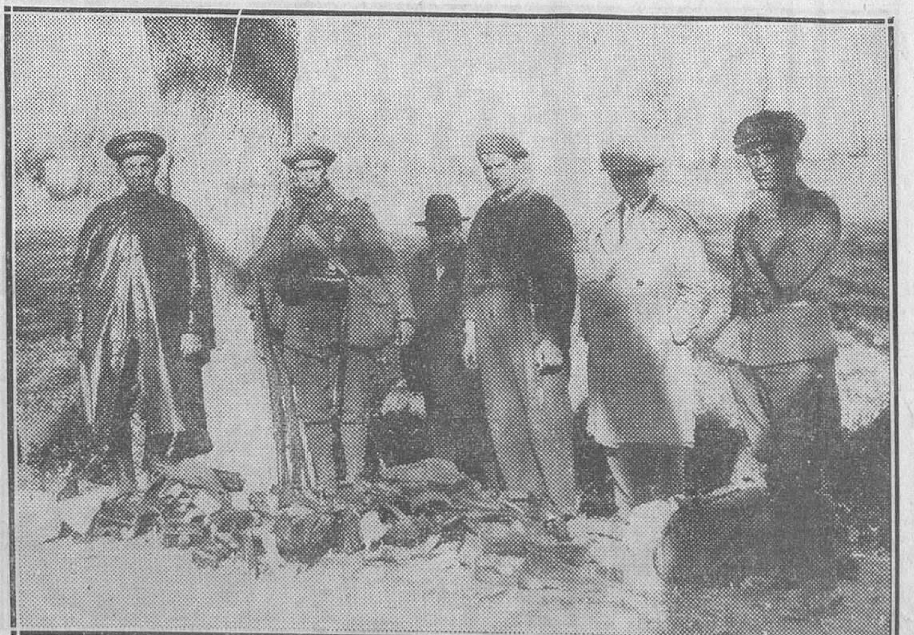
Armamentos y enseres cogidos a los sublevados