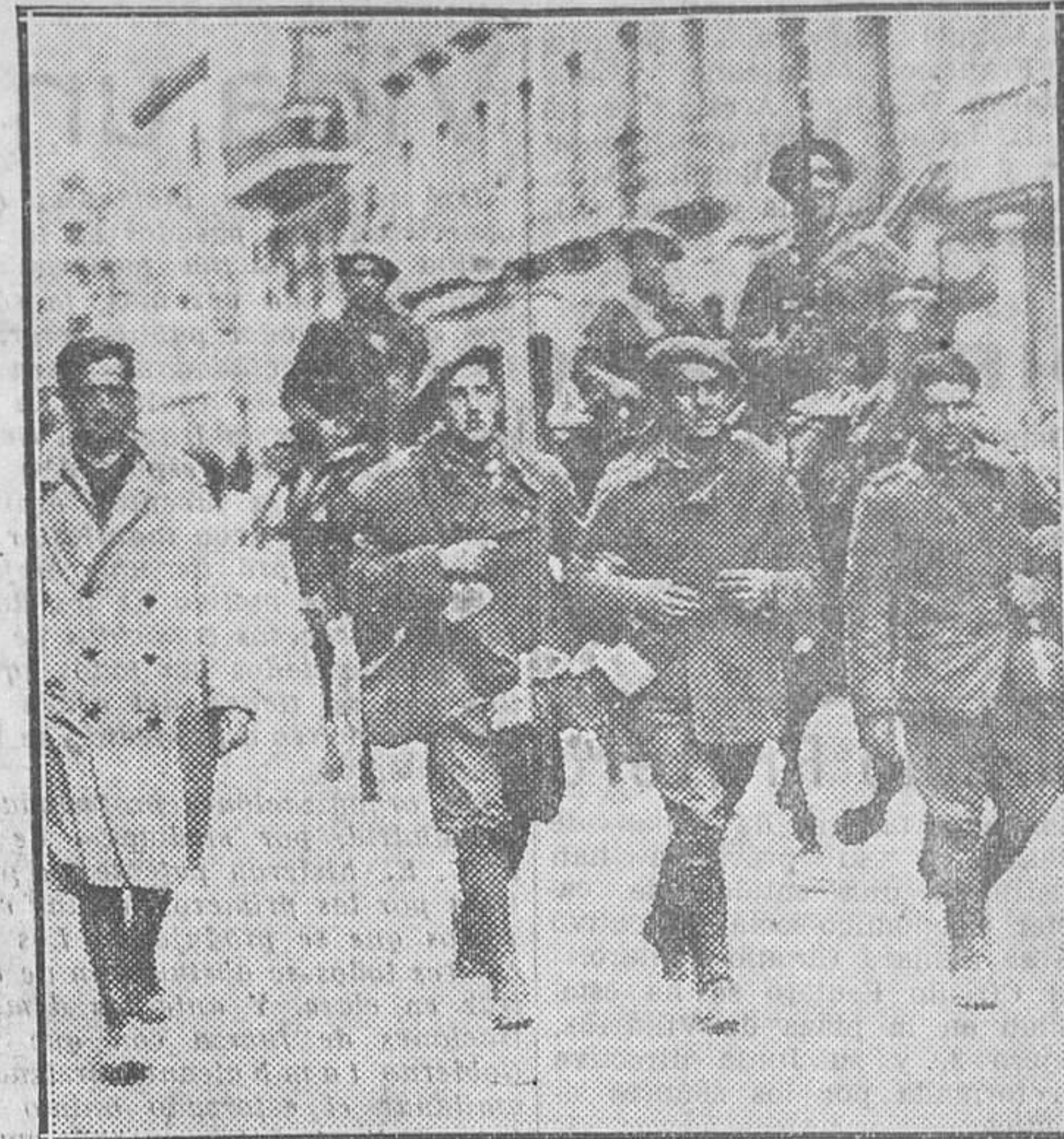
Oficial y soldados de la columna de Galán, prisioneros, a su llegada a Huesca