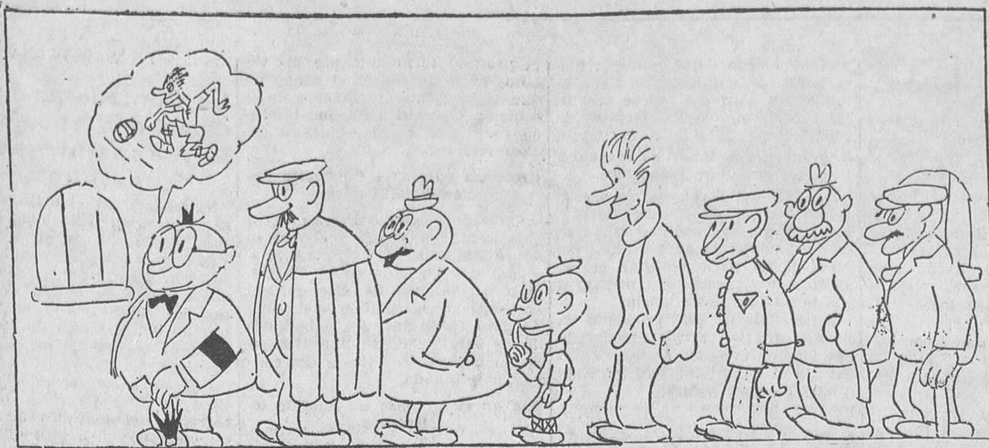
—Hoy estoy el primero en la cola...