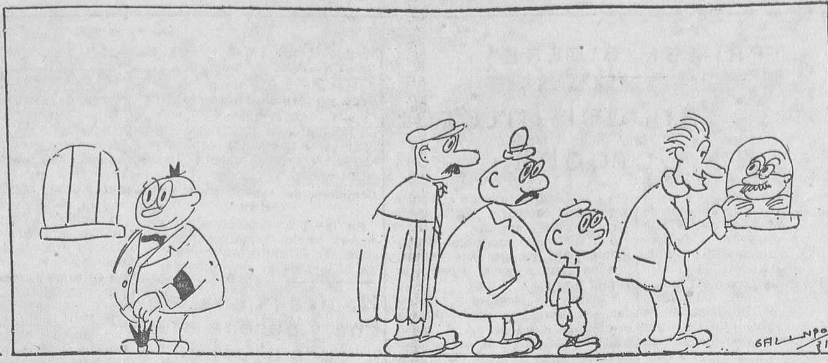
—Hoy no me ocurre lo que el domingo pasado, que me quedé sin entrada.