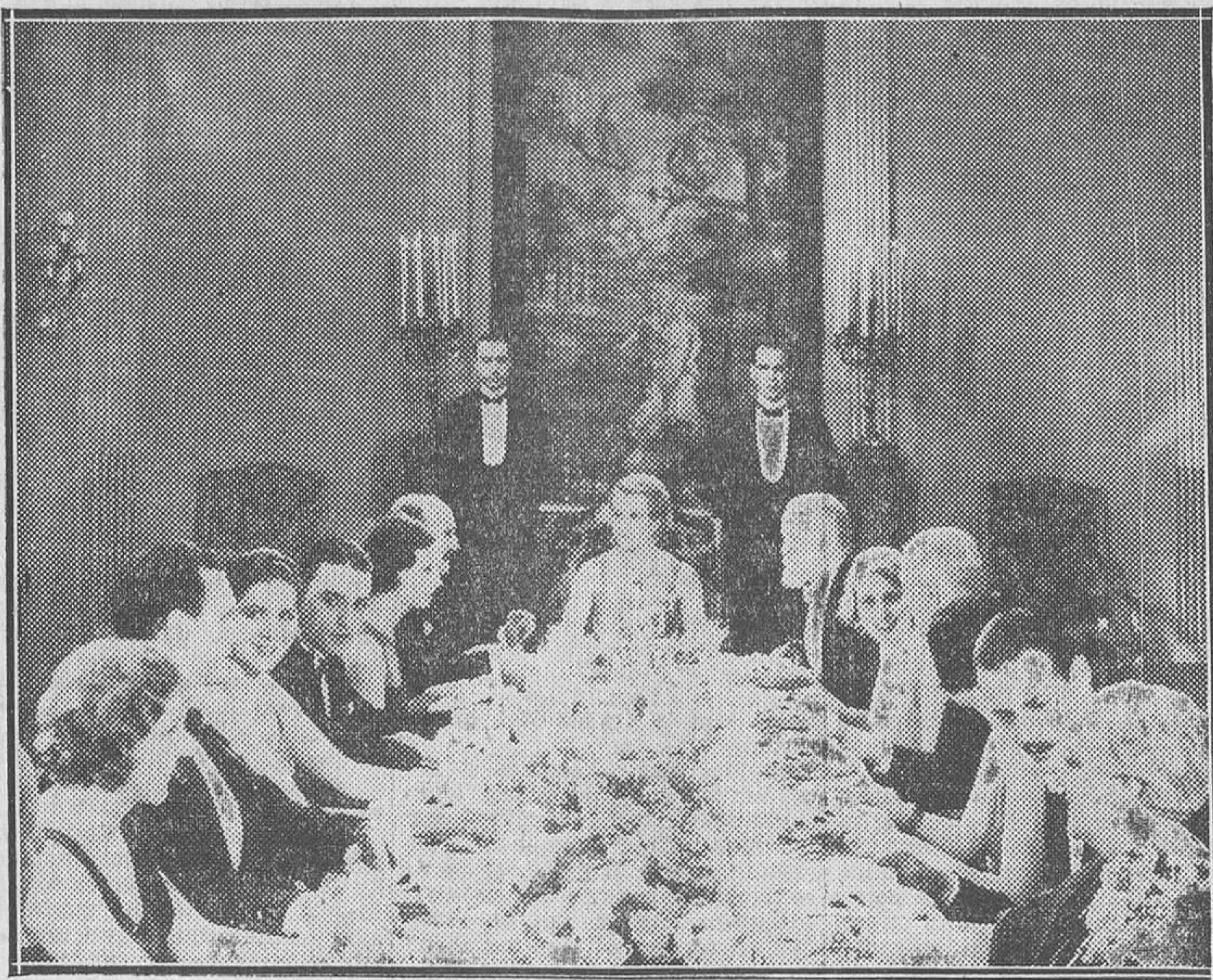
UNA ESCENA DE «LA INCORREGIBLE», FILM PARAMOUNT QUE PROXIMAMENTE SE ENTRENARA EN RIALTO

de Jannings—. A los cuatro días de trabajar tuve oportunidad de verme en la pantalla y quedé sencillamente aterrorizado. No creía creer que aquel hombre con aquella cara, con tan raros y descompasados movimientos, fuera yo, en efecto. Me asusté de mi propia imagen y quise huir; pero fui detenido por dos ayudantes del director de escena, el cual, muy energicamente, me exigió el cumplimiento de mi contrato o la devolución del dinero recibido a cuenta. Aquel hombre me pidió algo muy superior a mis fuerzas, y es el principal responsable—probablemente—de mi carrera cinematográfica. Desde entonces no me ha sido posible despegarme de la pantalla. Claro está que tampoco he hecho nada para lograrlo.