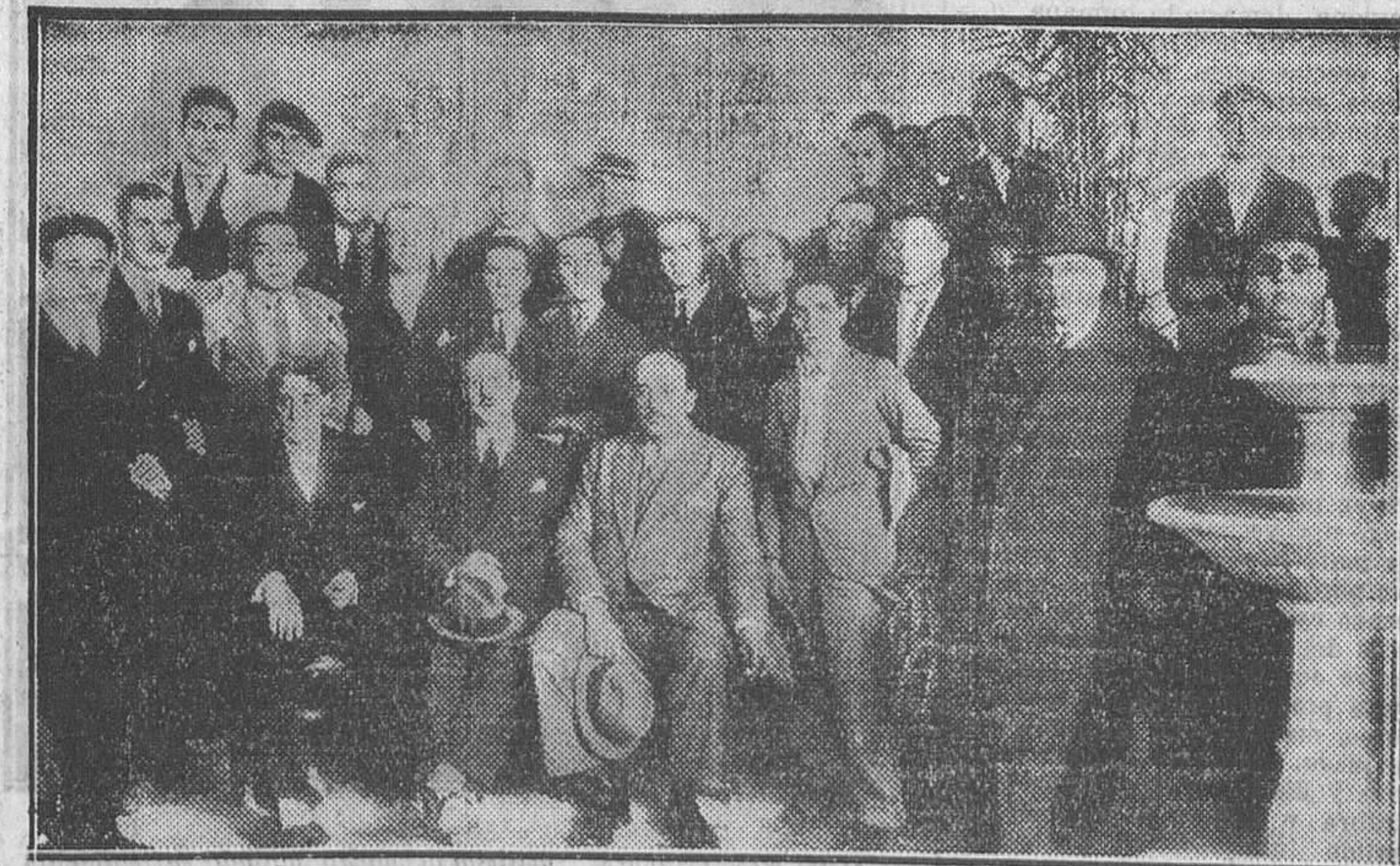
CORDOBA.—Las personalidades que asistieron a la solemne inauguración del Ateneo Cordobés

Una nota de la Cámara Agrícola La Cámara Agrícola ha enviado una nota a los periódicos, en la que se ocupa de la crisis de trabajo en los pueblos de la provincia.