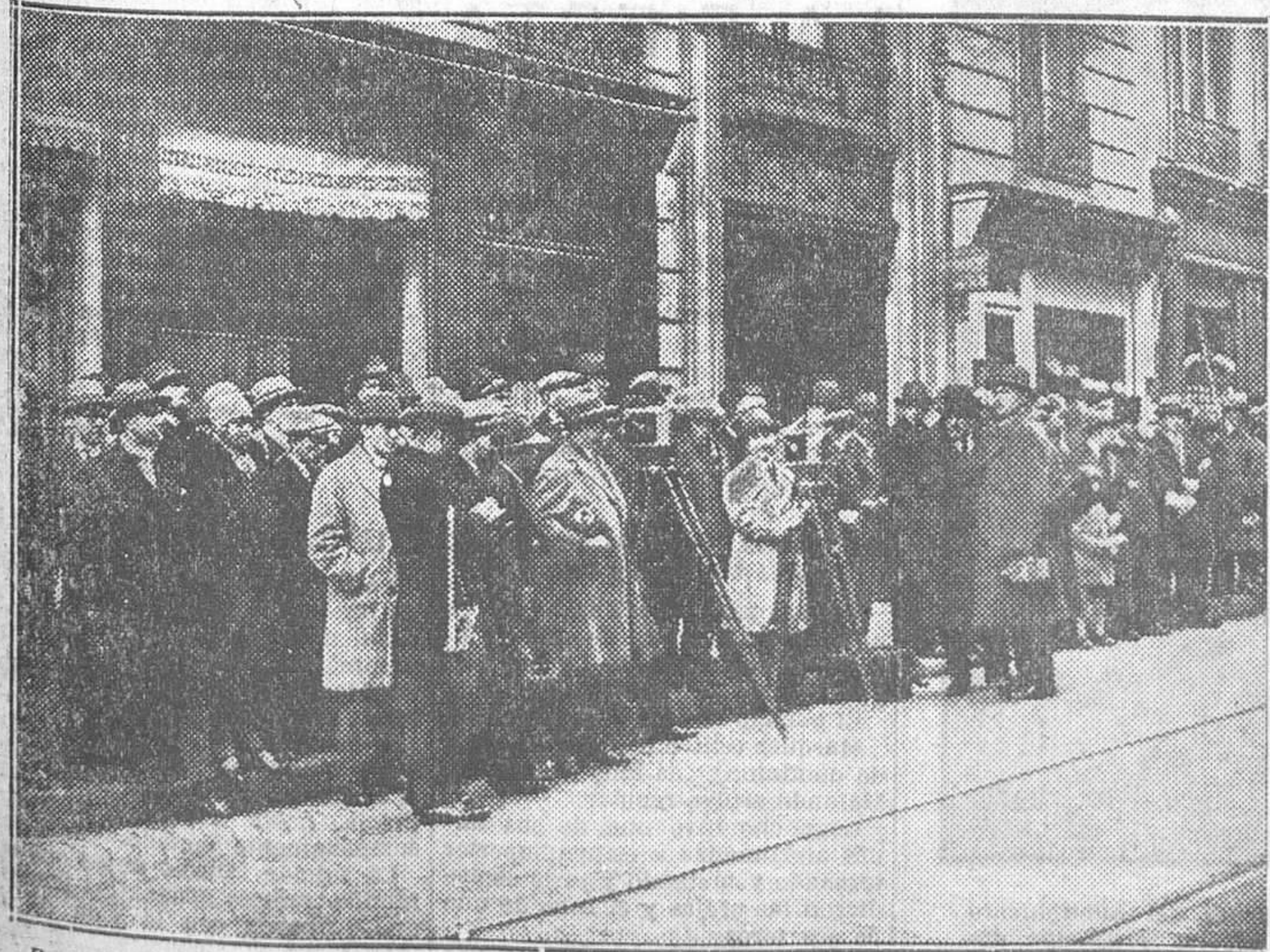
Periodistas y fotógrafos ante la casa de Clemenceau, al conocerse la noticia de su muerte

A las seis de la tarde la tranquilidad y el silencio son absoluta