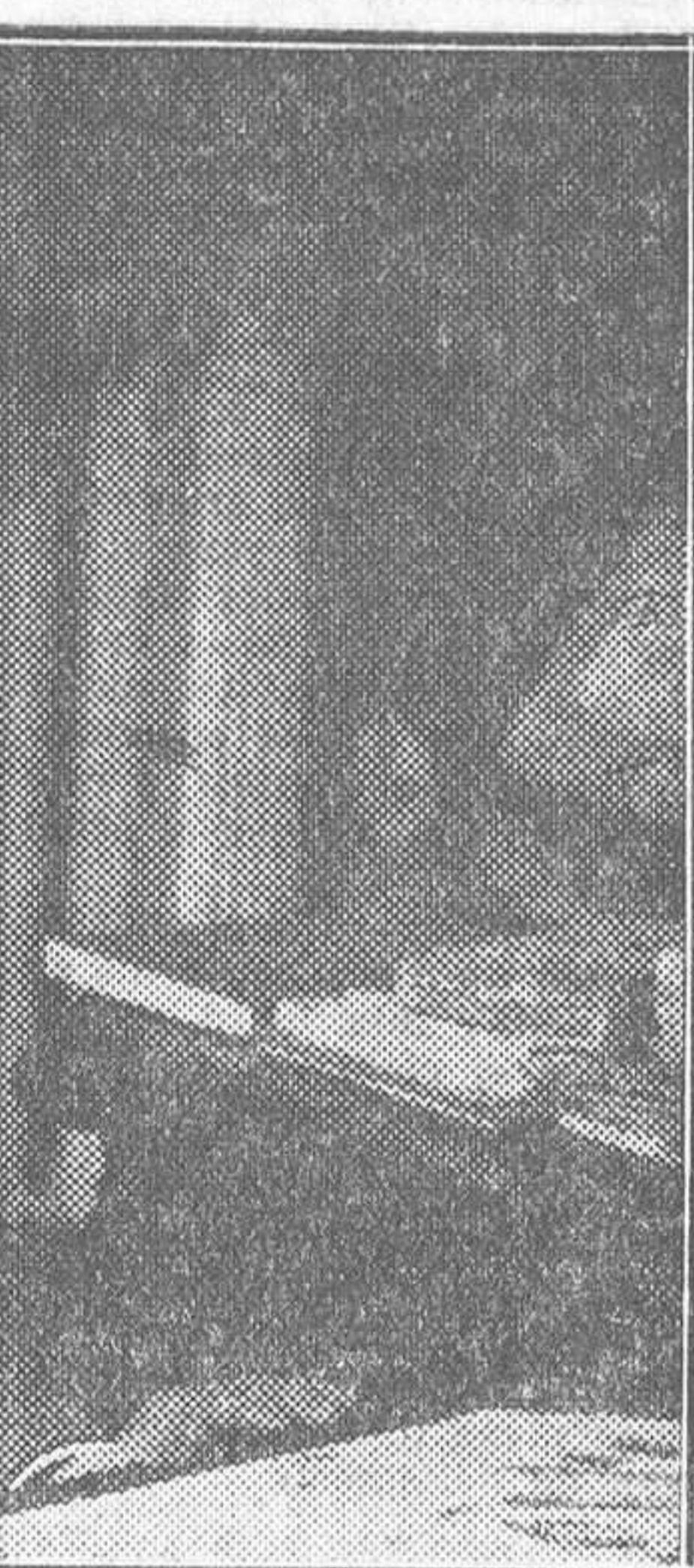
Ultimo retrato de Clemenceau, hecho en su gabinete de trabajo con motivo de la ultima conmemoración de la fecha del armisticio

El «ECHO de París», «Excelsior» y el «Matin» ponen de relieve, en sentidos artículos necrológicos, la magnitud de la obra llevada a cabo por el Sr. Clemenceau, su participación considerable en la victo-