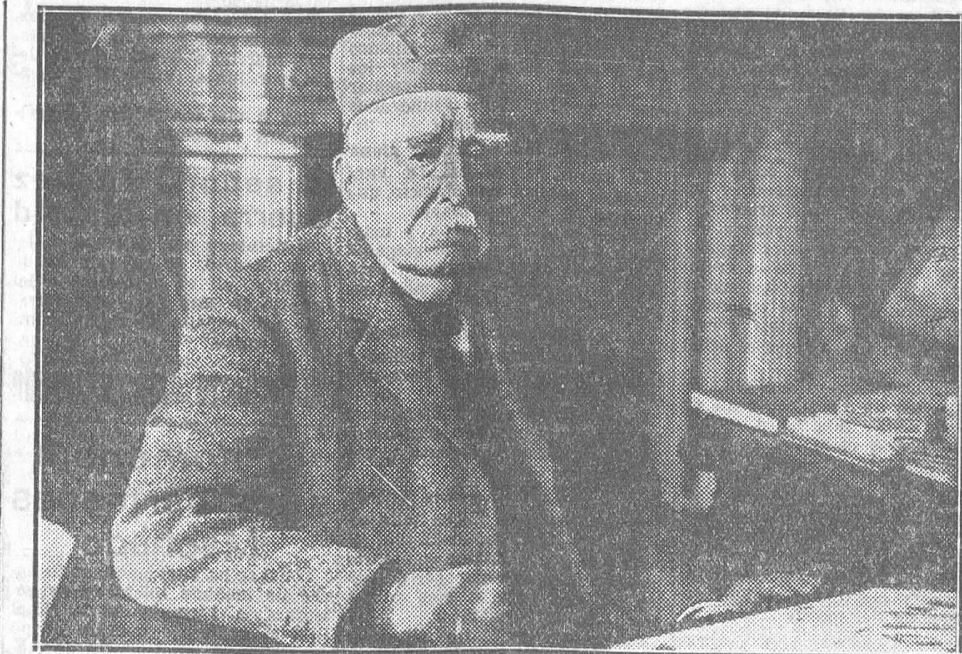
Ultimo retrato de Clemenceau, hecho en su gabinete de trabajo con motivo de la ultima conmemoración de la fecha del armisticio

Una tienda de campaña inmensa había sido instalada en la gran plaza del pueblo. Tres mil chuanes asistían al banquete, y una multitud inmensa se agolpaba en torno del recinto. No tienen ya aquel aspecto de la leyenda: saqueadores, degolladores, vestidos con pieles, con gorros de lana o cascos de cabra, contrabandistas trocados en guerrilleros; ya no son los embrujados de las bandas infernales, el Rompe-azules y la Vara Negra. Son honrados y ardientes republicanos que escu-