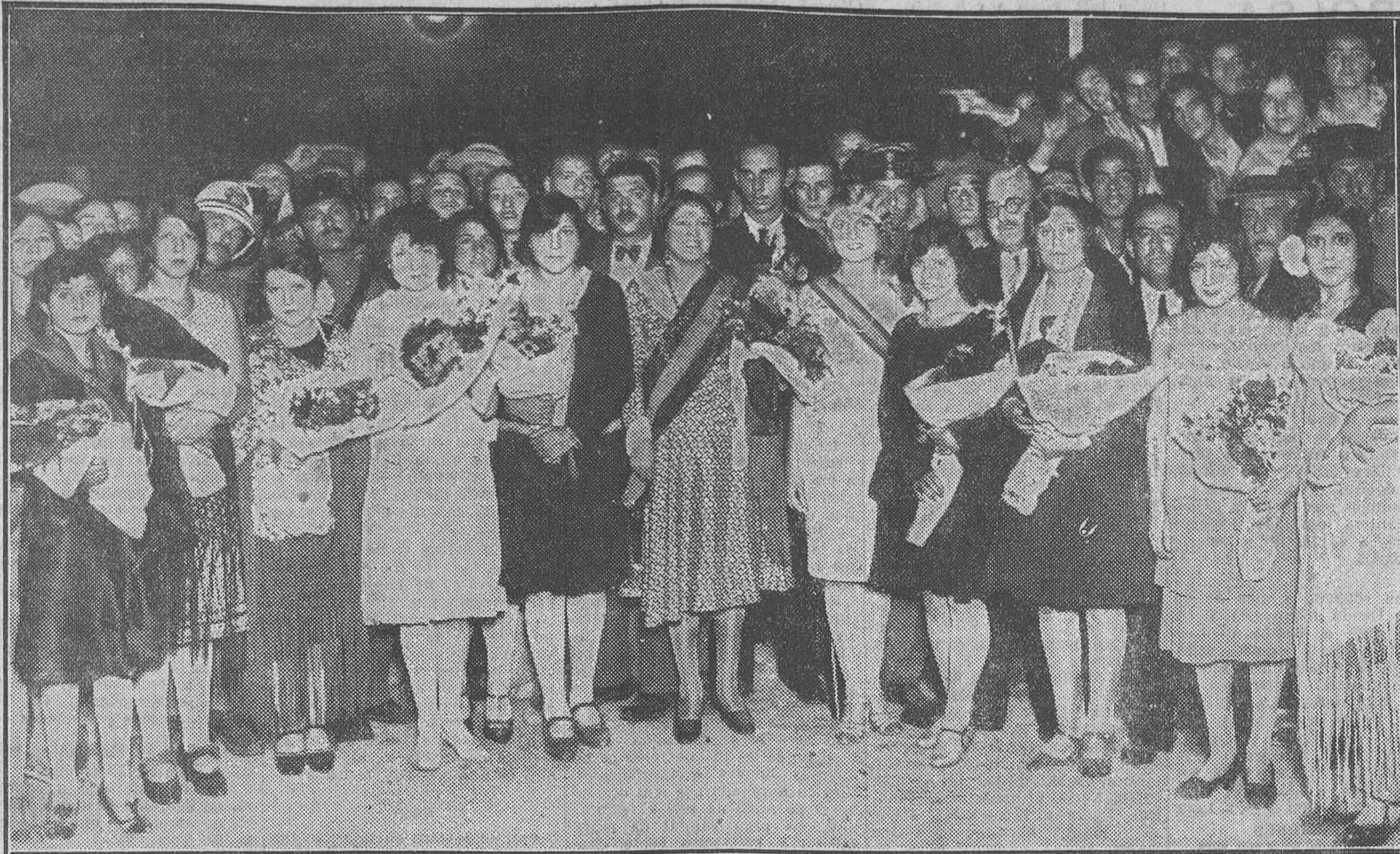
Las reinas de la belleza del barrio de Madrid Moderno y del distrito con las demás señoritas que se presentaron al concurso de belleza