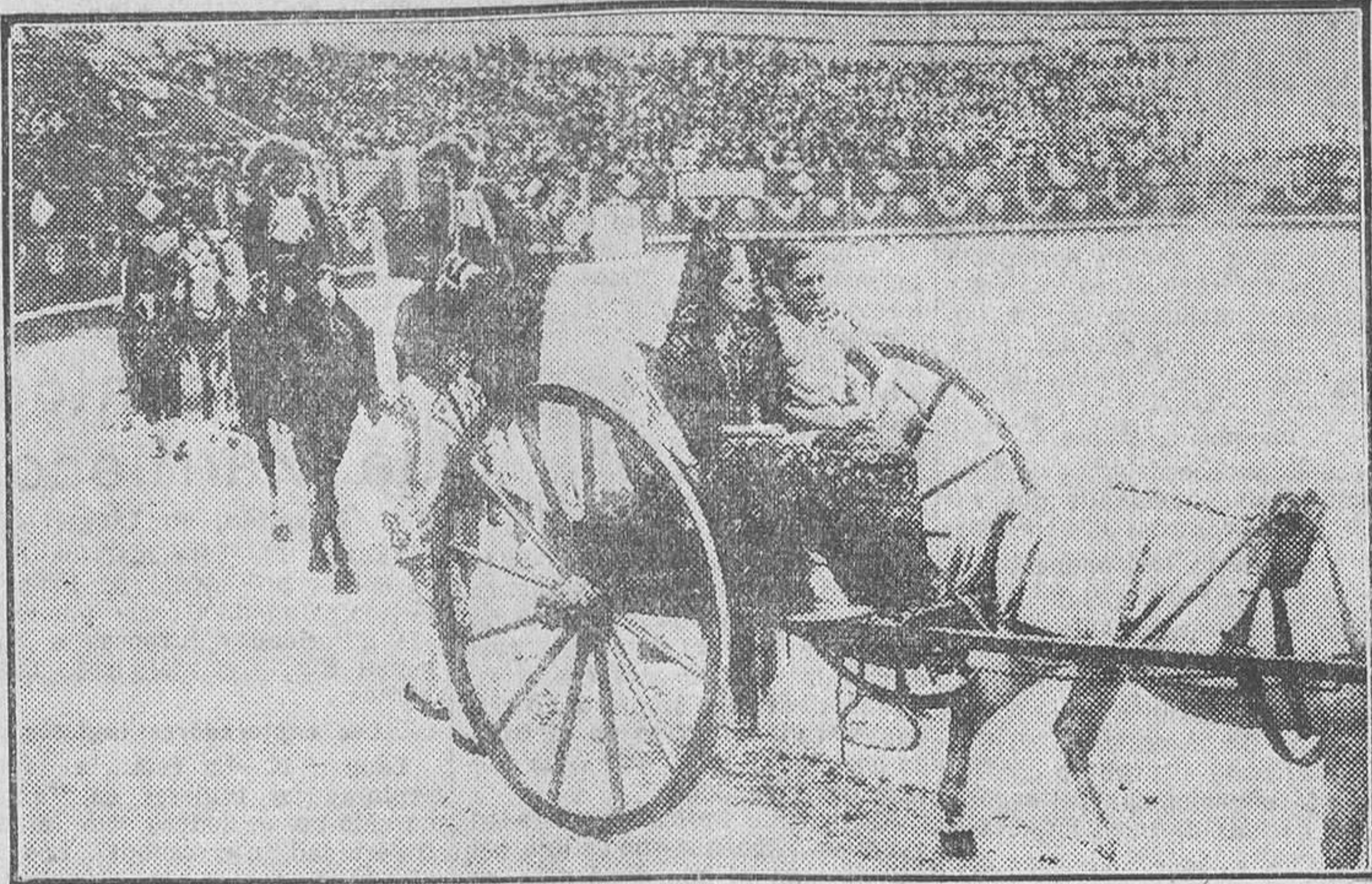
LA CORUÑA.—Desfile de las calesas en la corrida goyesca

La Coruña arde en fiestas durante todo el mes de Agosto. Fiestas que dedica a su heroína María Pita, como en tributo de admiración a quien tenga el valor de concurrir a todos los festejos. Día de varios puntos de la región. Ni los aires de Vasconía, carroza de construcción artística y de gran propiedad, la que obtuvo el mayor éxito; Aragón, en la histórica puerta del Carmen, con una elegancia del templo del Pilar; Cata-