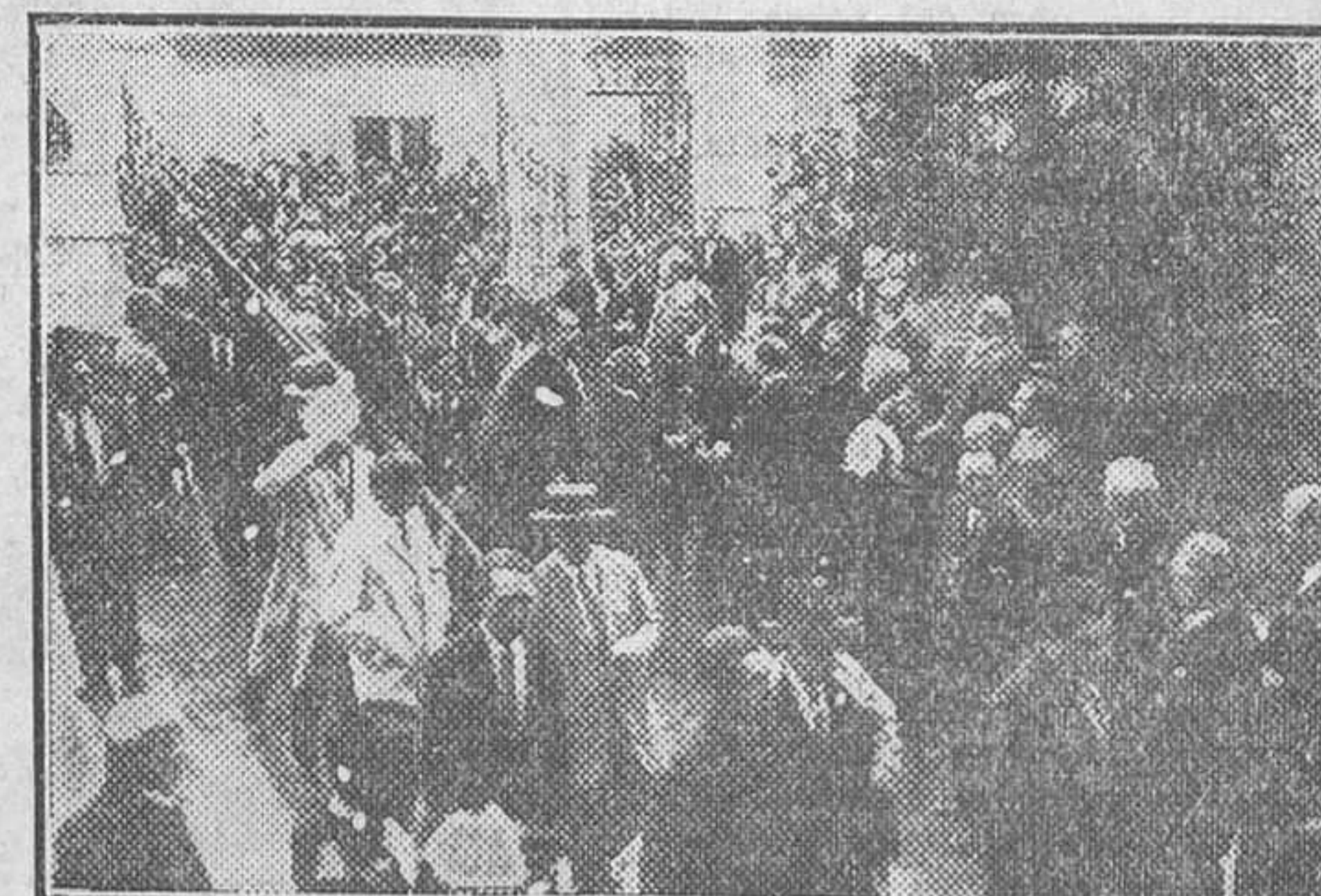
GIJÓN.—Después de la solemne inauguración de la Feria de Muestras

¡Lector! Consulte a diario nuestra sección de anuncios por palabras. En ella encontrará lo que desea