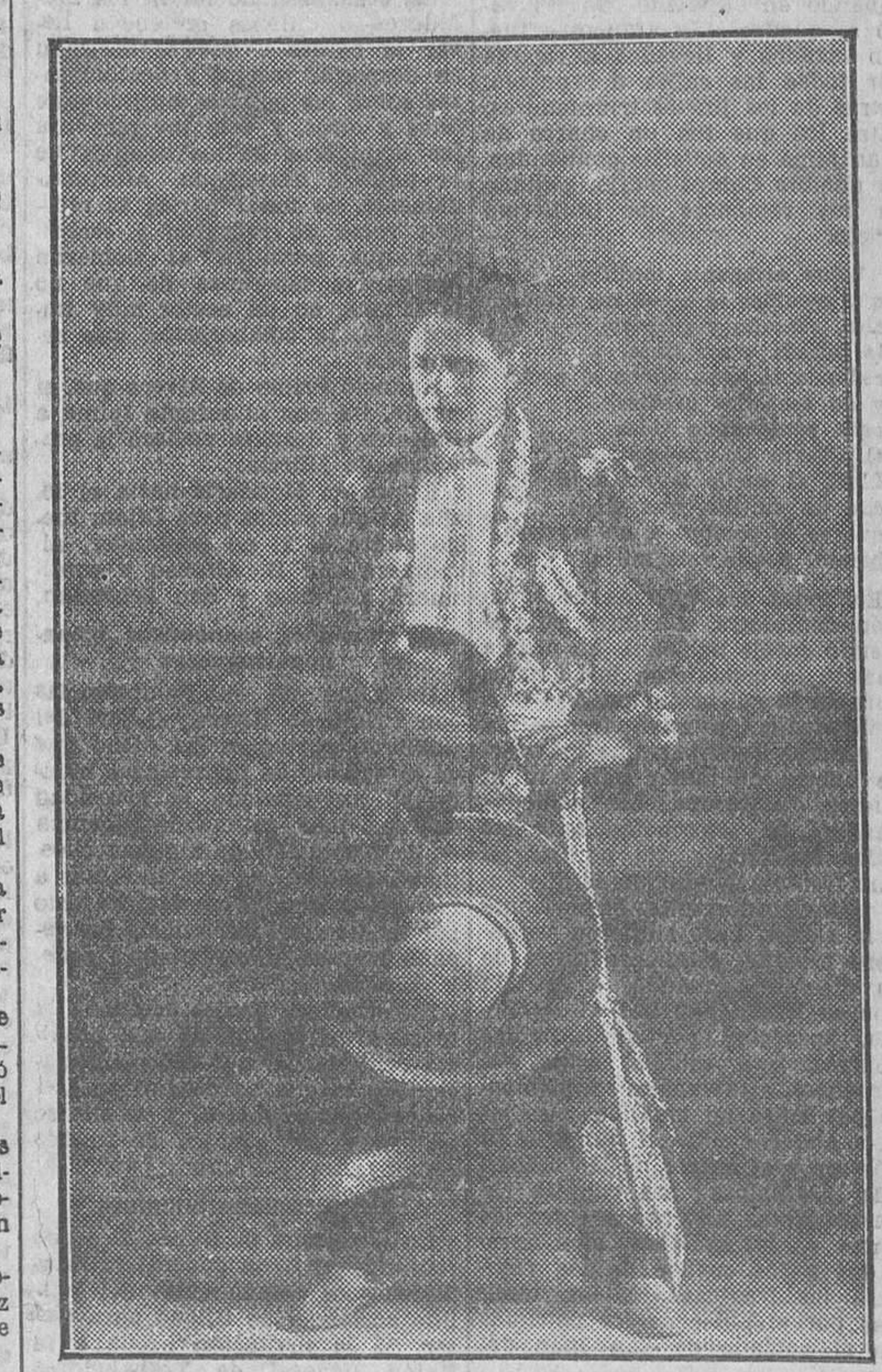
Un charro mejicano

Es cosa sabida que el charro tiene su cuna en tierras de Salamanca. Pero a medida que va entre nosotros cayendo en los campos florece fríamente en los campos de Méjico. El charro tenía que venir a menos con la pérdida de nuestras colonias.