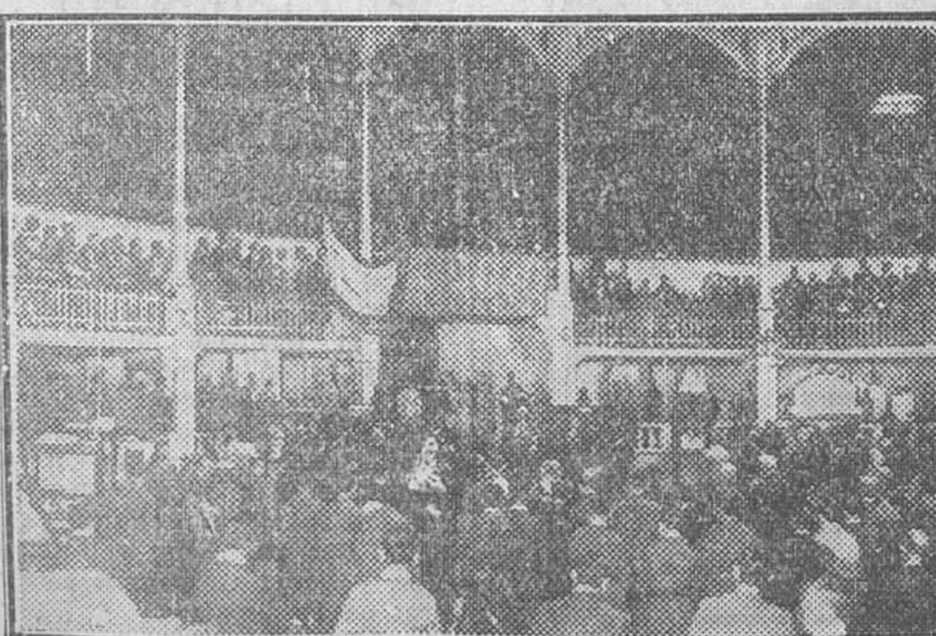
GIJÓN.—Inauguración de la Feria de Muestras