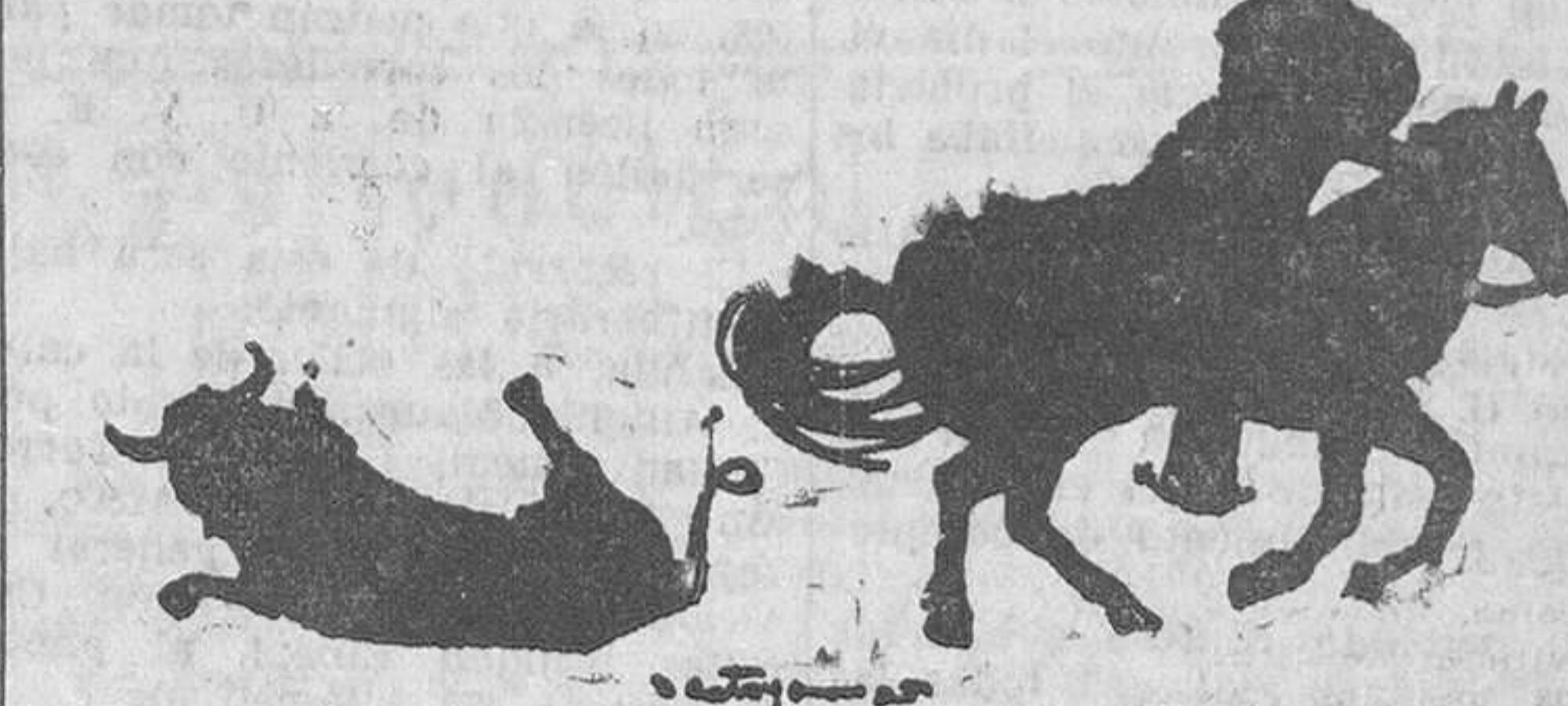
La suerte de «colears», con el derribo del toro