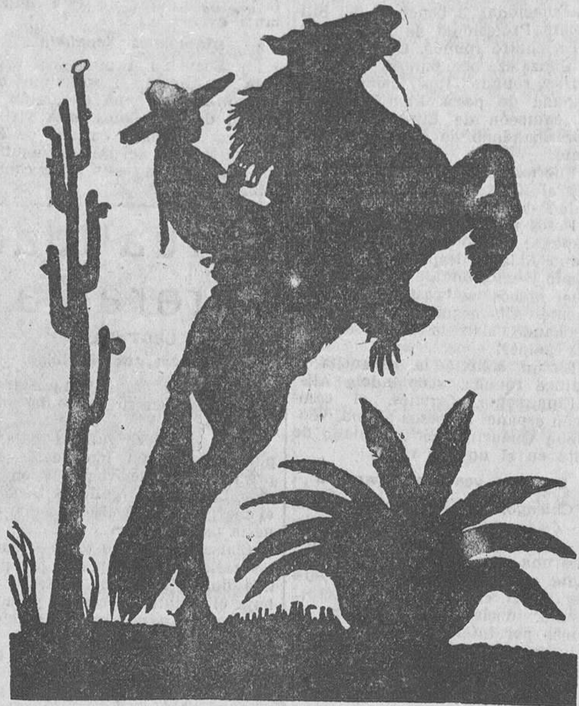
Siluetas de un charro en el jaripeo