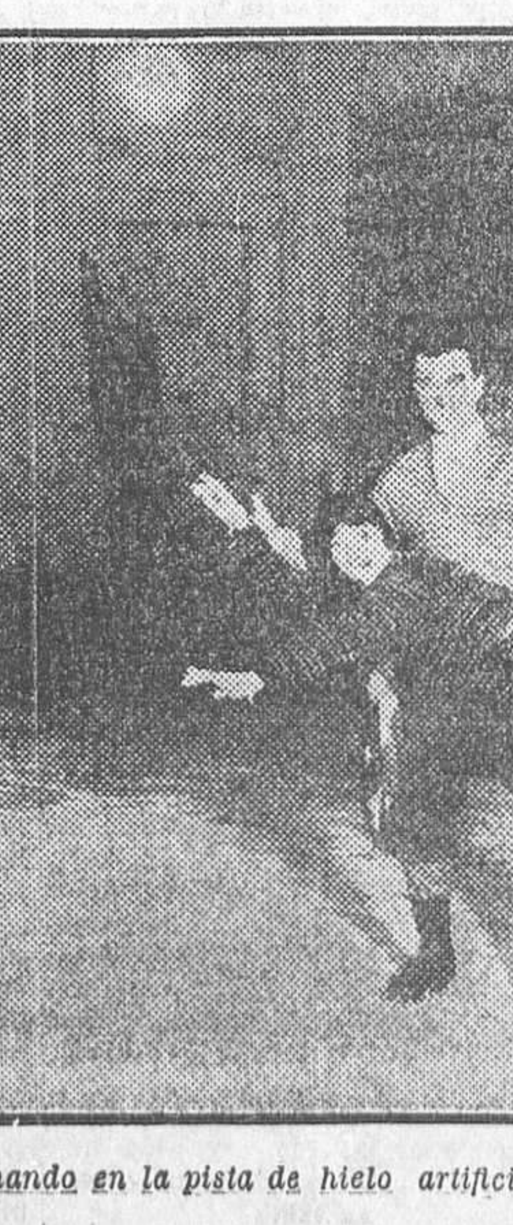
PARIS.—Patinando en la pista de hielo artificial del Grand Palais

El selecto público aplaudió muchísimo al maestro y a los discípulos, que tan grata y brillantemente desempeñaron sus respectivos papeles.