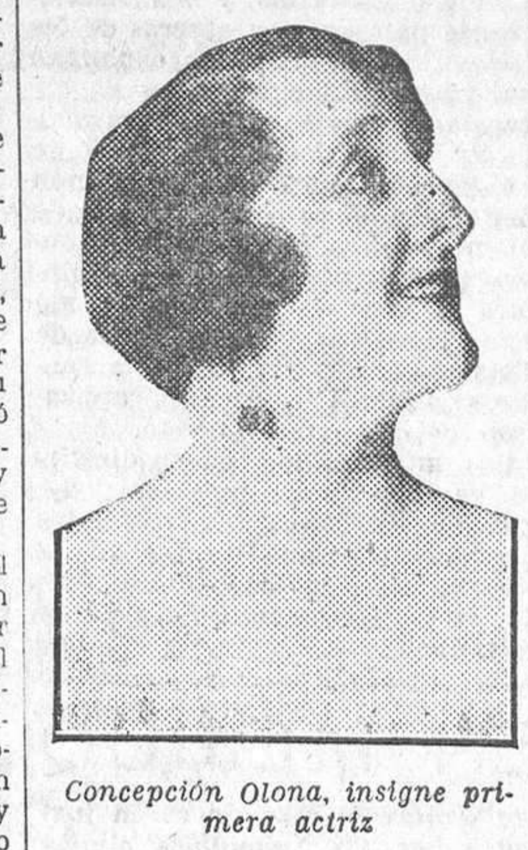
Concepción Olona, insigne primera actriz

Estas líneas bastan para hacer una presentación en regla, y para que todos sepan a qué atenerse con relación a la ilustre personalidad que va a visitar nuestra amada patria.