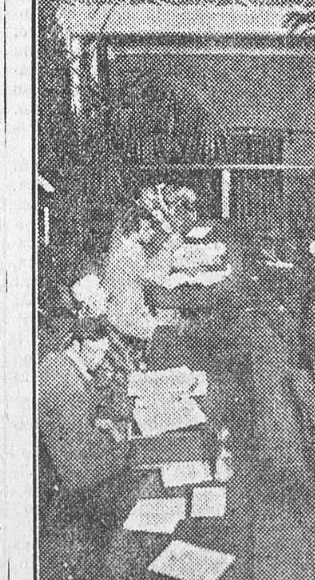
El delegado inglés Henderson pronunciando un discurso en el Congreso Internacional Socialista que actualmente se celebra en Bruselas