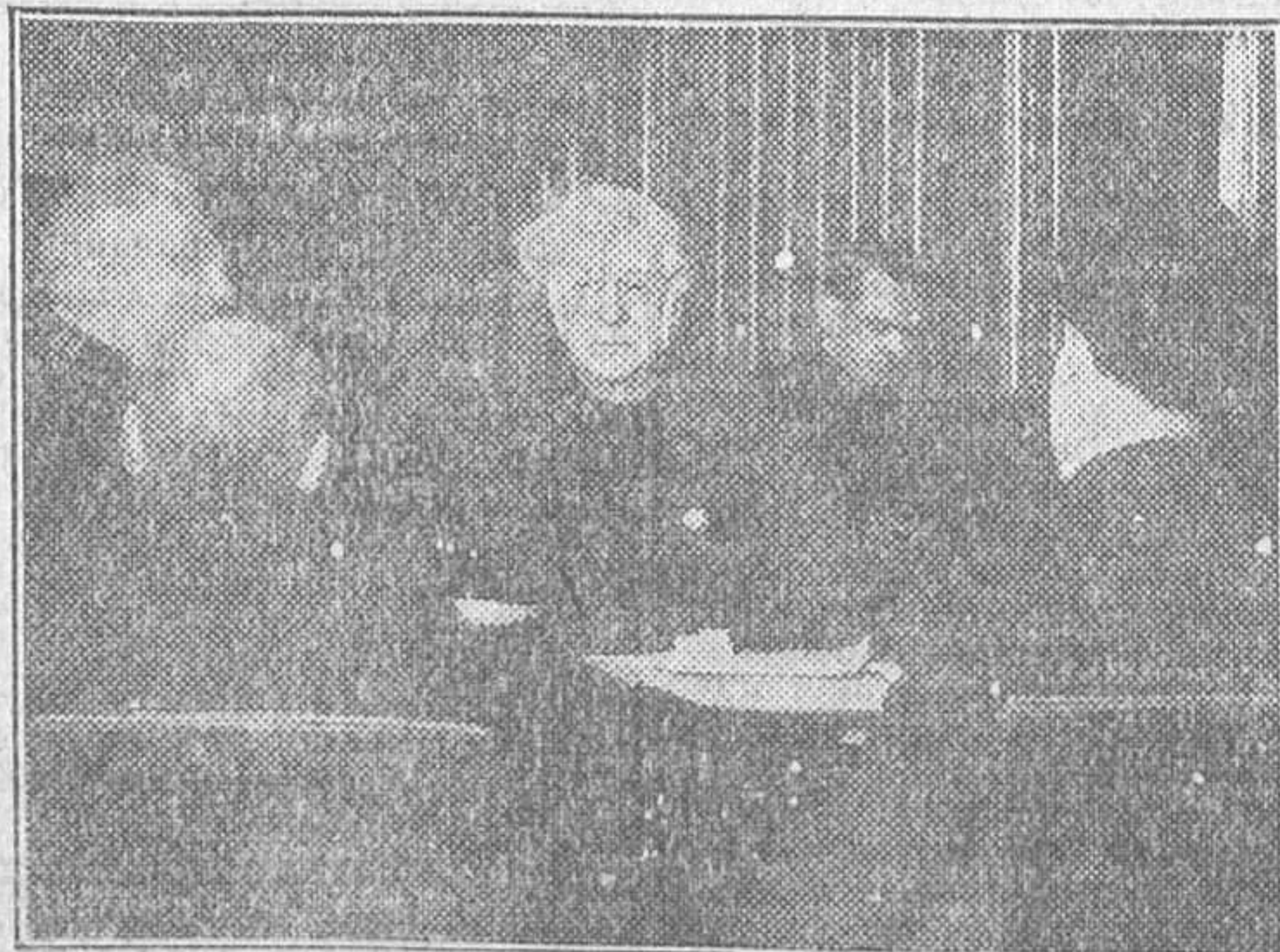
El general del Ejército de Sarracín, Mr. Boothé, recibe a la Prensa en el Hotel Continental, de París

Los bomberos trabajaron con su habitual pericia, y en veinticinco minutos lograron localizar y extinguir el fuego.