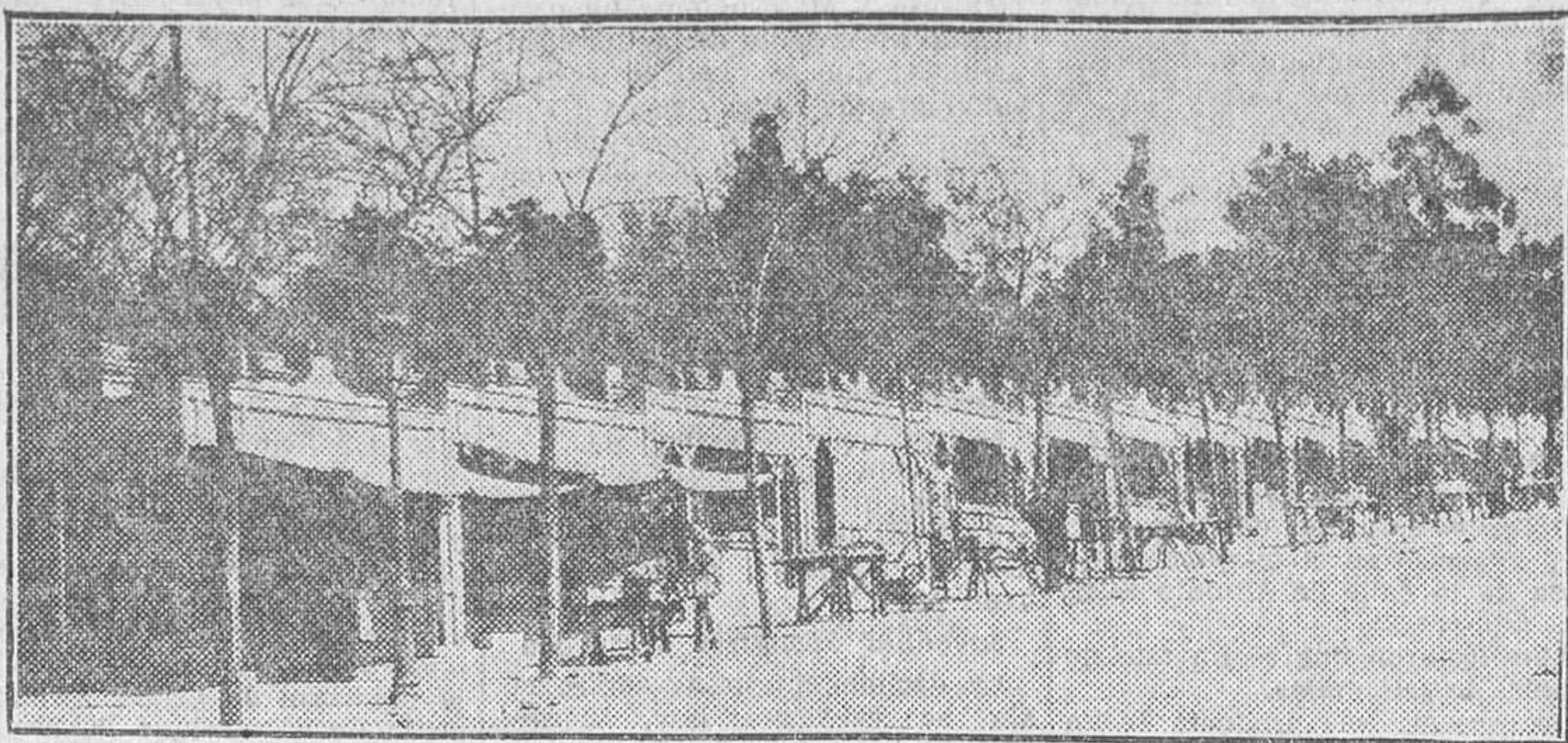
La Feria de libros en las afueras de Madrid

Es necesario que el puesto del librero le salga al paso al transeúnte, en el corazón de la ciudad, y le pida, como Don Quijote a los mercaderes, un punto de la rodilla—, sus ordinarios, sus picaros, sus golfantes... Cosa turbia, pronisucua. De fondo, la tierra negra del campo llano; y allá, en lo último que alcanza la mi-