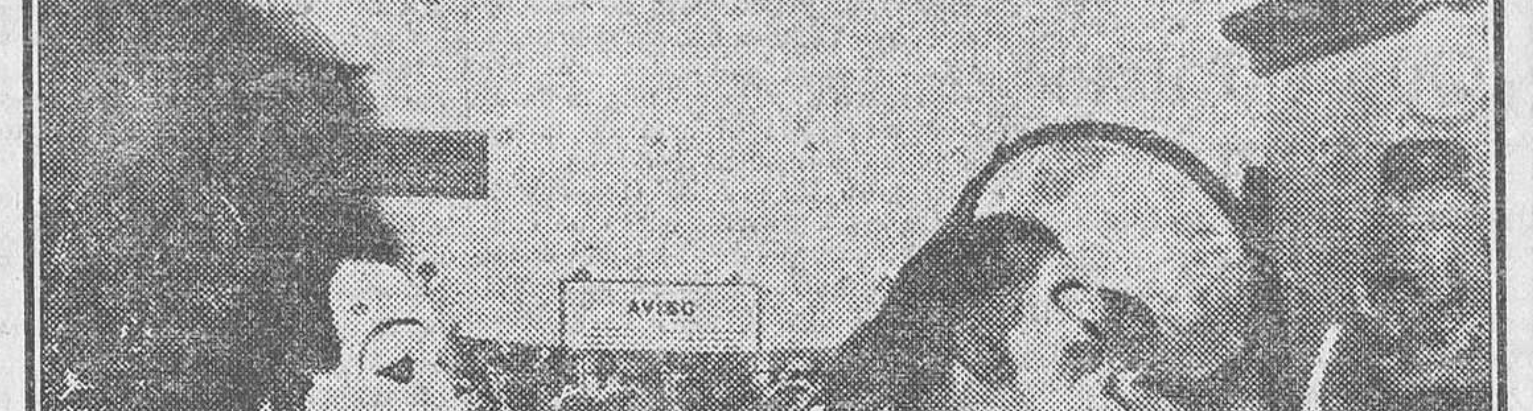
Pompo y Thedy, los populares payasos españoles, caracterizándose antes de salir a la pista del Circo de Price.

En Valencia se encontraron los dos hermanos. Pero, ¡oh, desencantado!