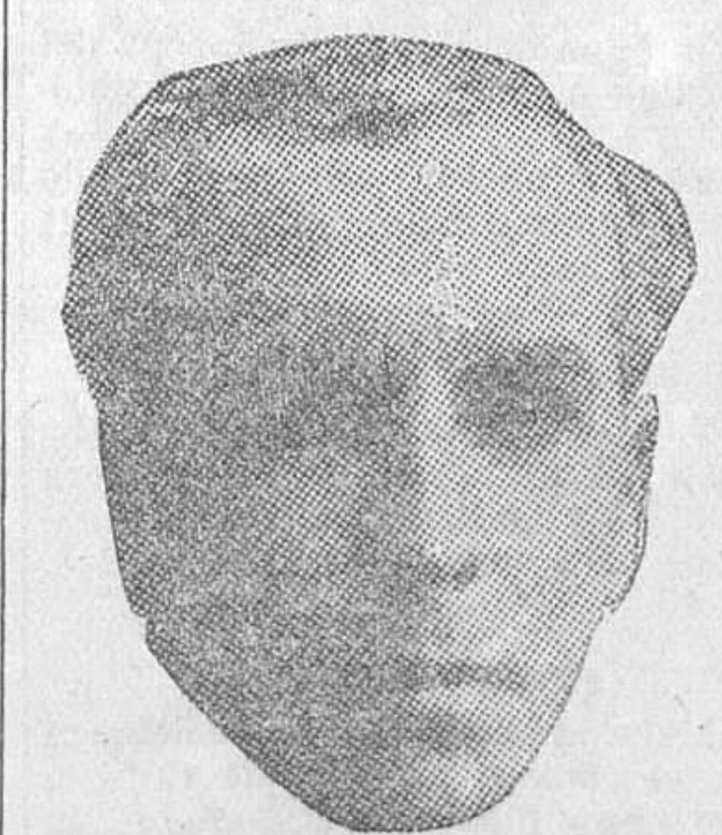
El gran escritor Eduardo Zamacois, que acaba de publicar una hermosa novela—"Las raíces"—, primera de una serie que ha de ofrecer al público. De la importancia de "Las raíces" juzgarán nuestros lectores por el capítulo que insertaremos en nuestra próxima página dedicada al Libro

En "De vivir", escenas y emociones de la vida de los leprosos en Parcent, aparece por vez primera ese andariego lento y bueno, un poco tímido, vivificador estremecido de cuanto mira, que se llama Sigüenza, y para el lector avisado podría llamarse, muchas veces, Miró. Si se es amigo de observaciones nobles, este libro—por voluntad de su autor, primero—, nos depara el placer de observar cómo se va ampliando