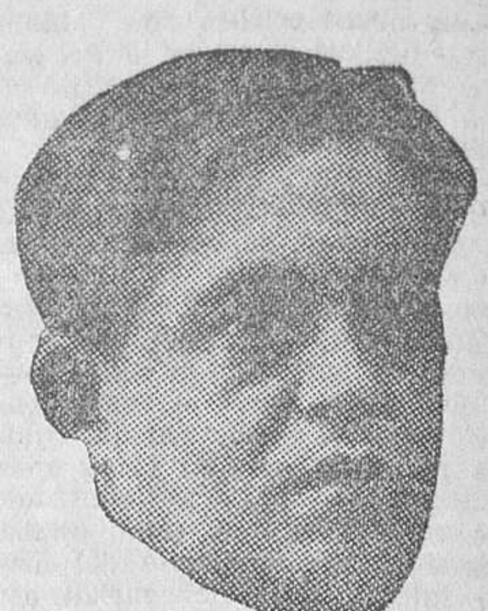
El notabilísimo escritor Diego San José, autor del nuevo libro "El abogado del diablo", brevario histórico de la vida de Felipe II, que está obteniendo un gran éxito