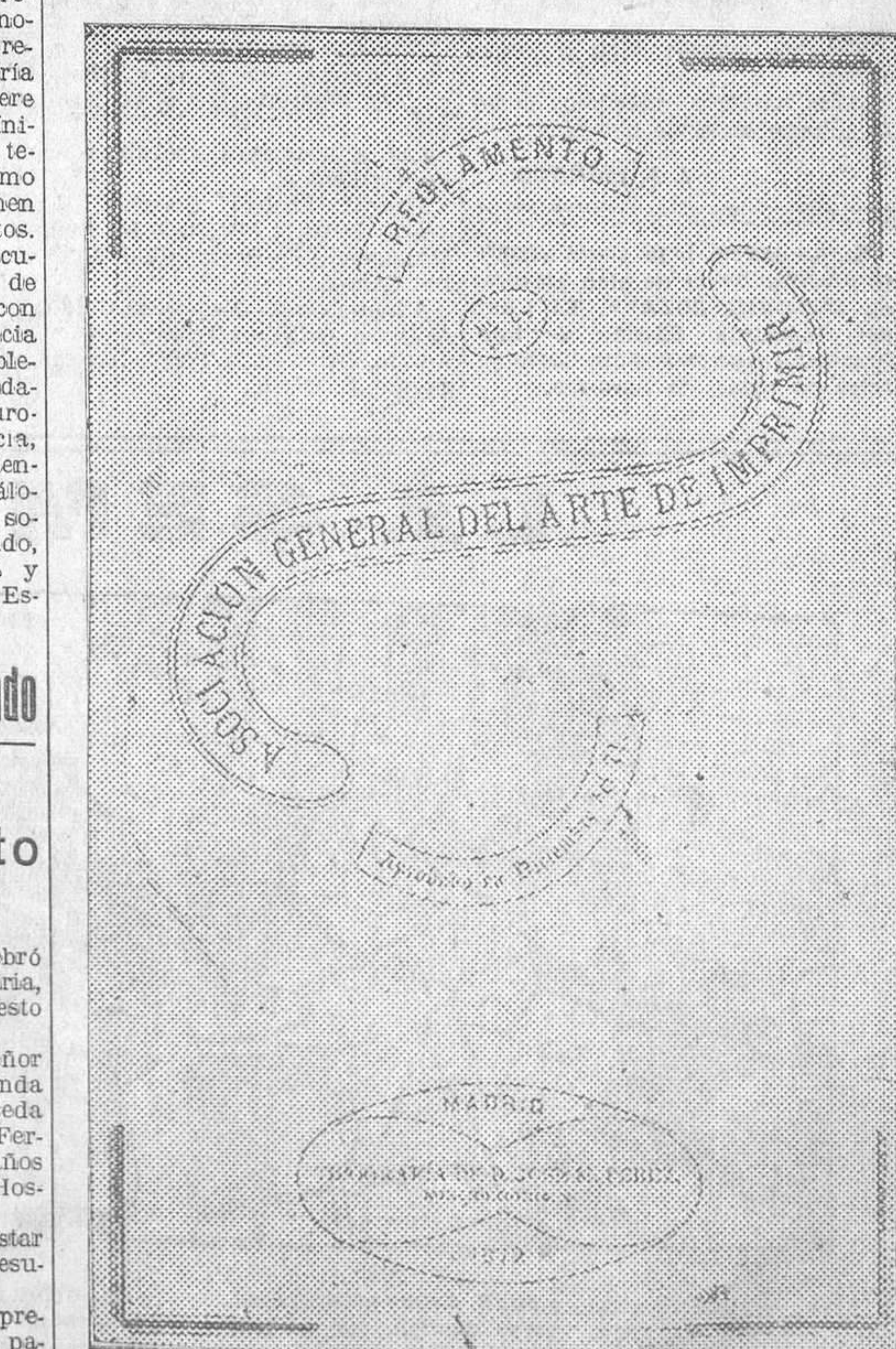
Cubierta del primer reglamento y de la lista de fundadores de la Asociación General del Arte de Imprimir