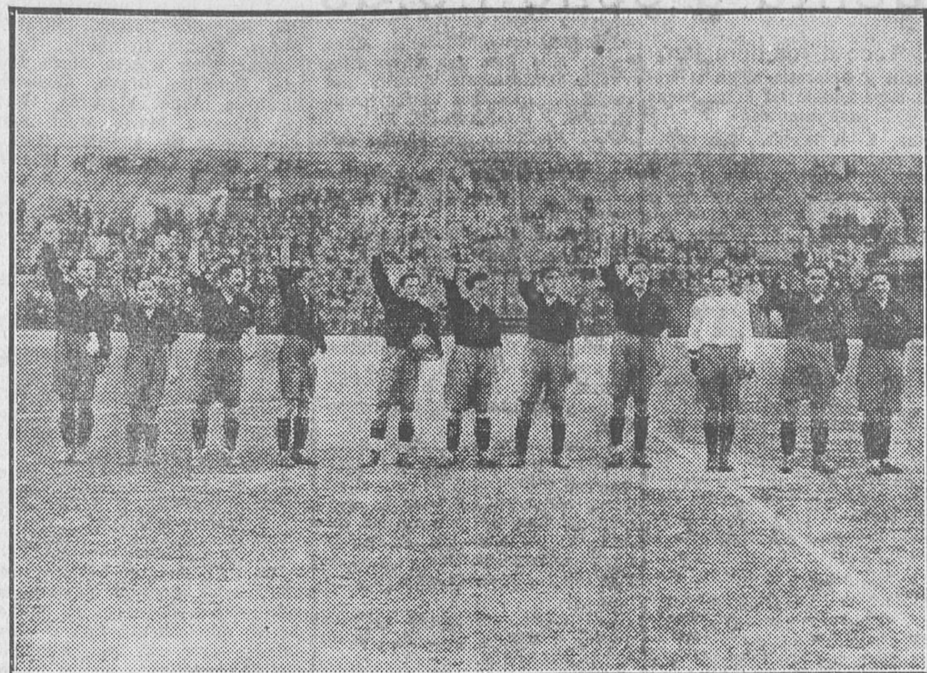
DE LA OLIMPIADA.—El equipo español que venció al de Méjico