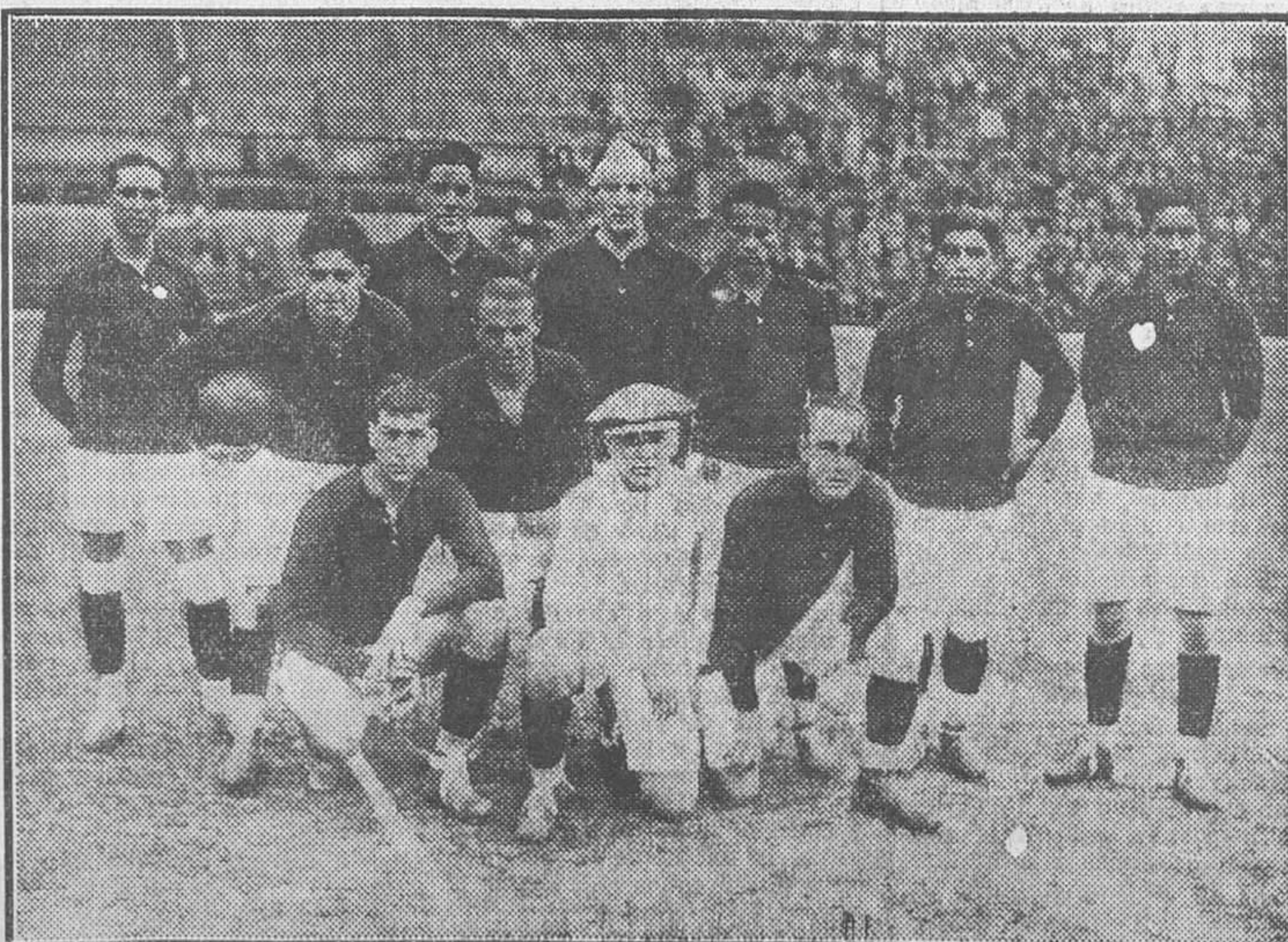
DE LA OLIMPIADA.—El equipo mejicano que fué vencido por los españoles

Los mejores fueron Orsi, Tarasconi, Carribarri, Orlandini, de los argentinos, y Moeschal y el defensa izquierdo de los belgas.