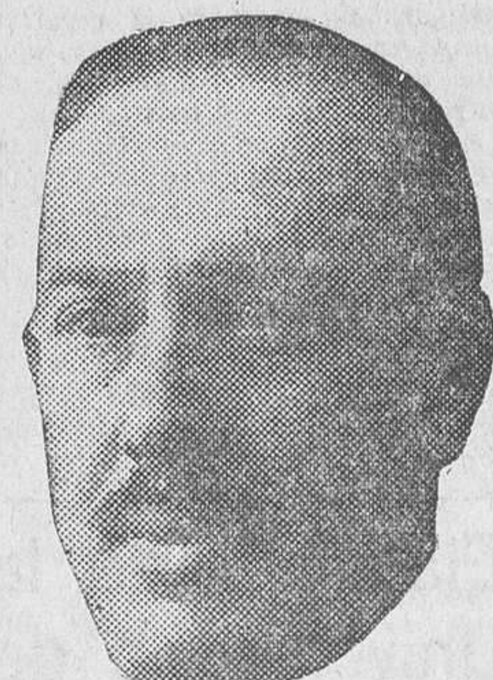
El insigne poeta Manuel Machado

magníficos episodios. Con su traza personalísima, él pintó la vida de su tierra en notas armónicas, reflejadas en aquel rancho de maravilla que se evoca en «La tem-