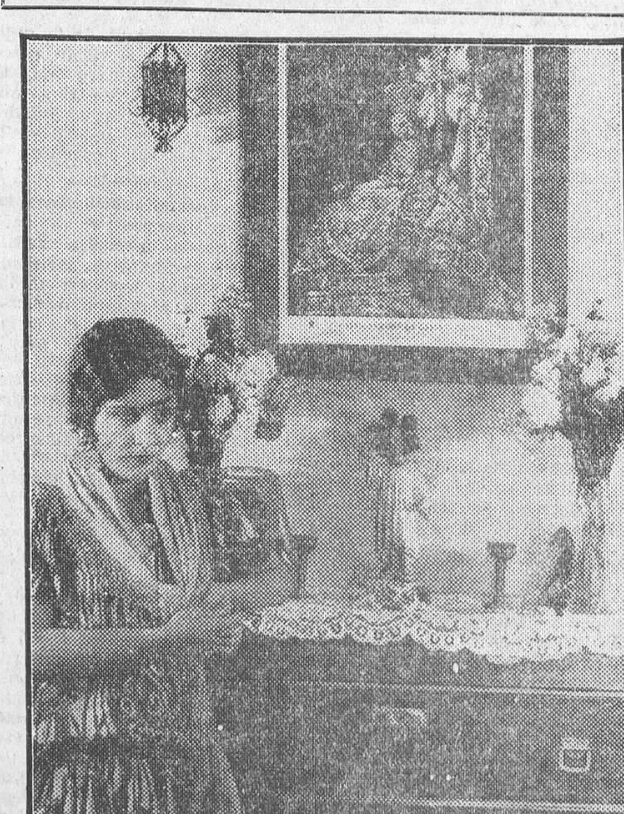
LA APLAUDIDA CANTONISTA Y BAILARINA IMPERIO ARGENTINA EN UNA ESCENA DE «LOS CLAVELES DE LA VIRGEN», CINTA QUE EL LUNES REPRISA EL CINE MADRID