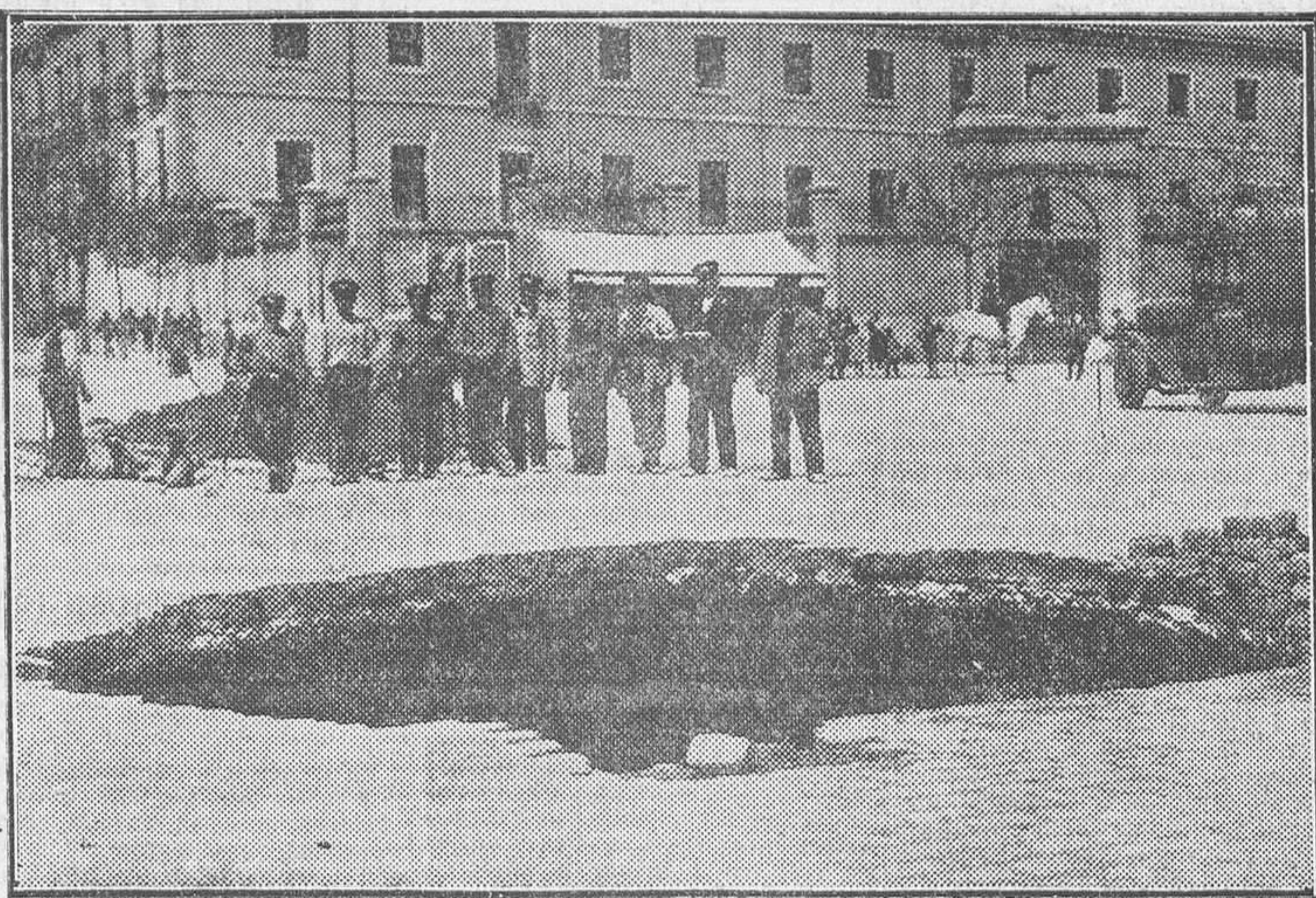
El boquete abierto en el pavimento por la explosión de gas que se produjo ayer en el Portillo de Embajadores

En unas obras que se realizan por parte de obreros del Canal de Isabel II y de la Fábrica del Gas en la misma glorieta de Embajadores ocurrió ayer por la mañana una tremenda explosión, que sembró la alarma en toda aquella populosa barriada.