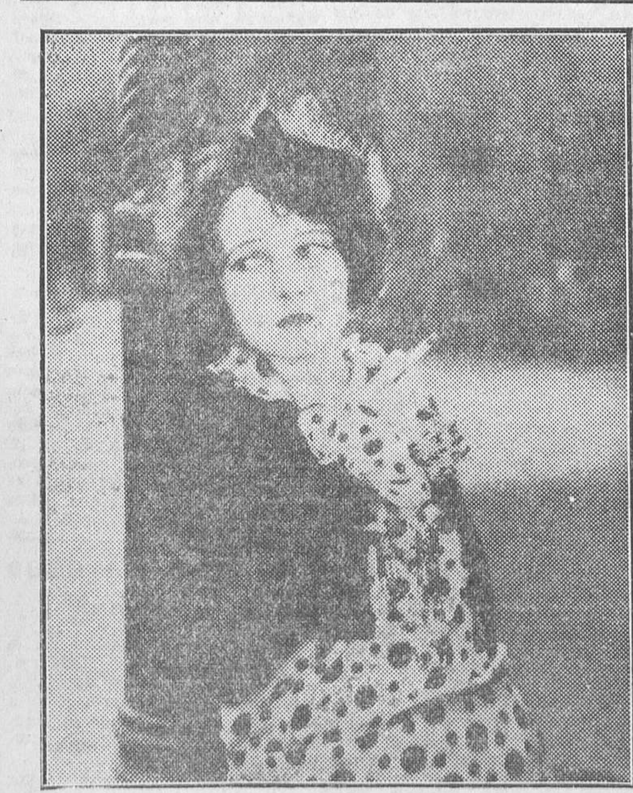
LA ADMIRADA ESTRELLA CORINNE GRIFFITH, PROTAGONISTA DE «LA DAMA DEL ARMIÑO», PELICULA QUE EL LUNES SE ESTRENA EN EL CALLAO

¡Anunciante! Utilice para sus pequeños anuncios la sección de palabras de LA LIBERTAD. Le proporcionará, con la mayor economía, el resultado apetecido. ¡Solo 10 céntimos cada una, sin limitación!