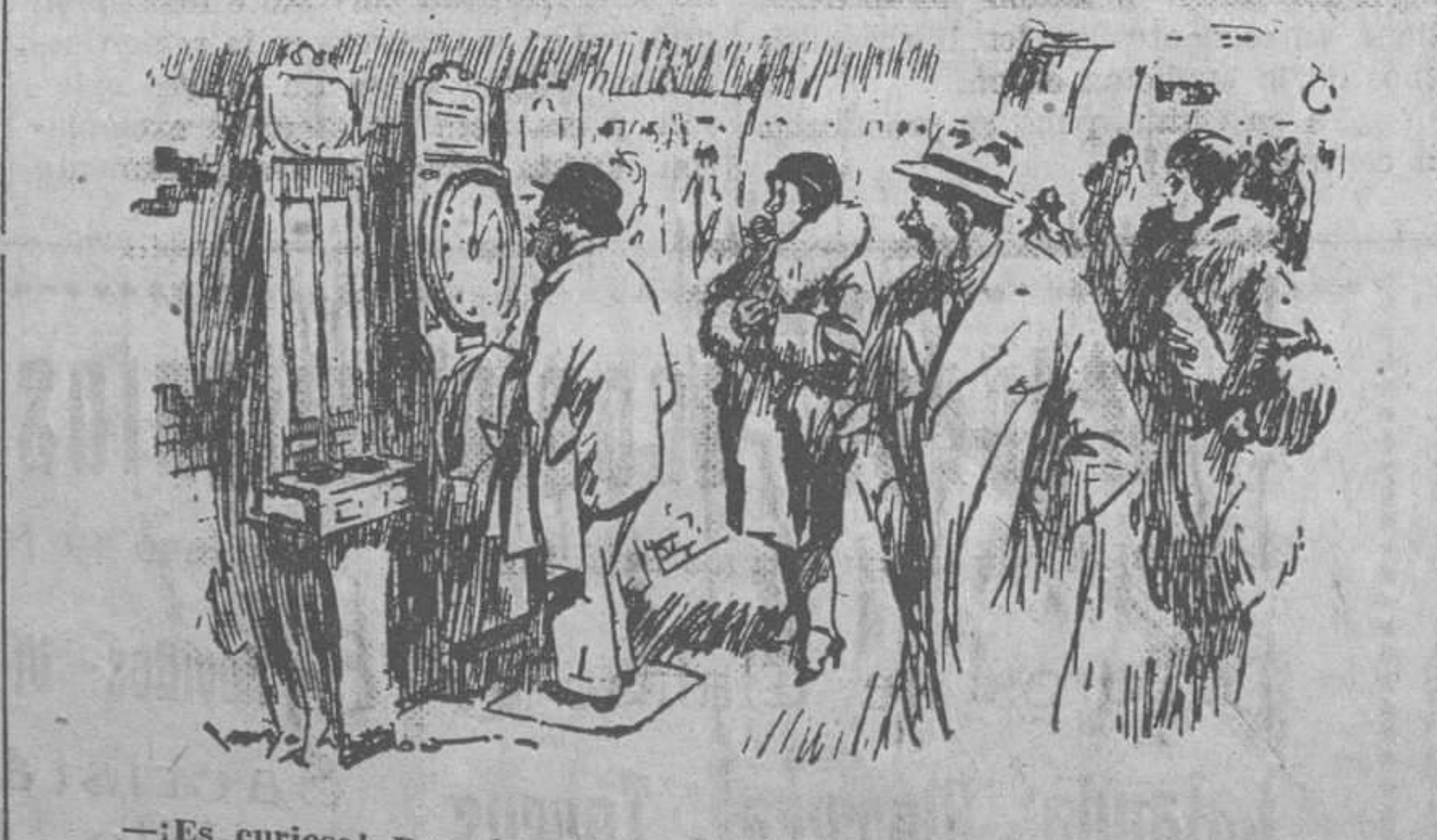
«Es curioso! Peso igual con el gabán puesto que con el gabán al brazo»

Hoy marchará a Madrid para ver a su familia.