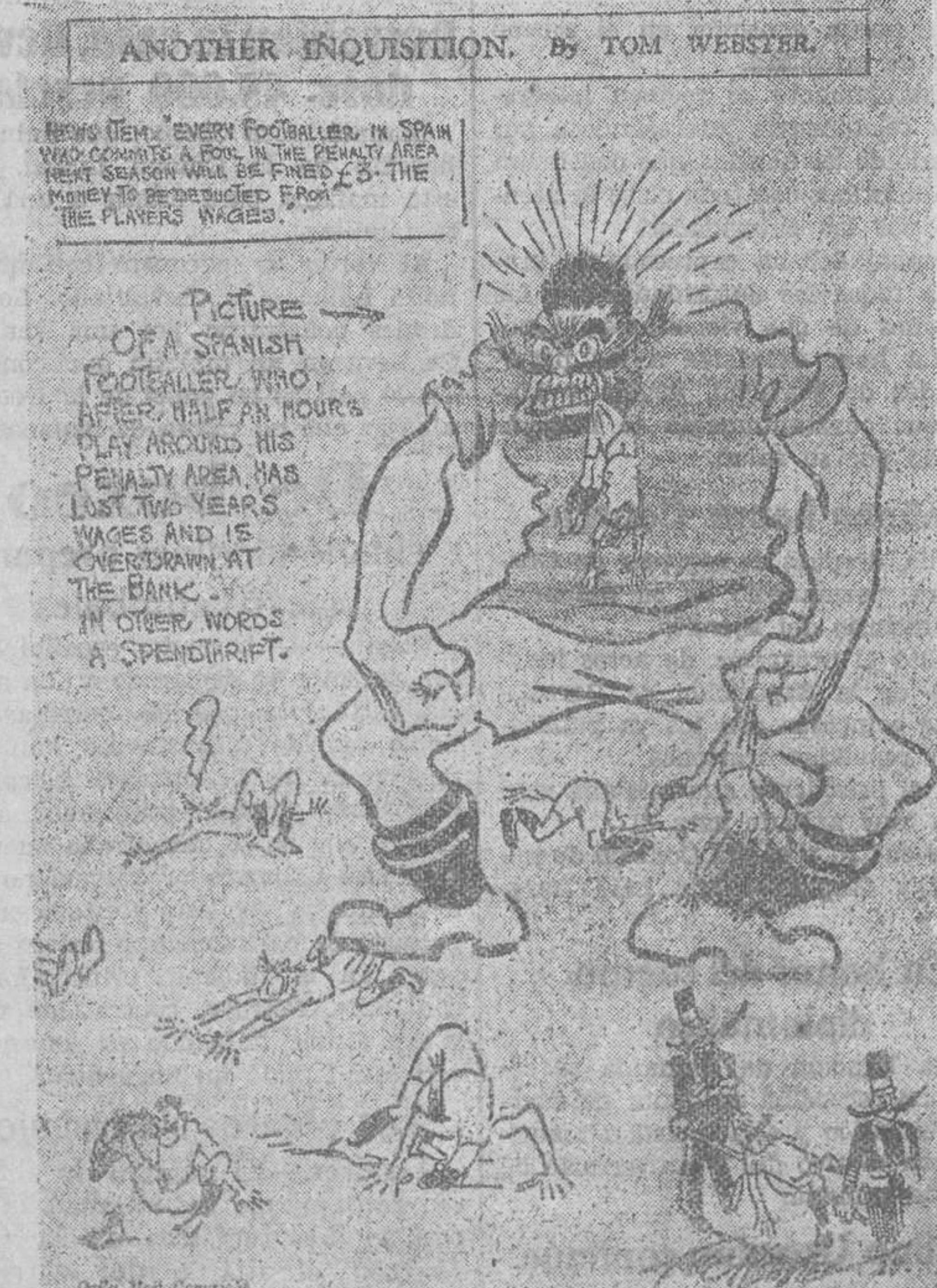
COMO PINTAN LOS INGLESES LA FURIA ESPAÑOLA

Londres.—El «Times» dice que según noticias oficiales sobre la situación en Kwangtung, el avance de las fuerzas de Kwangsi a través de Samsui ha sido detenido a causa de la defección de la retaguardia y por la invasión de las tropas de Hnan en el Norte de Kwangsi. Cantón no se considera ya inmediatamente amenazado y actualmente se envían refuerzos desde el Yangtsé.