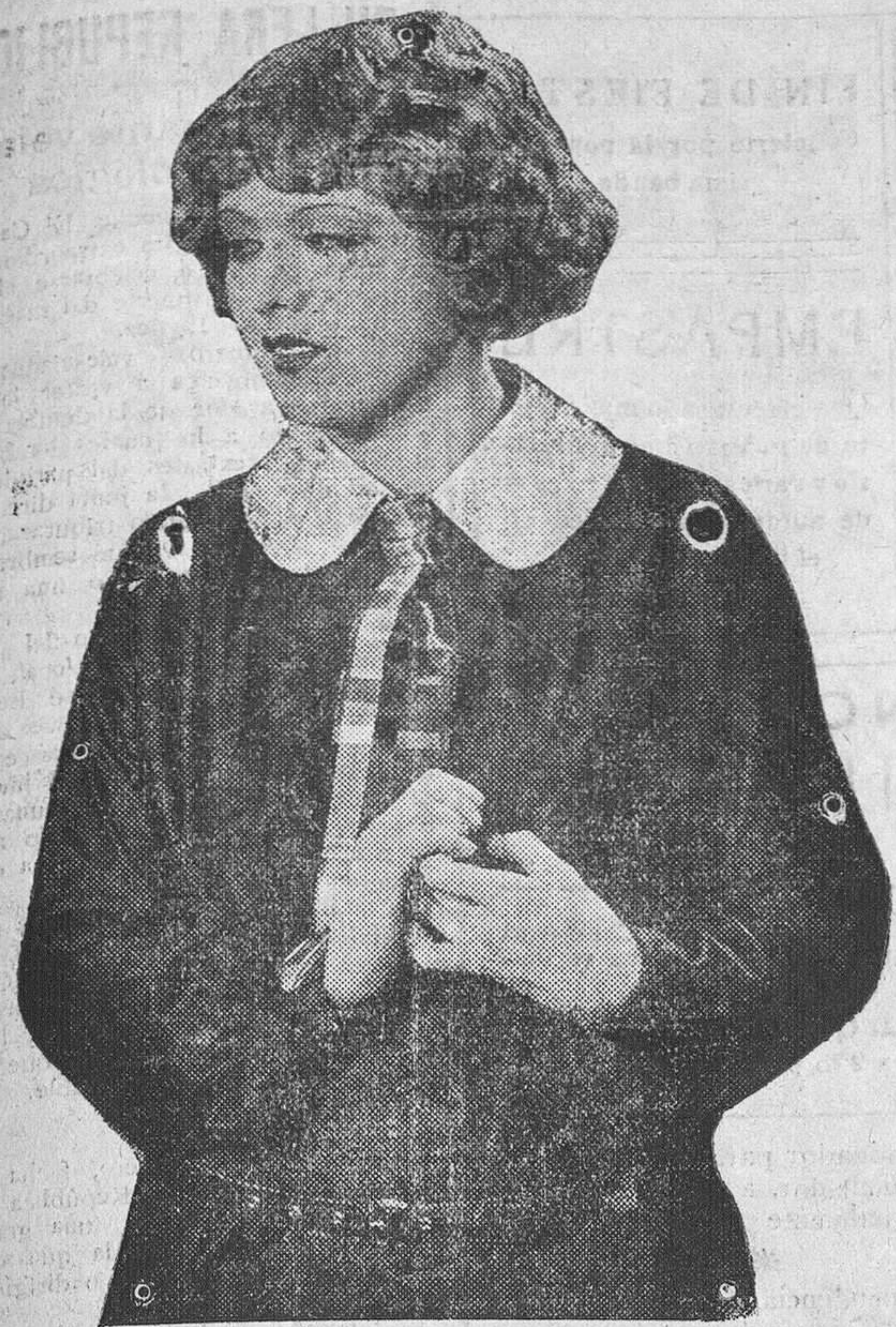
ANNY ONDRA, la saladisima intérprete de 'ZUZY SAXOFON'.