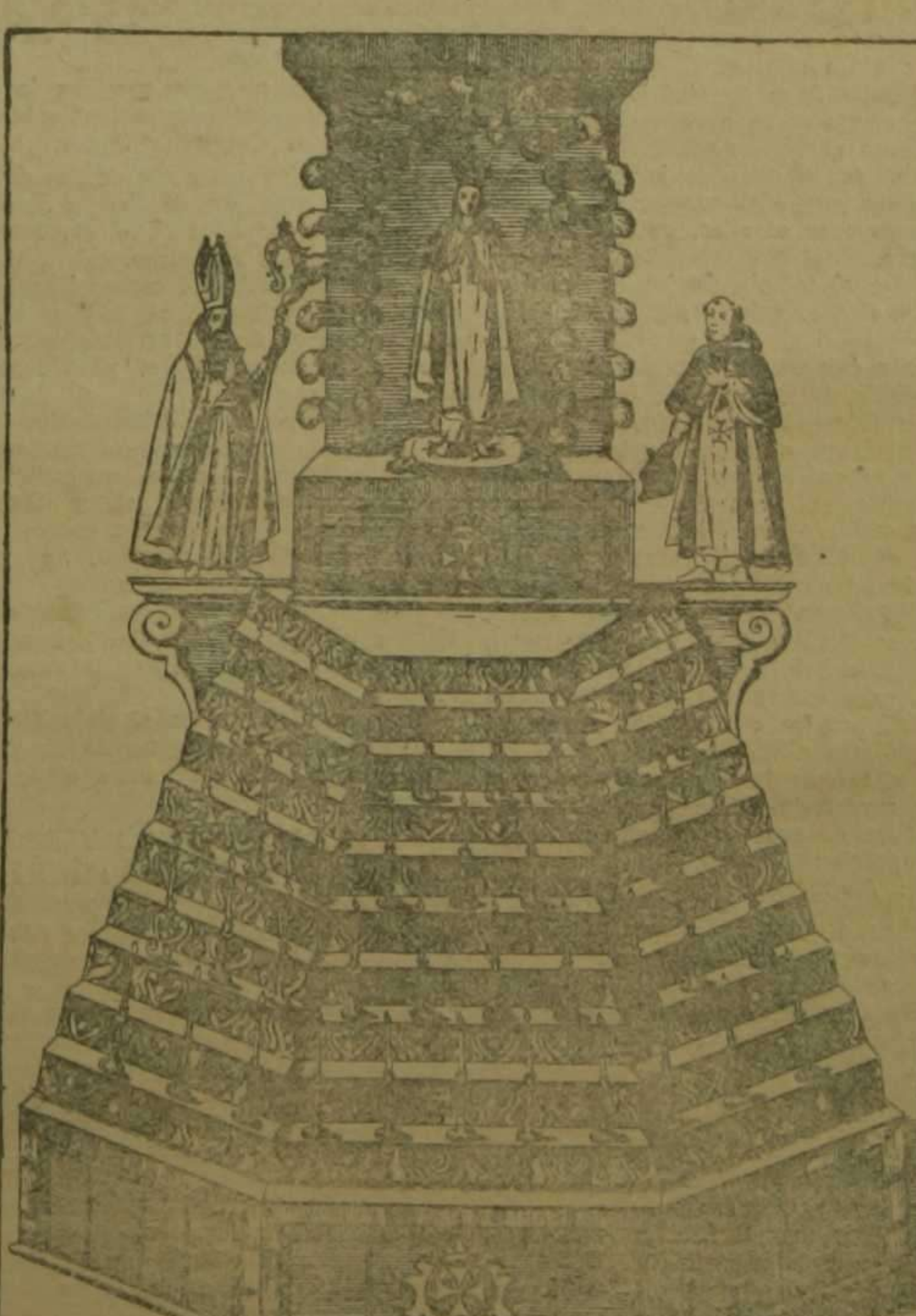
Altar del Convento del Remedio, de religiosos Trinitarios.