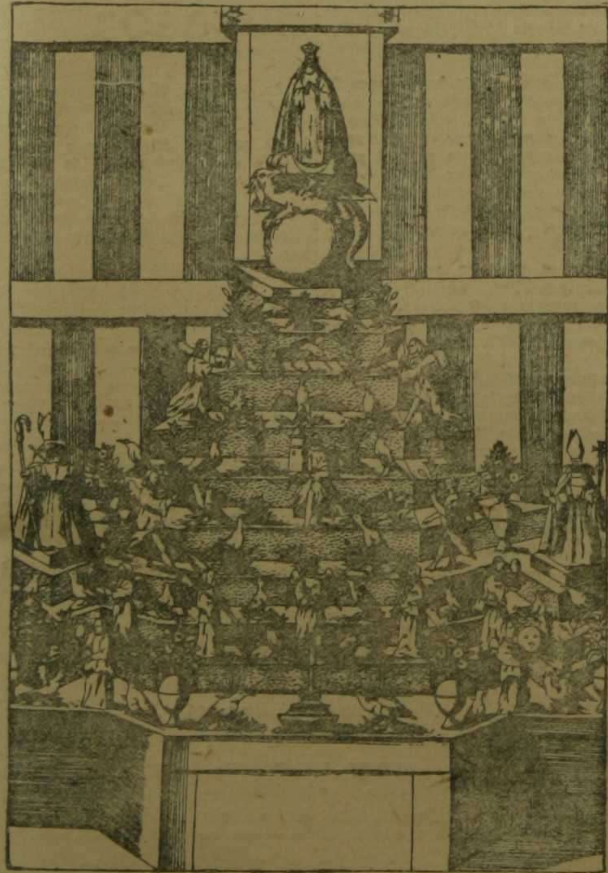
Altar del Convento del Socorro, de religiosos Agustinos

Ternera lechal Todos los días en la carnicería de ARAIX, plaza de las Hierbas, junto a la calle del Trench.