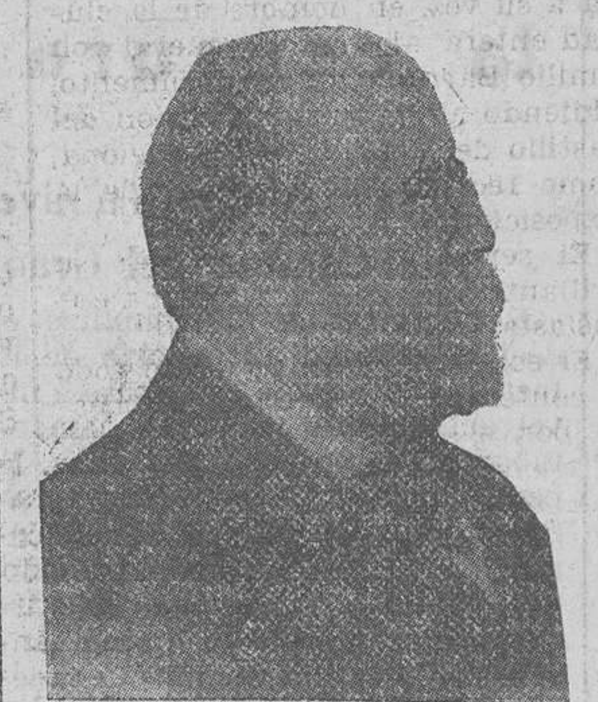
Teodoro Llorente, el poeta premiado con la Flor Natural

«Lagartijo (decía el diestro granadino) es el más grande de los toreros».