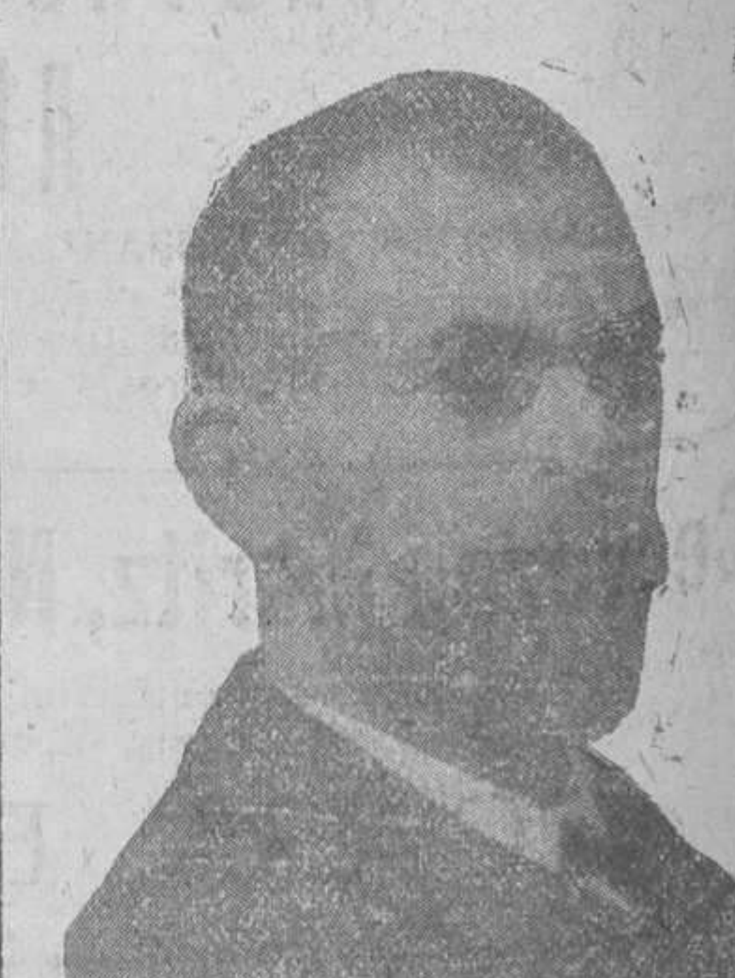
Constantino Llombart, fundador de «Lo Rat-Penat»