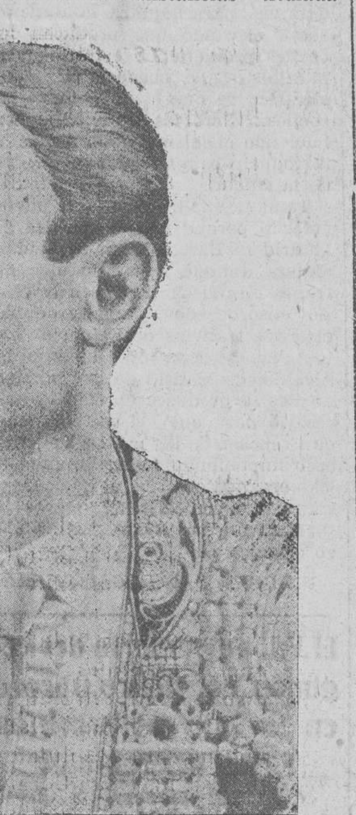
Rafael Molina «Lagartijo»

Tuvo mayor resonancia el Festival Musical celebrado en el Skating-Ring. La empresa, de acuerdo con la Sociedad de Conciertos, dispuso la solemnidad para la noche del 26. Tomaron parte en el concierto 250 ejecutantes entre coros, coros y banda, interpretándose la «Marcha fúnebre» de Gounod, gran éxito y repetida; la obra de Salvador Giner, una cantata de circunstancias titulada