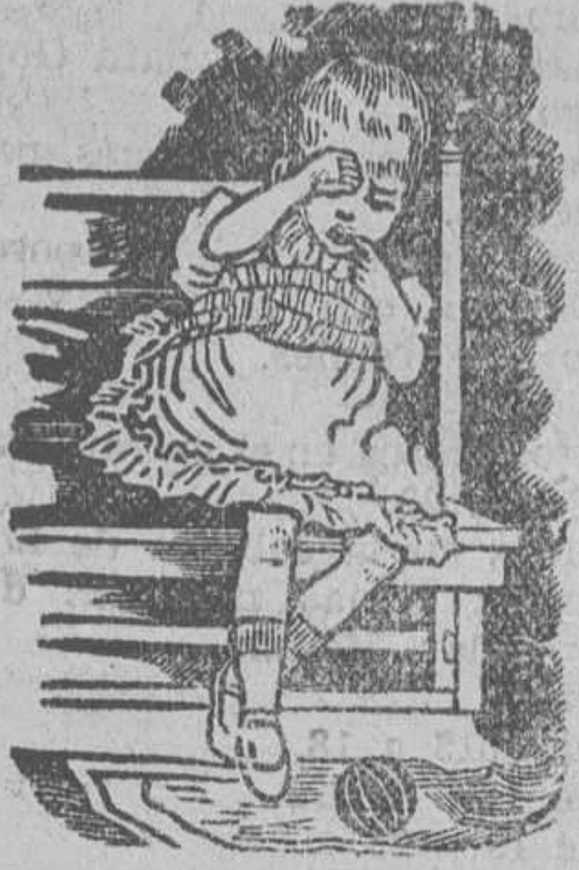
Antes de tomar la DENTINA