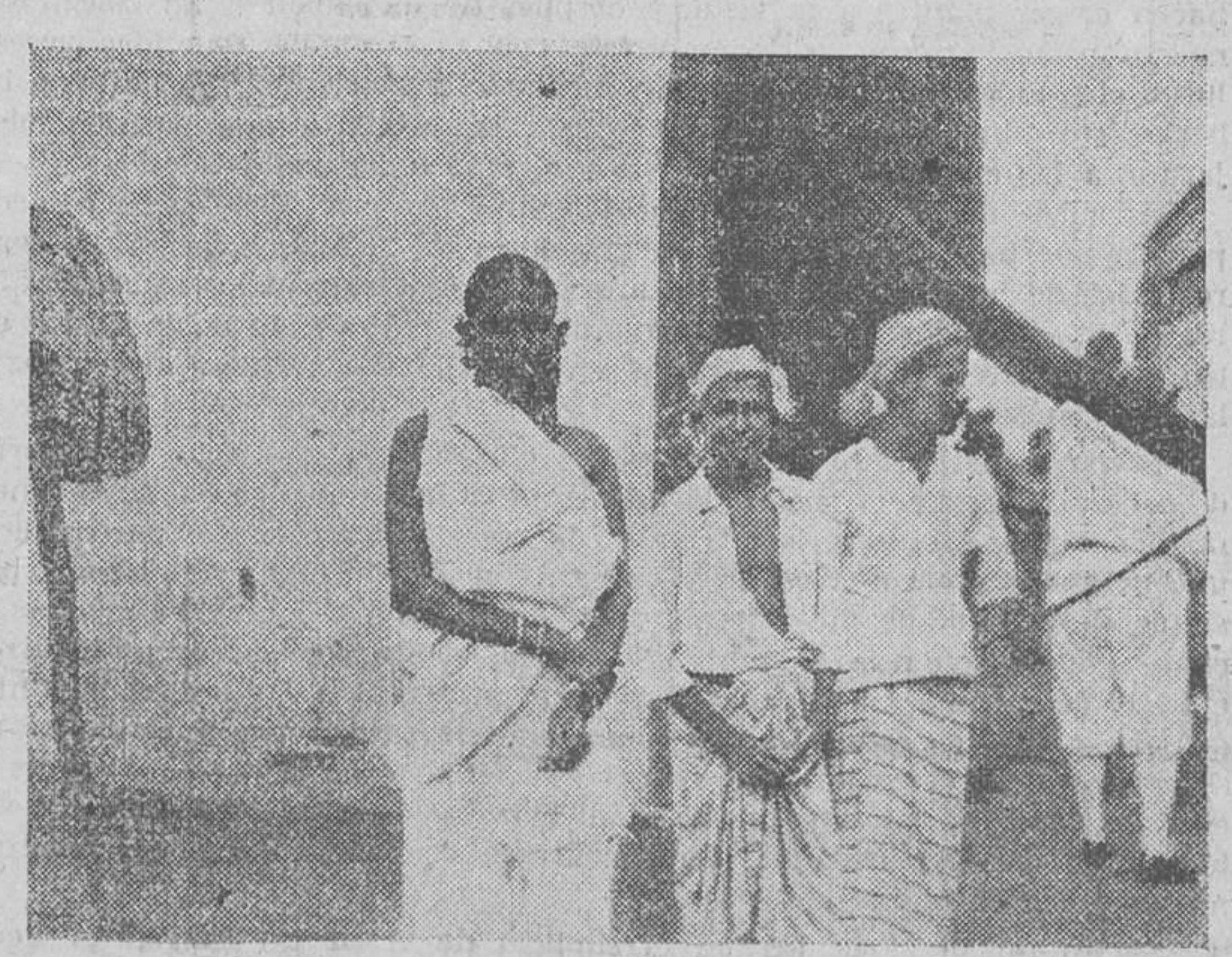
Ceylan: Tipos de Kaudy