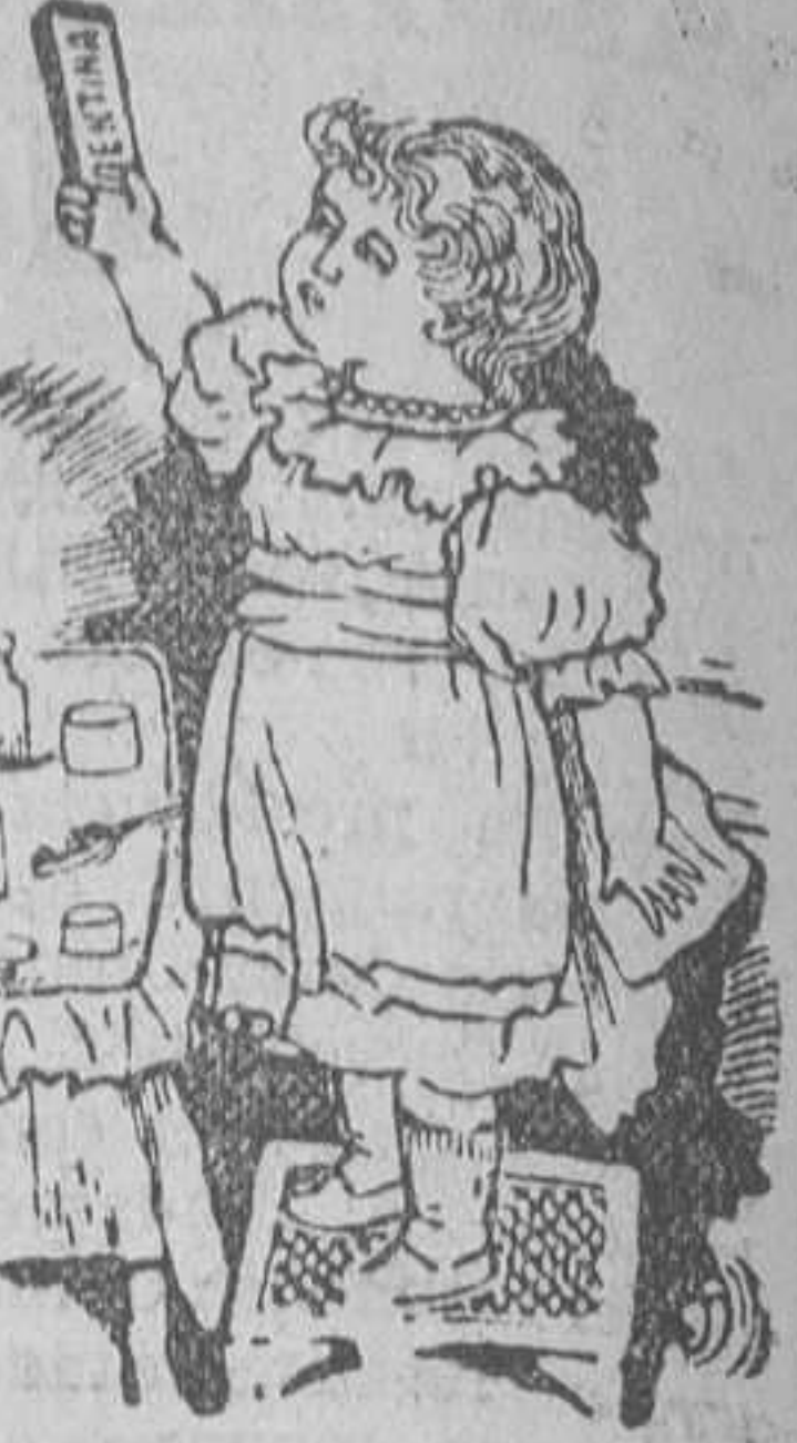
Después de tomar la DENTINA

Laboratorio y farmacia Cañizares, calle de Caballeros, número 47, Valencia