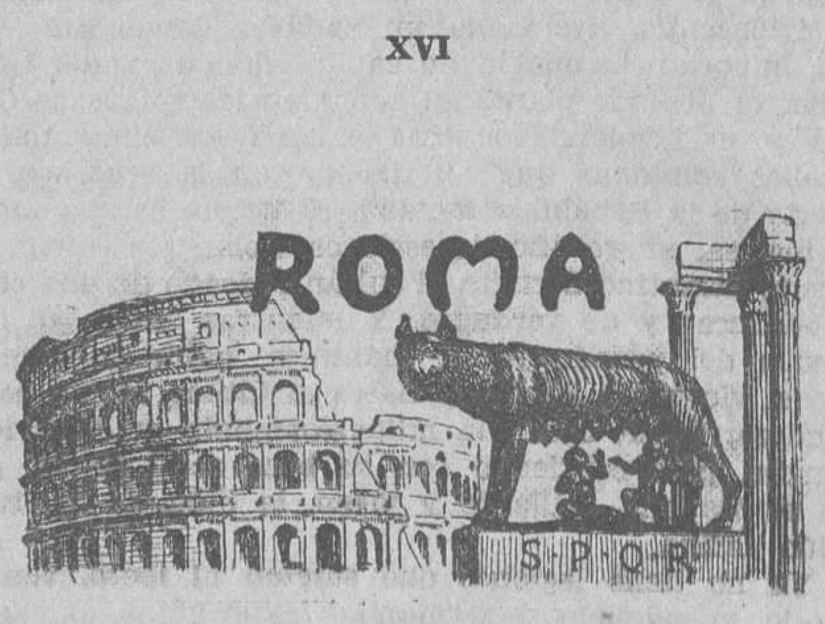
XVI ROMA LA CIUDAD ETERNA

Dominó el mundo. Sus emperadores, con una simple señal, ponían la tierra en conmoción desde el Ganges a las columnas de Hércules. Aquí fué una realidad durante siglos la soñada monarquía universal. Por eso se comprende que pudiera surgir, como formado con las cenizas de los antiguos Césares, un Gregorio VII, audaz, duro y belicoso, que quiso convertir la tiara pontificia en diadema del imperio terráqueo. Por eso también subsiste aquí el Papado, que si no es señor del suelo de las naciones, posee el poderío sobre las almas y legisla despóticamente, sin apelación, para muchos millones de seres extendidos por todo el globo. Tiene como ejército negras legiones, que batallan por él lo mismo en las naciones de Europa que en el interior de América o en las islas de la Océania. De allí llegan antiguos ejércitos, pasan entusiasmadas bajo las arcadas de San Pedro, depositando el botín de sus enormes limosnas. Naciste para señora del mundo, ¡oh, ciudad inmortal! Cambiaste de forma exterior con el incesante va-