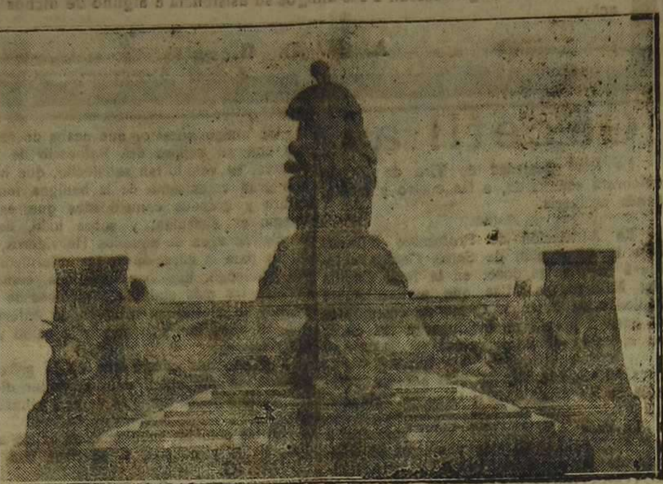
Grandioso monumento en honor del insigne "Apóstol del Obrero", el venerable Bosco, levantado en Turín (Italia) por los antiguos alumnos salesianos de todas las naciones