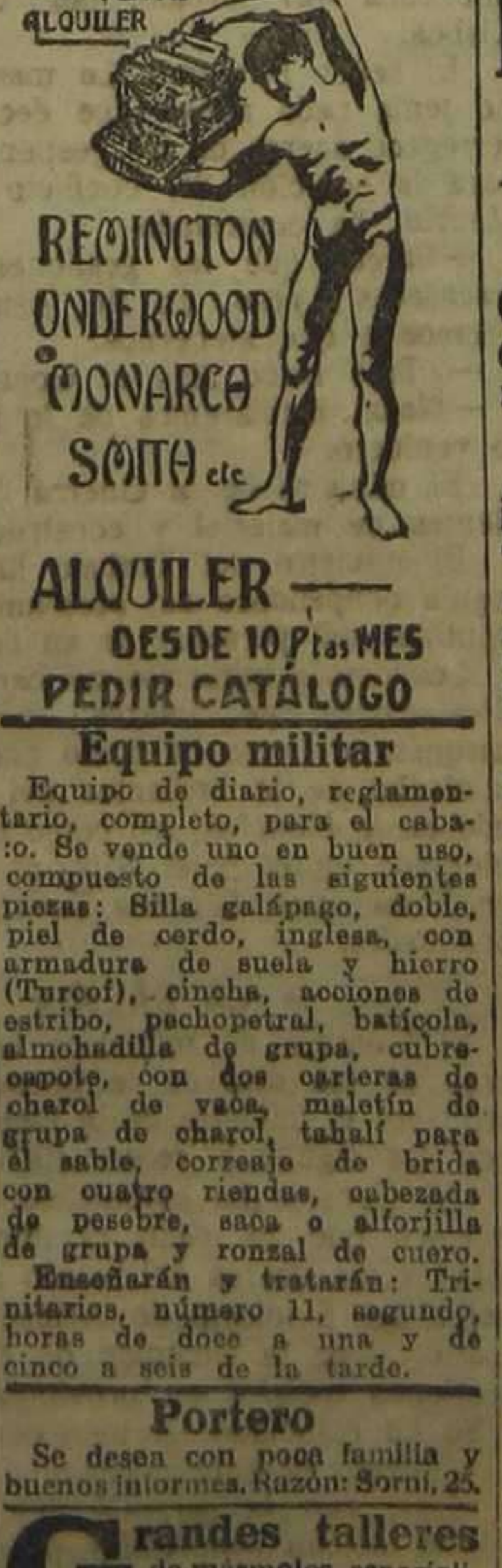
ALQUILER DESDE 10 Ptas. MES PEDIR CATALOGO

Se alquila para almacenar en la calle de Ribot, 23.