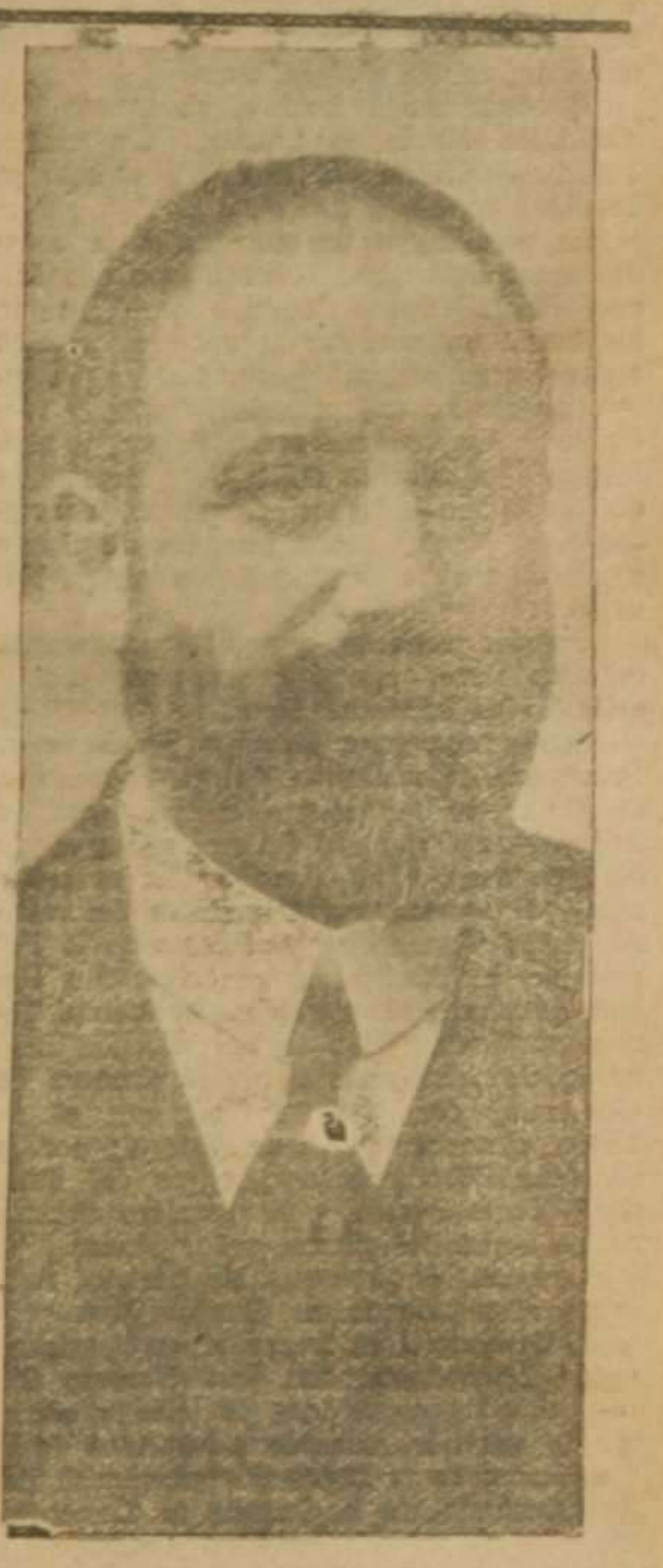
Excmo. Sr. D. Elias Tormo y Monzó cuyo discurso leído ayer tarde, insertamos en tercera página.—(Foto. Cardona).

Acuerdos sobre honorarios tomados en la reunión celebrada anoche por los médicos que ejercen en la capital. 1.º Supresión de los iguales en todo el término municipal de Valencia. 2.º Precio mínimo de la visita, tres pesetas. 3.º Aumentar los honorarios actuales en un 50 por 100 como minimum. 4.º Fijar como jornada ordinaria de trabajo de ocho mañana a ocho noche. 5.º Cualquier aviso al médico fuera de esas horas se considerará como petición de visita extraordinaria. 6.º Horas extraordinarias, de ocho noche a ocho mañana, con precio mínimo de diez pesetas. 7.º Visitas de consulta en casa del médico especialista: como minimum, diez pesetas la primera visita y cinco pesetas las sucesivas.