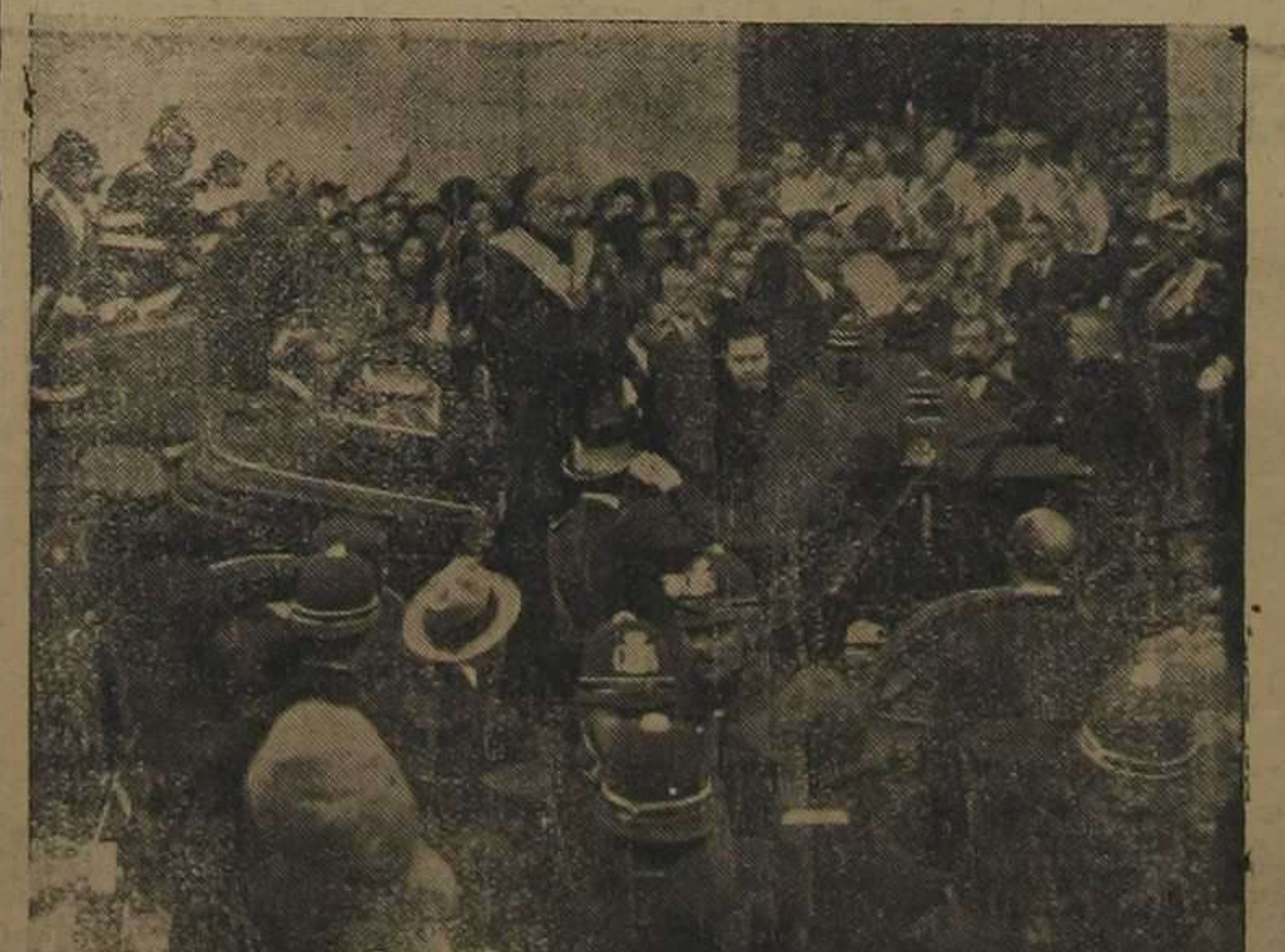
Al llegar tren a Játiva, multitud de señores.