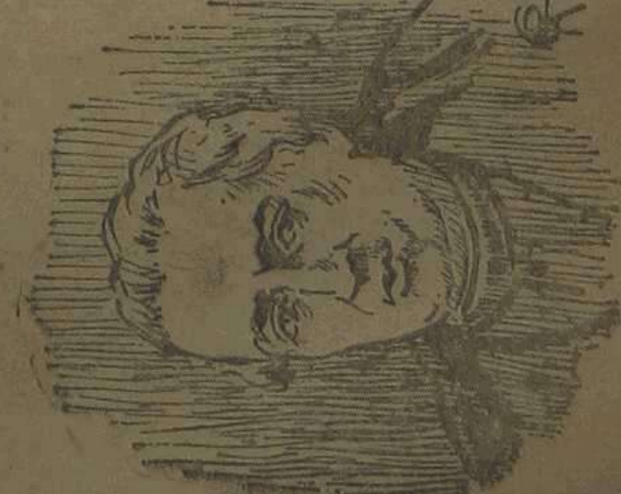
DON JUAN NICASIO GALEA Diputado en las Cortes de Cádiz