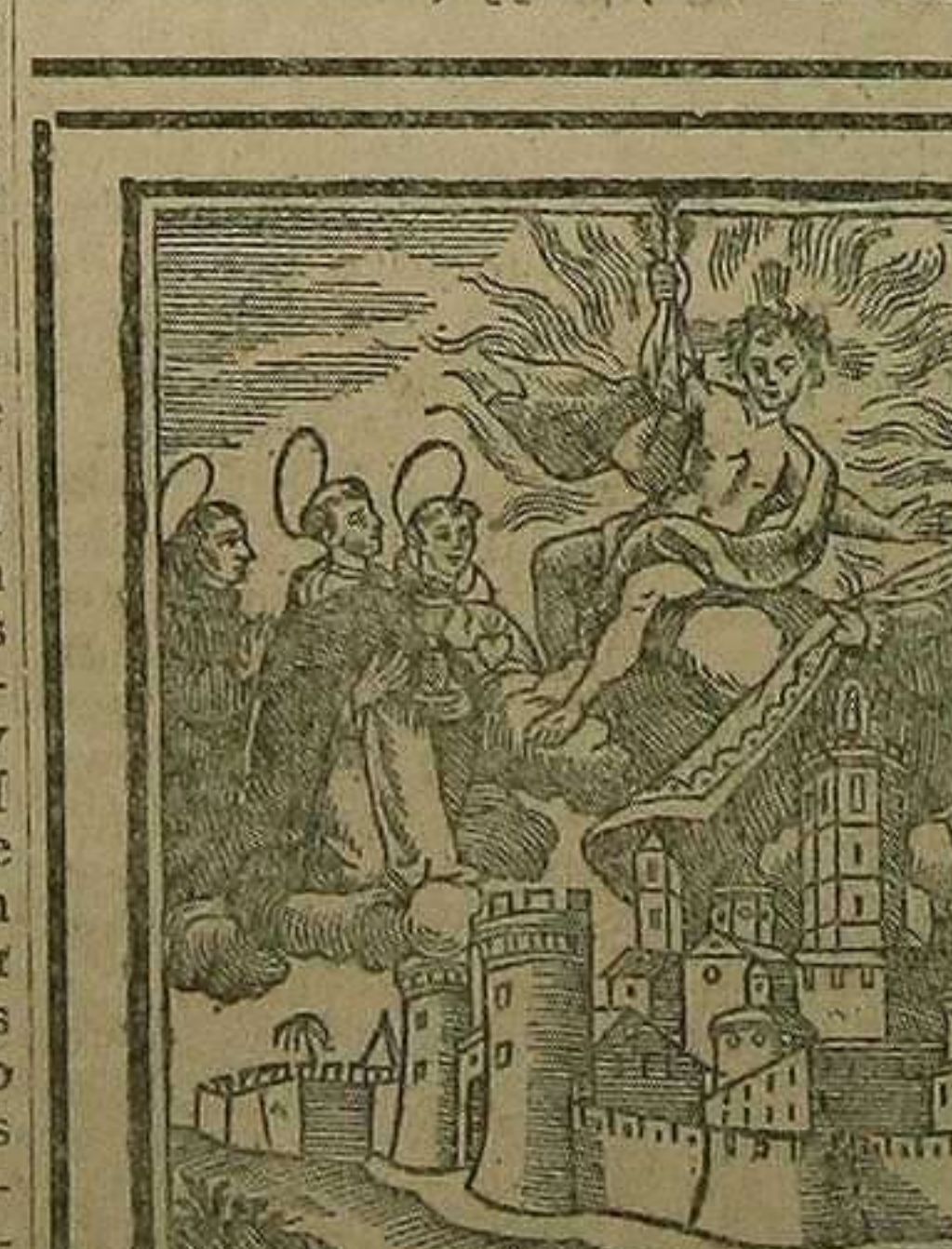
Muestra de los grabados