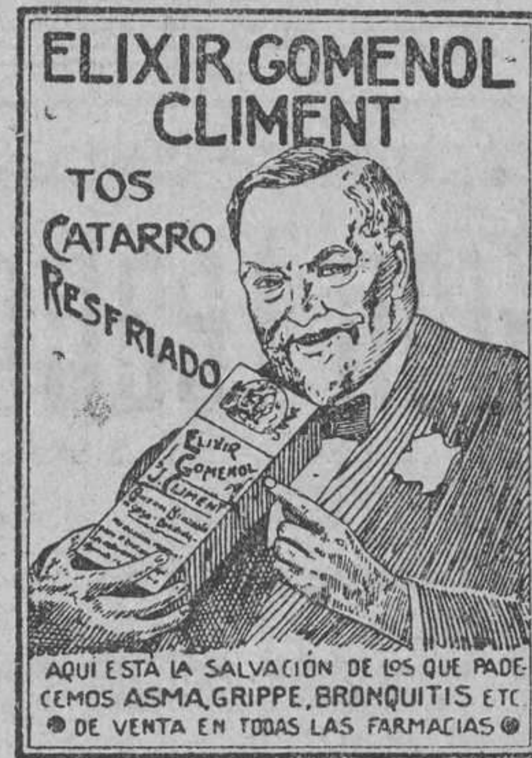
ELIXIR GOMENOL CLIMENT

La Comisión Permanente provincial ha acordado anteayer declarar cerrado el período de recaudación voluntaria en los pueblos, excepción de la capital; de suerte que sin quebranto para la Diputación bien se puede conceder un nuevo plazo.