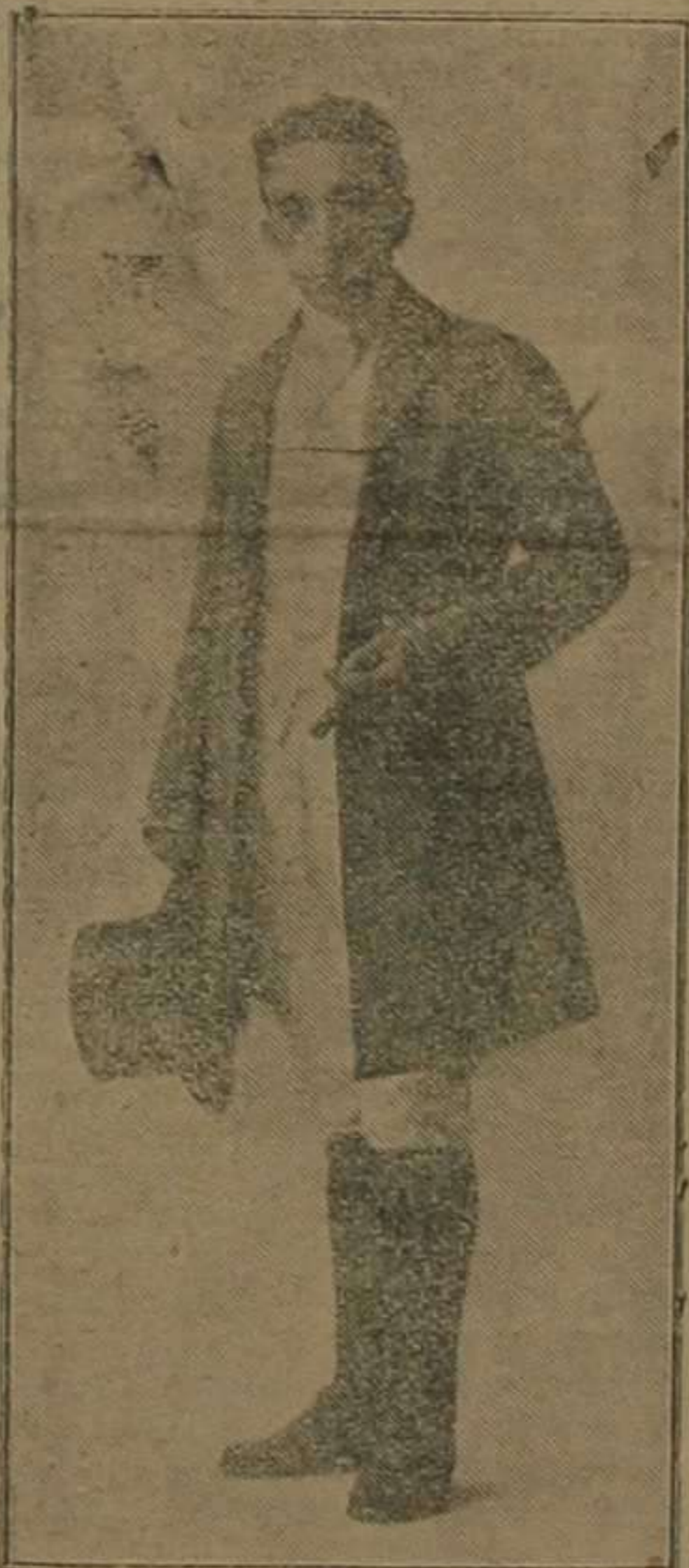
Federico Caballé en "La montería", una de sus mejores creaciones

Este enorme barítono es uno de los artistas que de más generales simpatías gozan entre el gran público valenciano. Ha sabido atráesele con su acierto para elegir obras, con la fastuosidad y riqueza jamás igualadas con que las monta, y, sobre todo, con la magia de su voz y su estilo incomparable.