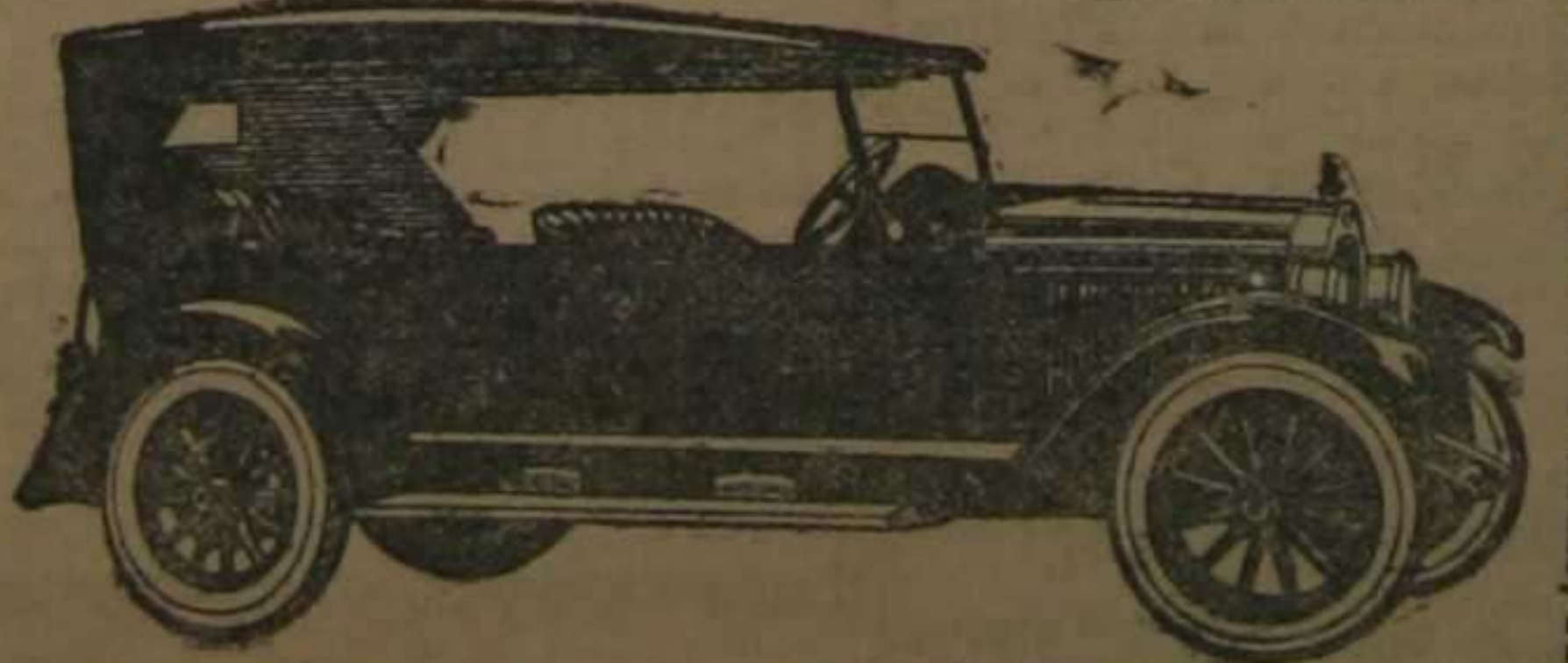
Arranque y alumbrado eléctrico en todos los modelos.

La obra que ofrecemos está limpia de ambos pecados, por lo que la recomendamos a nuestros lectores