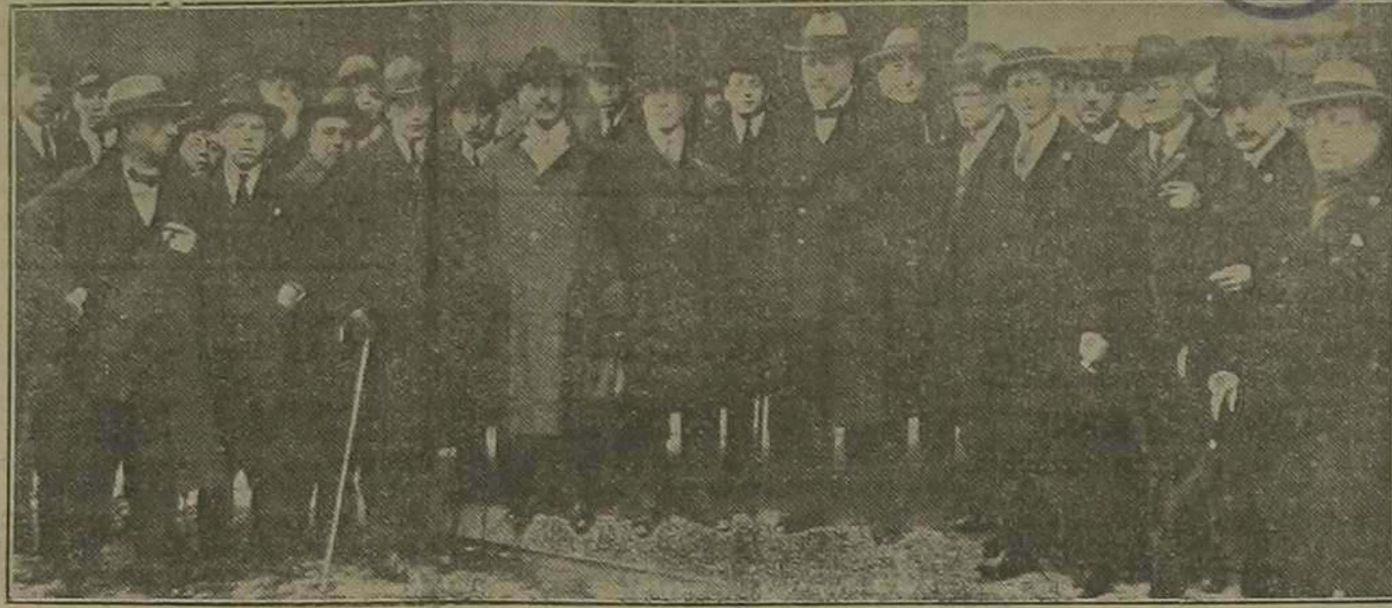
El excelentísimo señor don José Francos Rodríguez, rodeado de los periodistas valencianos a la salida de la Estación del Norte.