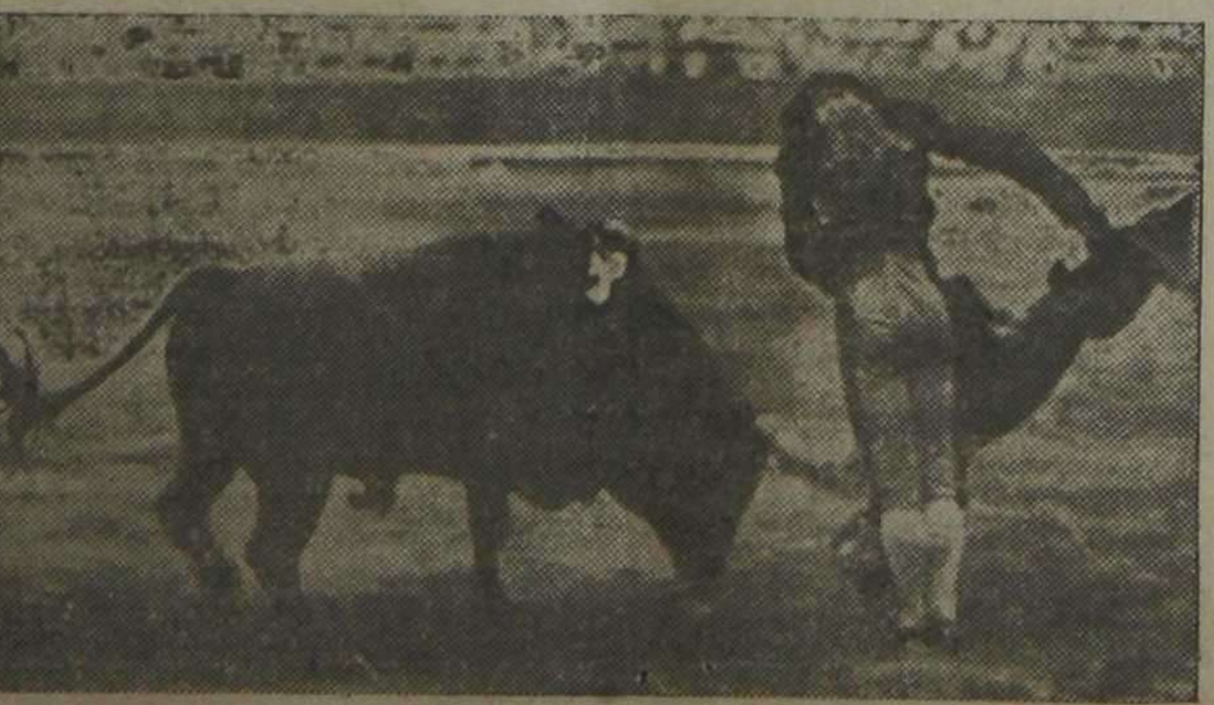
Una colosal verónica del Niño de la Palma