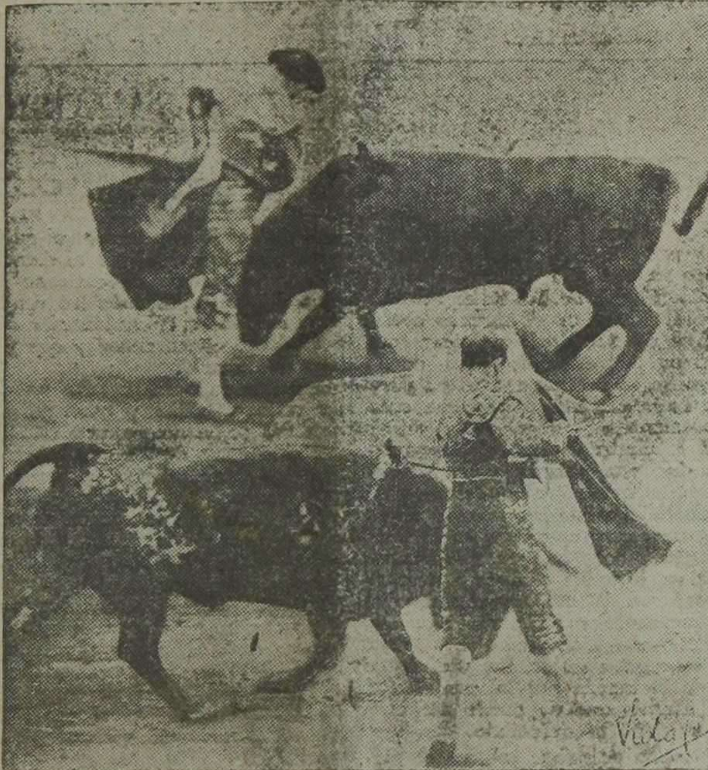
Los momentos de la lección de toreo dada ayer por Juan Belmonte.

Por fin se apiadó de nosotros la Divina Providencia. Ayer, después de cuatro fracasos, tuvimos una gran corrida. ¿Que quién hizo el milagro? Juan Belmonte, que necesitado para él el milagro de Lázaro, dice a sus compañeros: «Levántate y anda»; y no sólo los saca del pudridero, sino que también los hace triunfar.