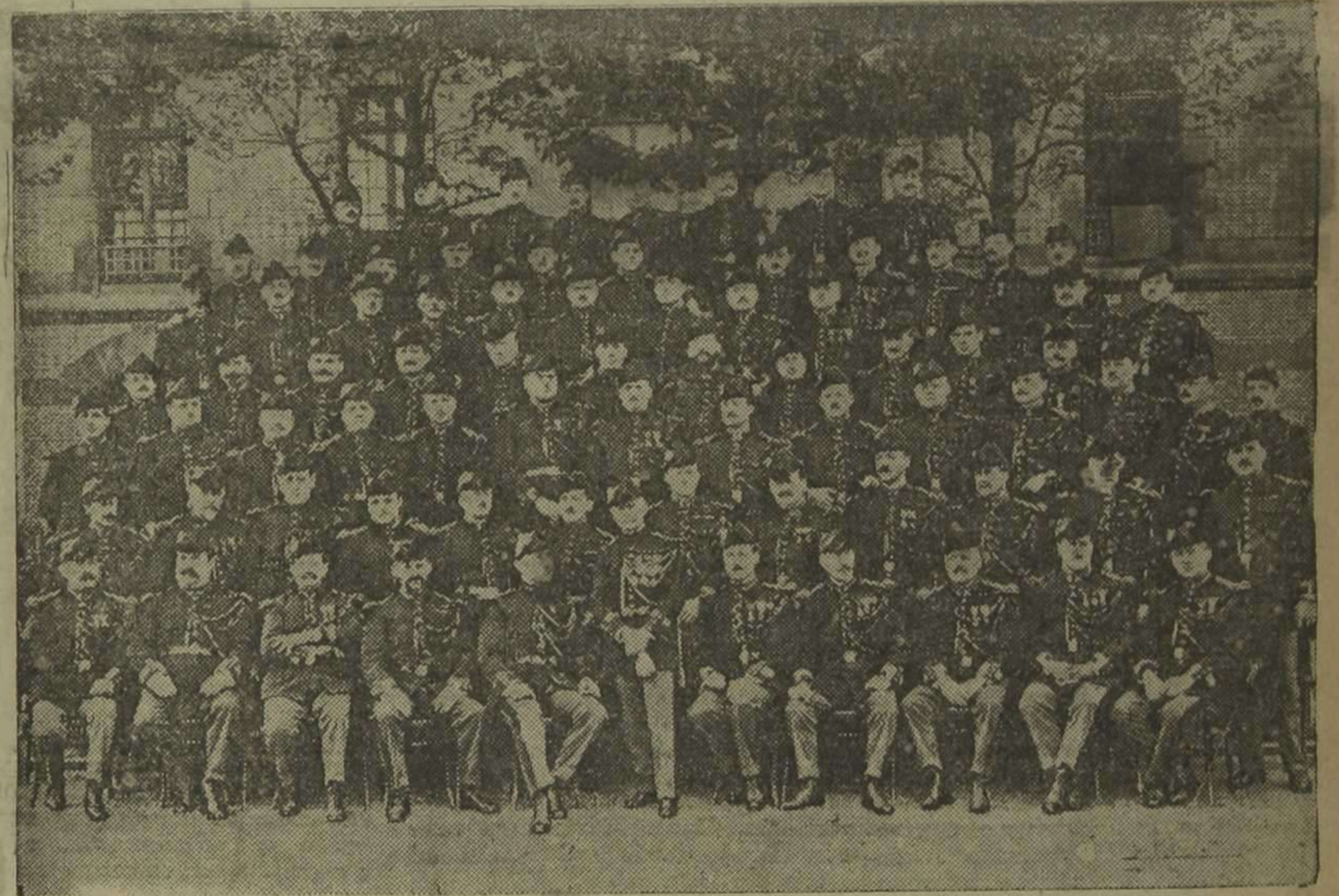
La banda de la Guardia Republicana de París.