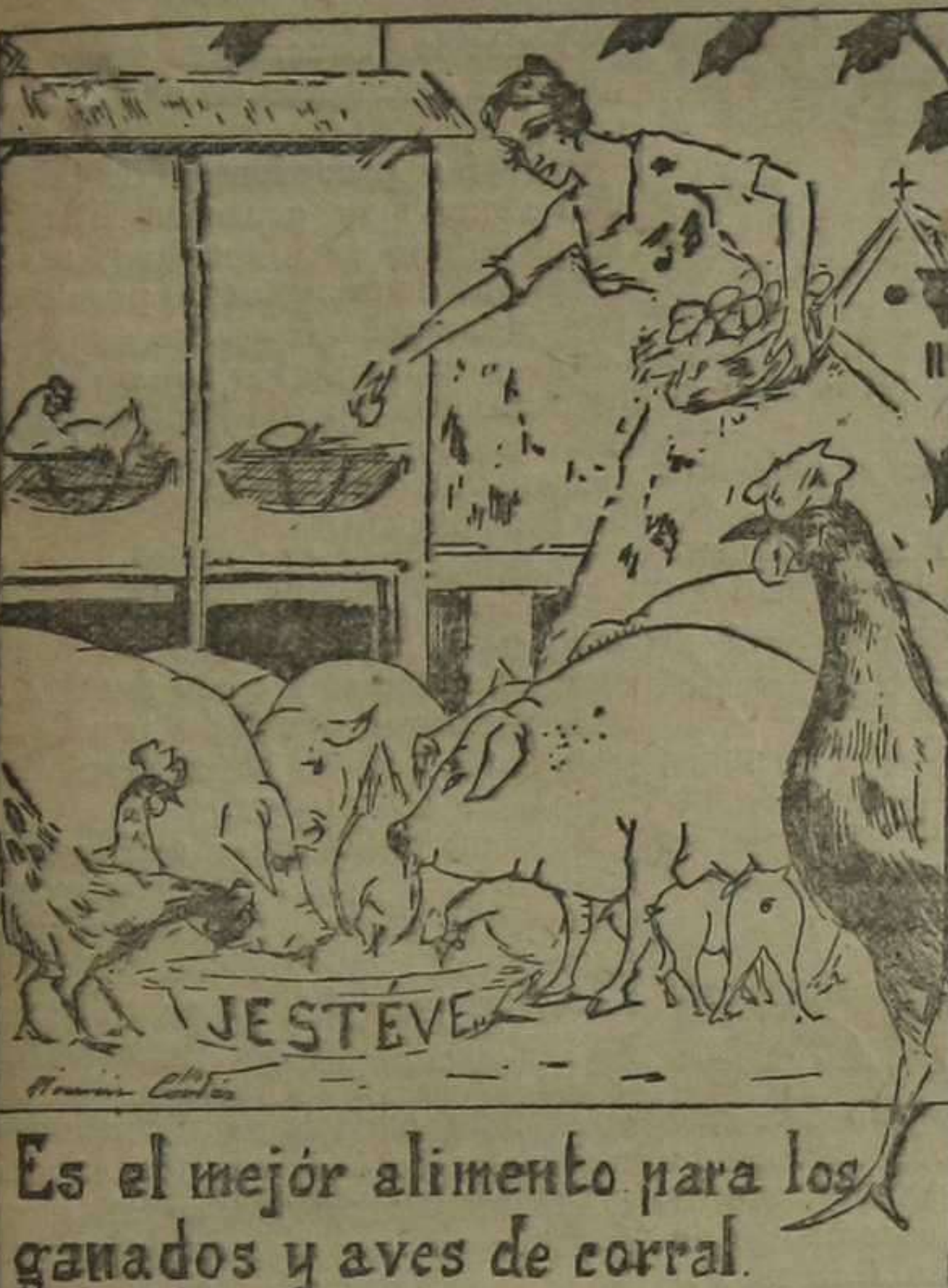
Es el mejor alimento para los ganados y aves de corral.

Depositario exclusivo para la región valenciana, Albacete y Murcia