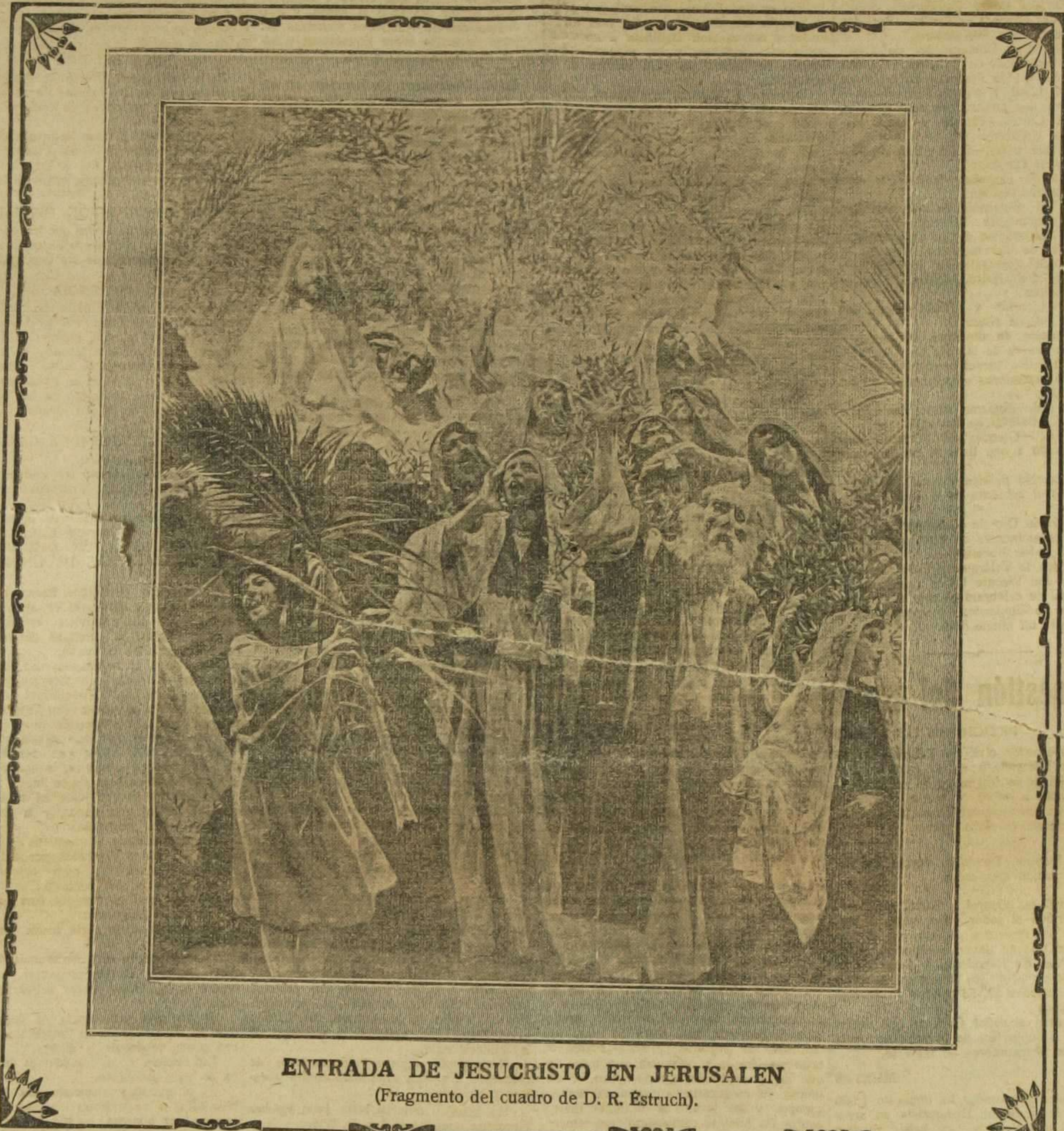
ENTRADA DE JESUCRISTO EN JERUSALEN (Fragmento del cuadro de D. R. Estruch).

Ante el ejemplo de lo que la Iglesia conmemora en el día de hoy, habrá que convenir en que es bien tonto aquel que se sacrifica por sus semejantes, suponiendo que el premio a sus esfuerzos es el del suplicio y el de la ingratitude. Por eso dice el Señor que el que se mete a redimir es crucificado, y esto pasa hoy lo mismo que pasó veinte siglos atrás. Con razón, pues, las gentes miran con prevención a los que pretenden convertirse en directores de multitudes, porque la experiencia les ha enseñado que esos que aspiran a ser caudillos y que saben que por todo premio no han de alcanzar más que odios e ingritudes, no pueden ser movidos por una noble aspiración, y en efecto, los hechos, repitiéndose, vienen a demost