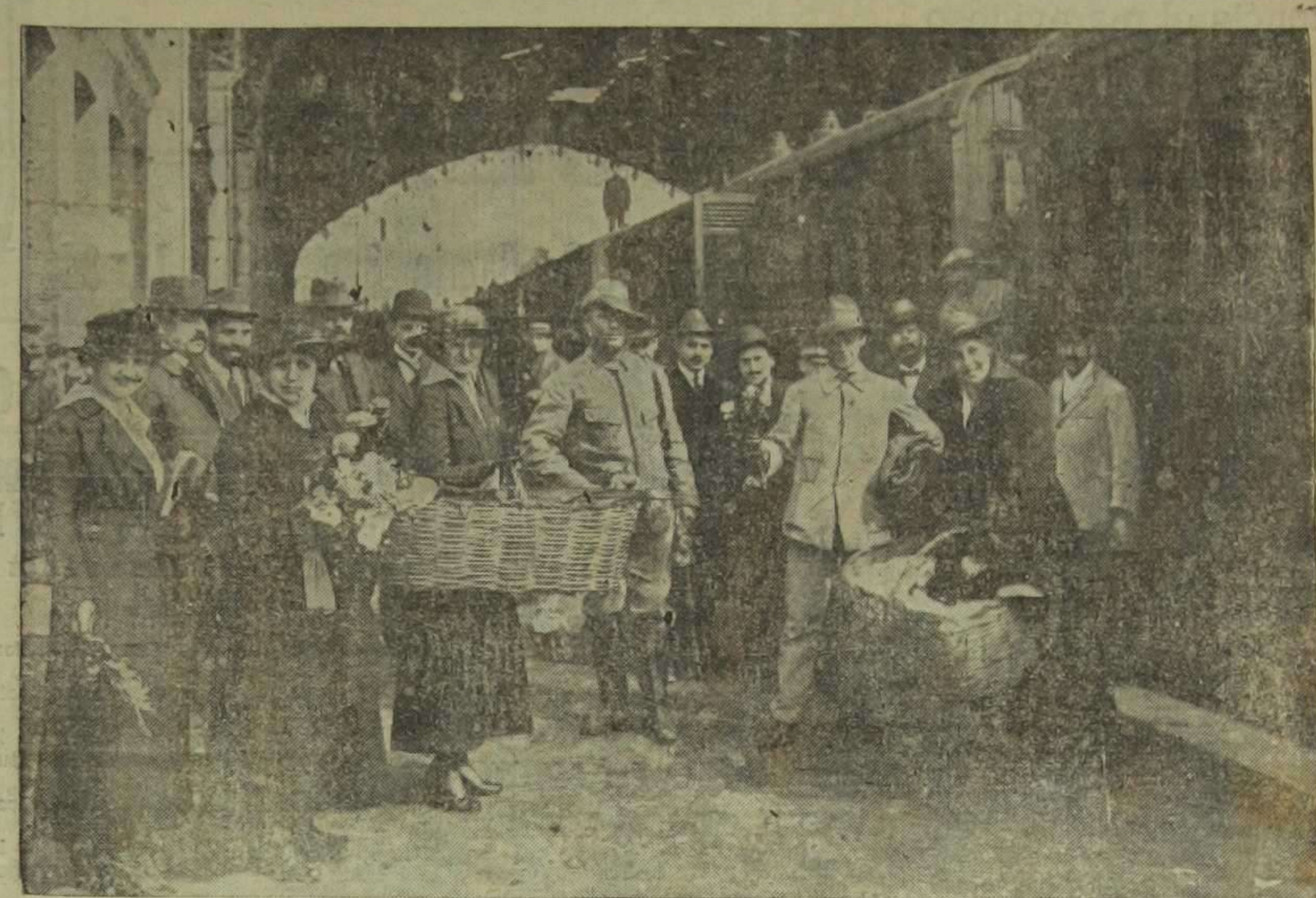
Señoras de la colonia alemana repartiendo flores a los alemanes de los Camerones internados en España