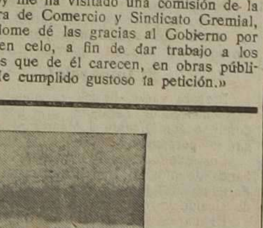
En los lagos mansurianos