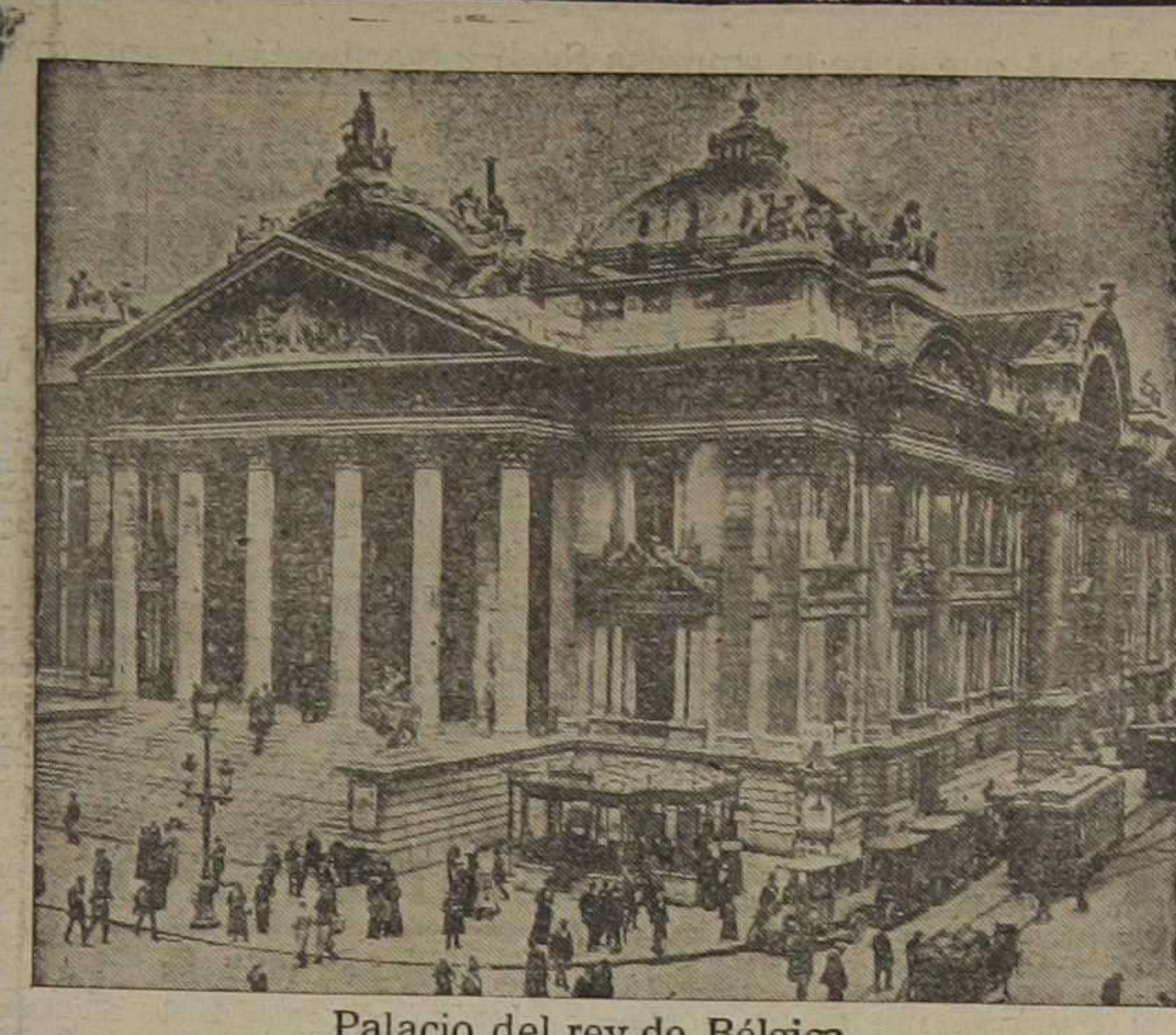
Palacio del rey de Bélgica