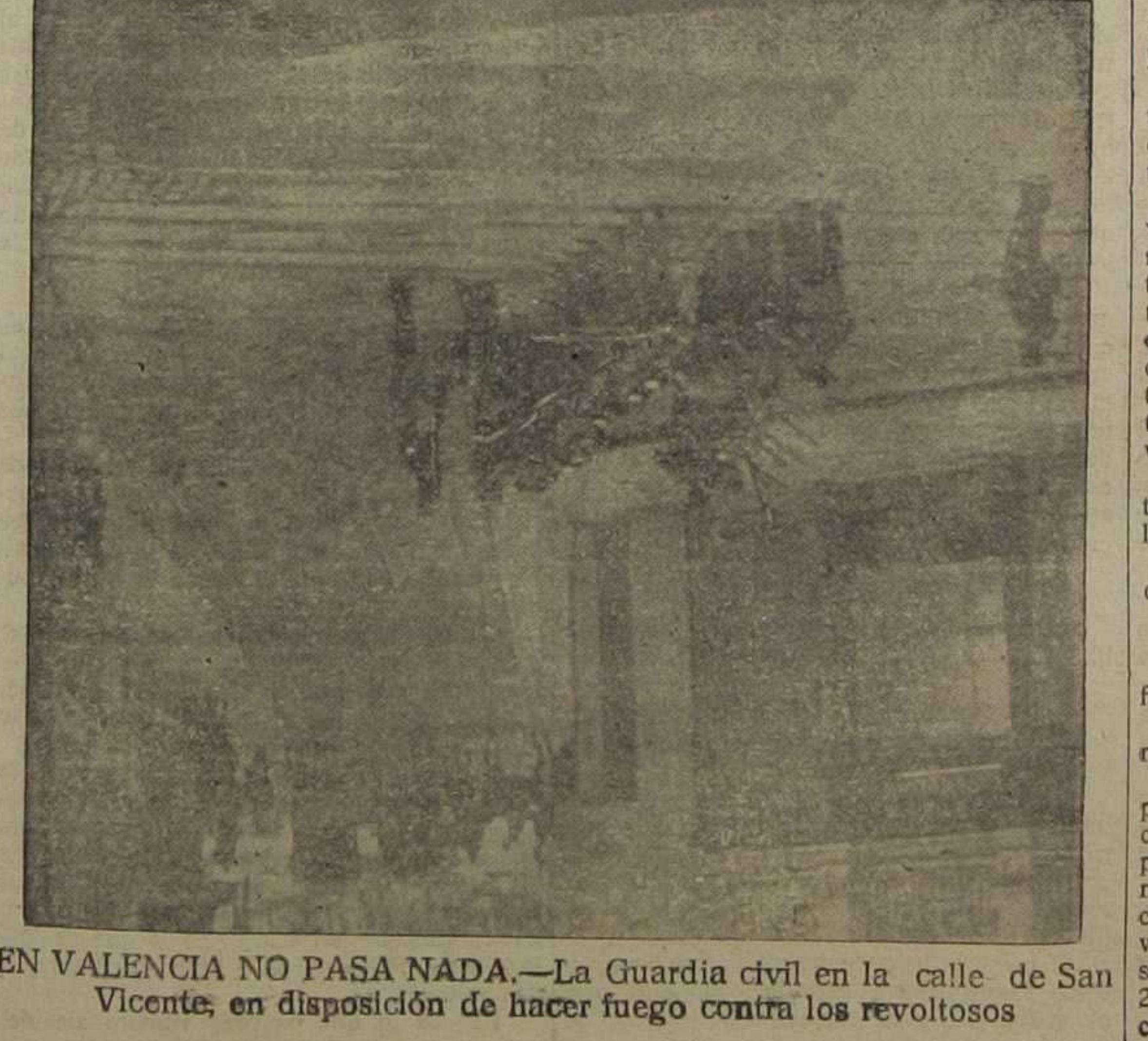
EN VALENCIA NO PASA NADA.—La Guardia civil en la calle de San Vicente, en disposición de hacer fuego contra los revoltosos