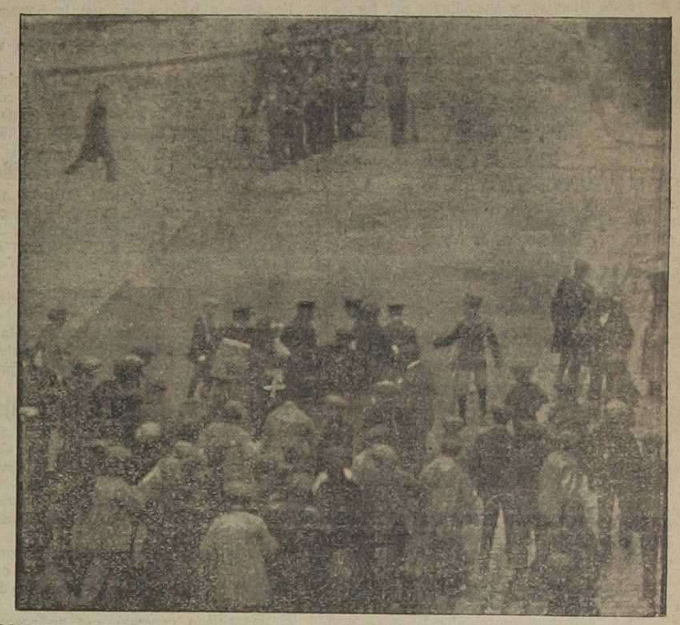
MUERTE DEL GUARDIA CIVIL.—La Cruz Roja trasladando al Hospital al guardia civil herido, en una camilla. Vista tomada en la calle Garrigues

por las calles de San Vicente, Bajada de San Francisco, Barcas y adyacentes. A las once, un pequeño grupo volvió a su tarea de levantar adoquines en la calle antes citada, y en vista de la aglomeración de gente que había por allí cerca, la fuerza de caballería dió un toque de atención, despejando a los grupos nuevamente. Las secciones de guardias de a pie que patrullaban por estos alrededores, a partir de este momento armaron los fusiles con los machetes. Después se sucedieron aisladas escaramuzas con las consiguientes cargas y carreras. Reunión del Comité de huelga Se constituyó ayer en la Constructora Valenciana. Después de cambiar impresiones marcharon los obreros que componen el Comité al Ayuntamiento, citados por el alcalde accidental. En los centros obreros se notó más animación que anteaer. La fuerza pública, agredida Guardia civil muerto A las once y media de la mañana aumentaron los grupos en el Parque, plaza y Bajada de San Francisco. La fuerza pública se vió obligada a dar nuevas cargas, despejando los jardines y obligando a marchar a muchos obreros que se habían refugiado en los maticos. Nuevamente los grupos intentaron avanzar la barricada, y acudió la benemérita. A partir de aquí es imposible, con toda exactitud, relatar lo ocurrido. Los revoltosos, en número crecidísimo,